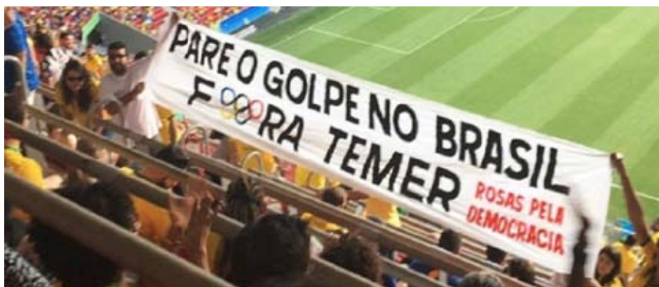
Tilskuerprotest mod statskuppet under en fodboldkamp mellem Brasilien og Sydafrika, Brasília 4 august 2016. Banneret siger: Stop statskuppet i Brasilien – Ud med Temer.

tester – både udøvere og tilskuere har benyttet anledningen til at vise deres modstand mod interimsstyret og den nye præsident ved brug af plakater med «fora Temer» – «ud med Temer»