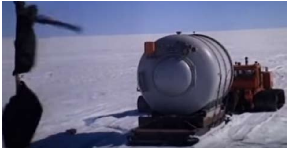
Atomreaktor fragtes med bæltetraktor til den amerikanske base "Camp Century" under Grønlands indlandsis.

Danmark var bekendt med tilstedeværelsen af atomreaktoren og gav tilsyneladende tilladelse til deponering af en vis mængde radioaktivt affald.