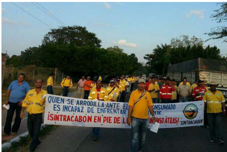
Minearbejderne ved Cerrejón minen i strejke i 2013

Minedriften har betydet, at den oprindelige befolkning er fordrevet fra jorden og har mistet dette som livsgrundlag. Desuden er floder og skovområder forurenet, hvilket har ødelagt jagt og