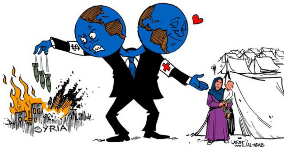
Verdenssamfundets rolle i Syrien