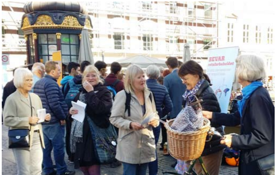
Folkebevægelsen mod EU's vellykkede valgkamp mod afskaffelse af retsforbeholdet

Folkebevægelsens nuværende enlige parlamentsmedlem, Rina Ronja Kari, er medlem af Enhedslisten. Hun afløste Søren Søndergaard, som vendte tilbage som medlem af Enhedslistens folketingsgruppe. Også hans forgænger Ole Krarup var medlem af Enhedslisten,