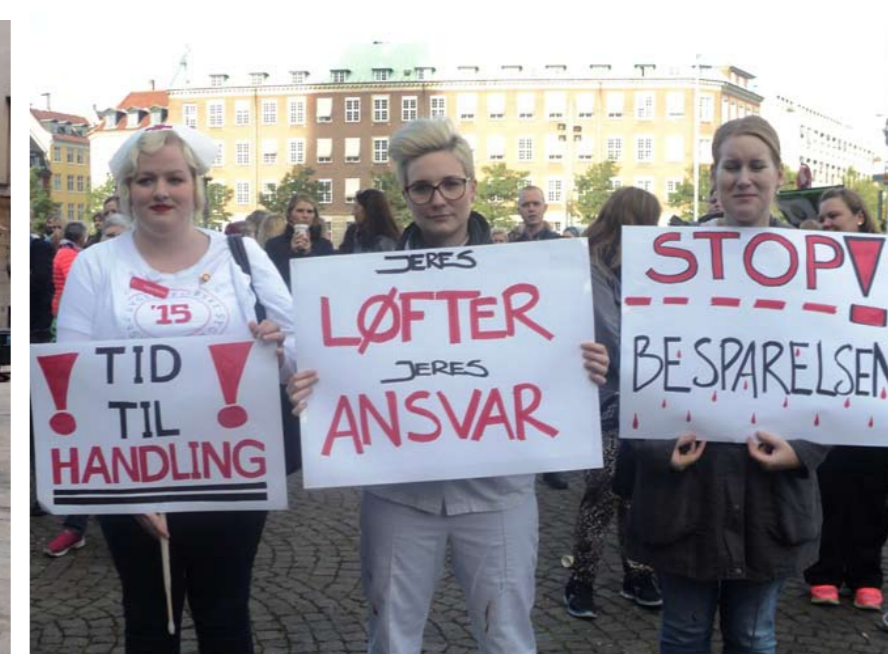
Sundhedspersonale fra alle sektorer demonstrerede foran Christiansborg den 2. oktober. Der er skåret ind til benet på de offentlige hospitaler og i sundhedssektoren, og nu siger man fra.