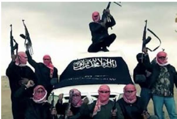
Jabhat al-Nusra - al Qaeda-allierede i Syrien