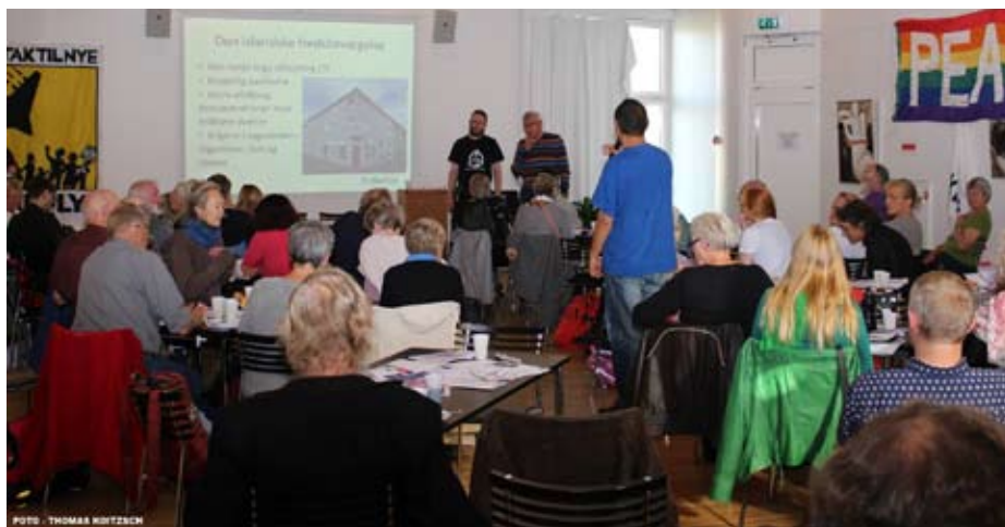
Fredsfestival 2015 i Århus

1. april 2014 spredte Ahmad Jarba via Twitter billeder fra sit besøg i den "befriede" by Kessab. Det er en lille by i det nordvestlige Syrien ved grænsen til Tyrkiet med en hovedsagelig armensk kristen befolkning. Billederne af Jarba i Kessab blev bragt i utallige vestlige landes mainstream-medier.