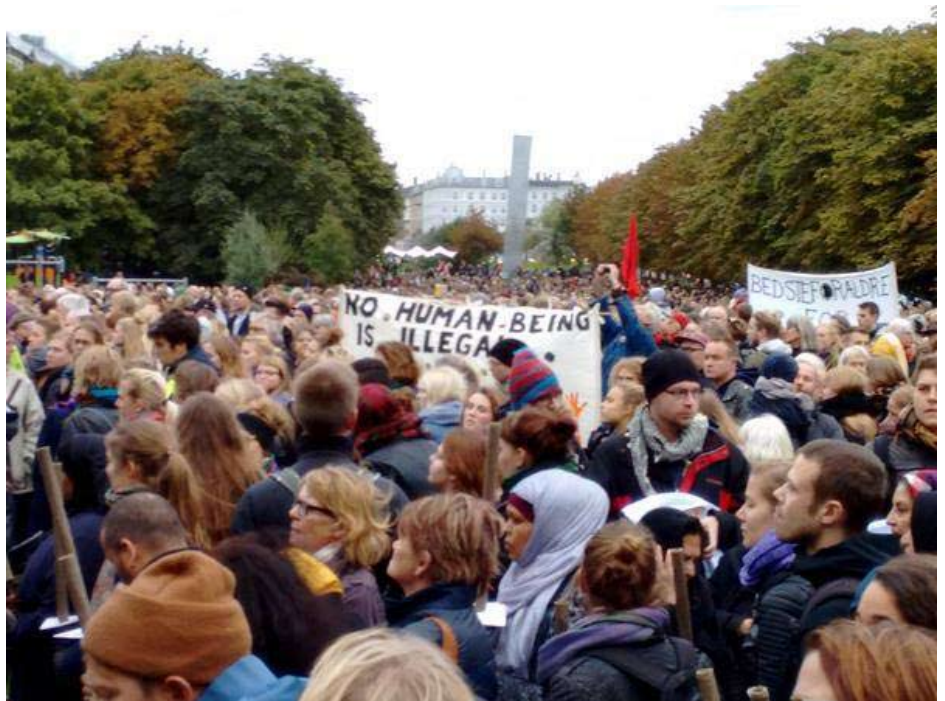
Fredens Park ved søerne fyldt op den 6. okt.

for mere krig og mere EU. Uanset om det er en V(DF)-regering, eller den er ledet af socialdemokrater. Det betales med nedskæring på nedskæring, med lønnedgang og velfærdsforringelser.