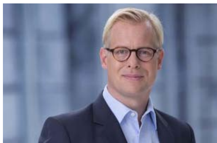
Carl Holst Forsvarsminister i 93 dage 28/6-2015 - 30/9-2015

Carl Holsts karriere som krigsminister blev uventet kort. Nu er Peter Christensen hentet ind for at stå i spidsen for det dybt upopulære køb af kampfly, samtidig med at V(DF)-regeringen skærer i 'kernevefærden'. De er begge tidligere formænd for VU, der tæller en bemærkelsesværdig række skandaleombruste, løgnagtige og kriminelle ministre. De har ikke mindst et hovedansvar for den danske krigspolitik og for sammenbruddet af Skat.