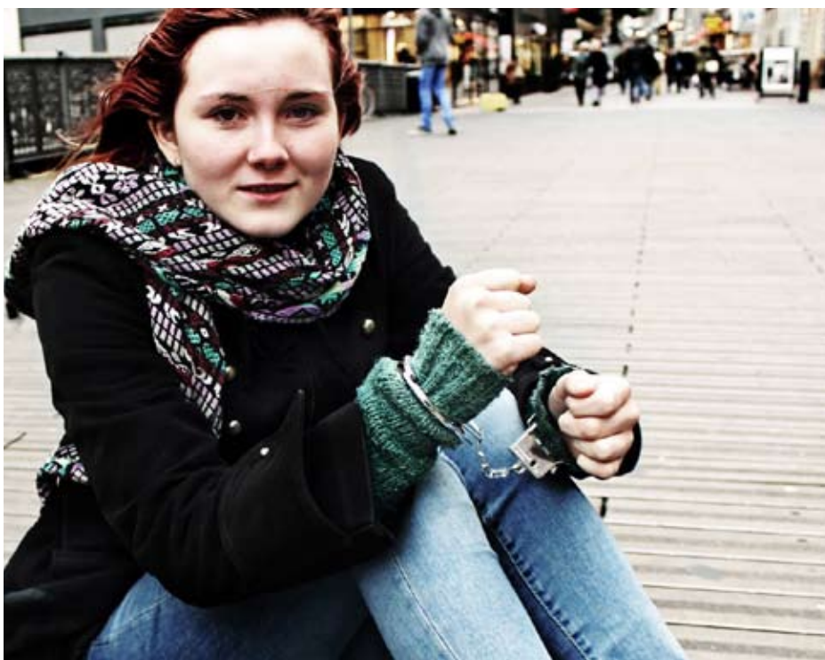
Gymnasieelever på gaden i Århus for at protestere i mod besparelser på uddannelse i forbindelse med folketingets åbningsdag. DGS Østjylland skriver: Det gjorde vi, fordi vi mener, at regeringens milliardnedskæringer vil fastlåse unge. Sig nej til besparelser og ja til en fremtid med kvalitet!

Det vil betyde aflyste timer pga. manglende vikarer, specialtilbuddene til eksempelvis ordblinde og elever med autisme vil blive sparet væk, talentudviklingsforløbene bliver afskaffet og mange rektorer melder ud, at det uvægerligt vil føre til fyringsrunder.