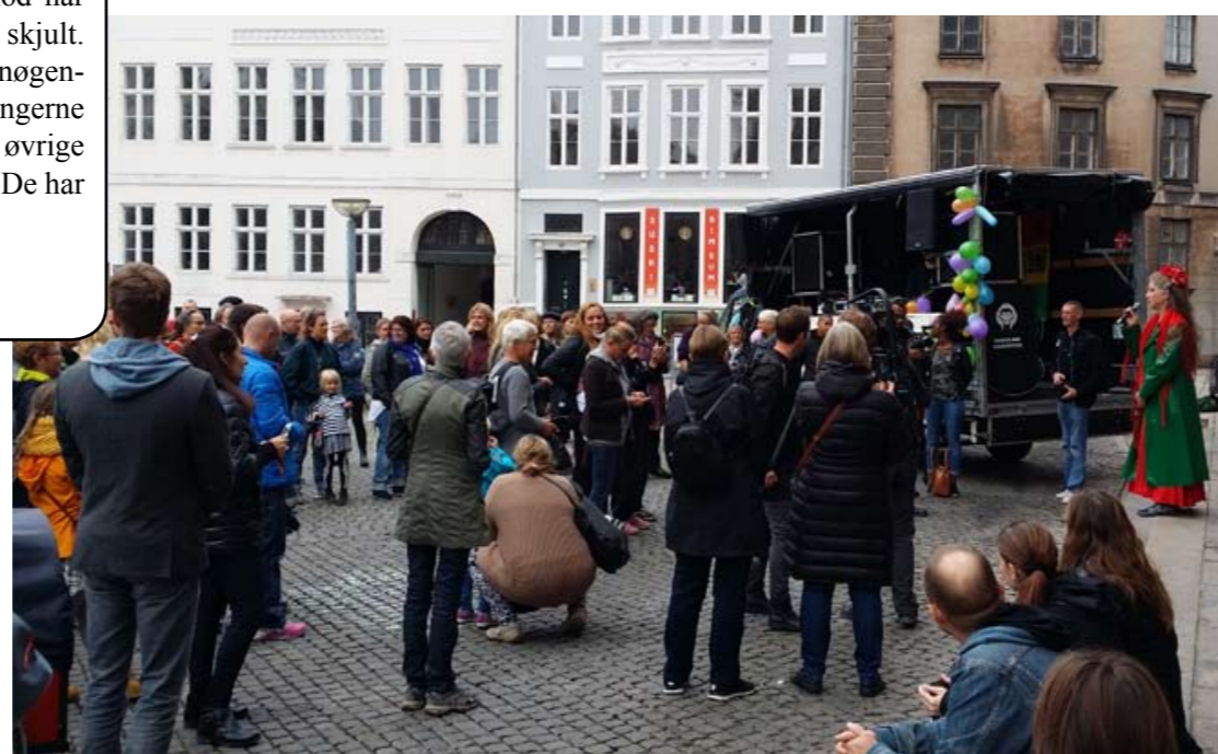
En gruppe piger fra De stærke Børn stod bag en demonstration d. 4. oktober foran Københavns Byret. Det er børn der har oplevet totale svigt, men har kæmpet sig frem til at blive stærke. Demonstrationen sagde et stort NEJ til at sænke den kriminelle lavalder til 12 år.