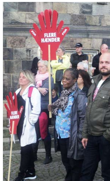
Sosu'er ved sundhedsarbejdernes protest 4. oktober

Og Dansk Folkeparti er parat til (mod et par allerede aftalte indrømmelser) at blåstempe det hele som 'velfærdssikring'.