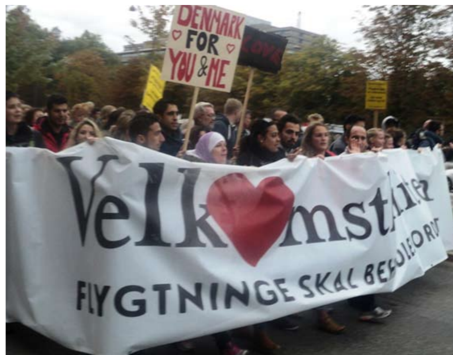
Det var københavnere af alle aldre, farver, køn og nationale baggrunde, der stod og gik skulder ved skulder for at vise solidaritet og sammenhold på tværs af alle skel. Ved demonstrationen til folketingets åbning.