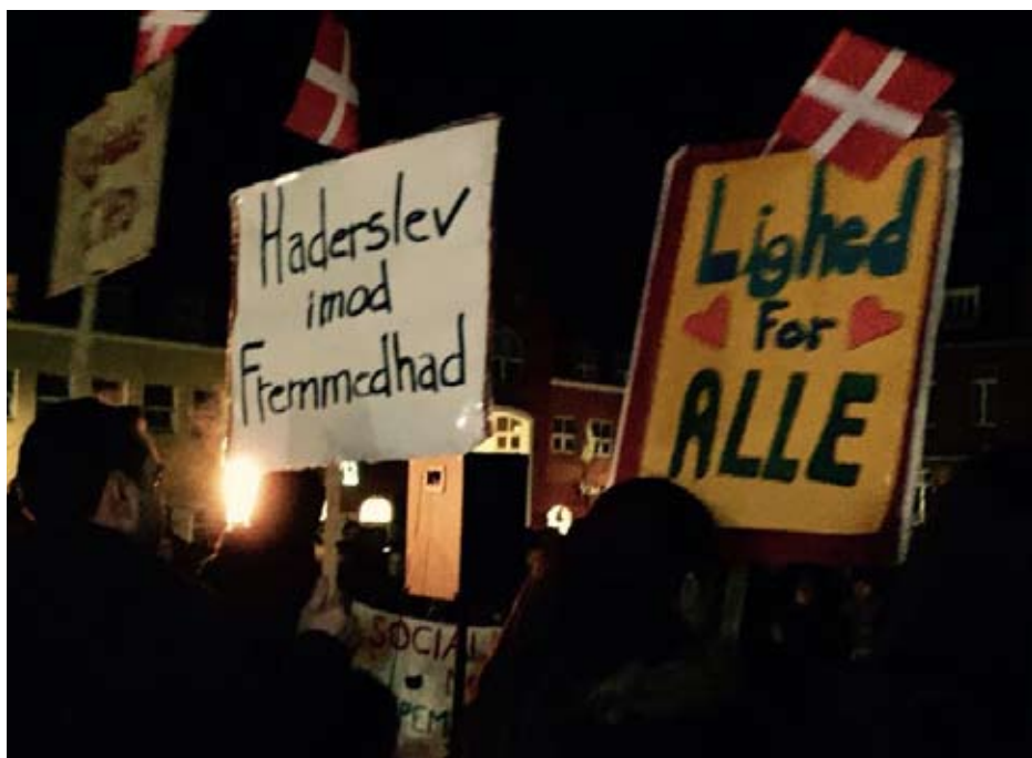
Moddemonstration i Haderslev 5. januar mod Stop Islamiseringen af Danmark

vertogt, men som et korstog mod islam. 'Karikaturkrisen' styrkede den islamske fundamentalisme.