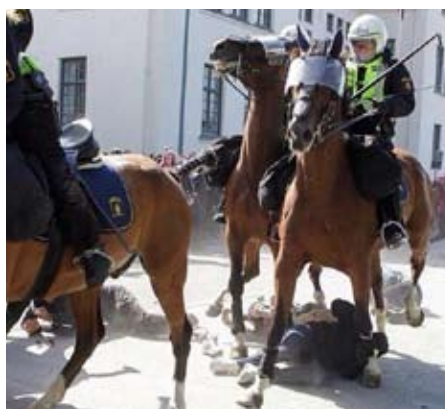
Svensk uro-politi rider direkte ind i anti-fascistisk demonstration i Malmø i august 2014. Hvis denne situation havde fundet sted under en lov som Spaniens anti-protestlov, havde det kostet en bøde på over 200.000 at tage, bringe eller dele dette billede af brutal og livsfarlig politivold.