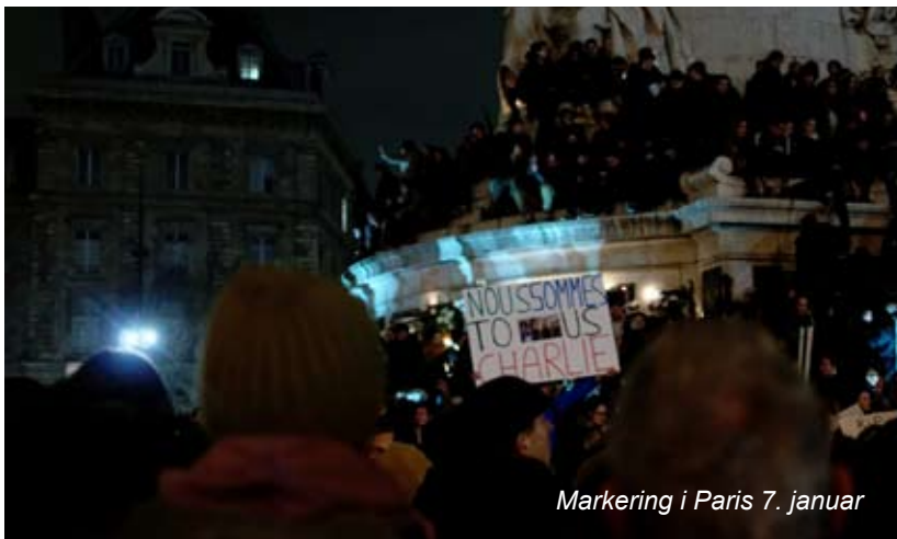
Markering i Paris 7. januar

I Frankrig står regeringen i forreste række som en imperialistisk magt, der forsøger at bevare kontrol i sine tidlige-