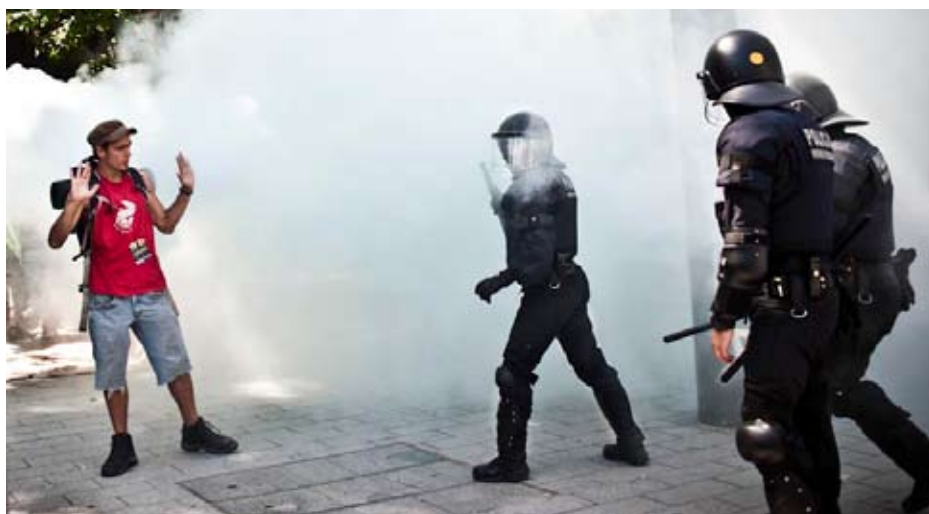
Spansk politi ryder demonstration ved Cataloniens parlament 15. juni 2011

Politivold og anvendelse af hårdhændede metoder som tåregas, gummikugler, vandkanoner m.m. har været flittigt brugt i den spanske klassekamp, som vi ser det over hele verden i disse år. Alle steder bliver politiet og deres særlige kamptropper sat ind for at holde protester og organisering nede for at forsøge at forhindre, at protesterne vokser og i sidste ende antaster selve det kapitali-