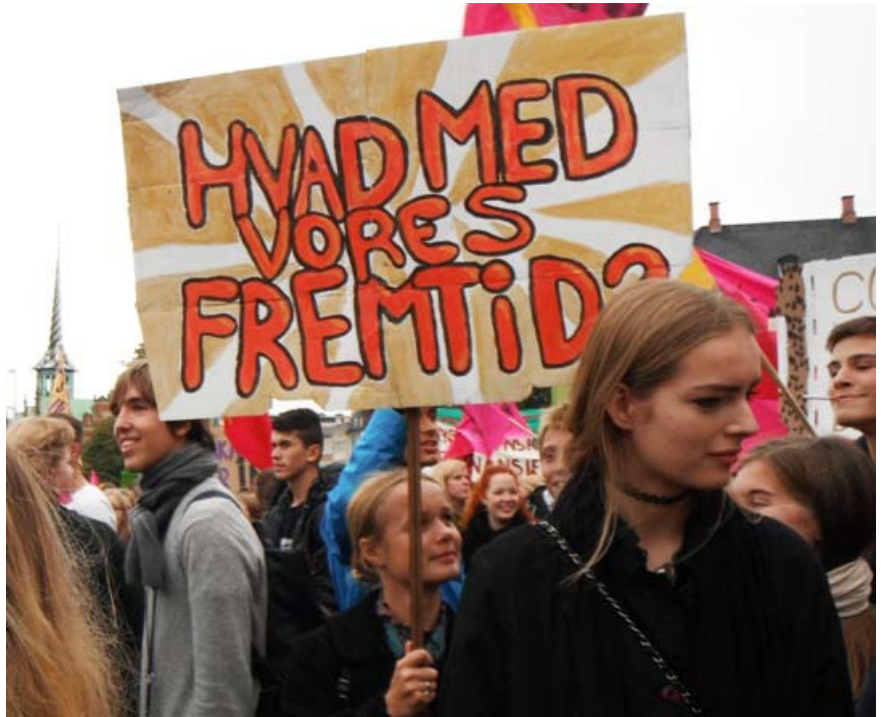
Unge kræver handling - demo 9. oktober 2014

Borgerskabet har trods en overdøvende strøm af "Glam-budskaber" en klar strategi. Det store flertal af den unge generation skal være villige soldater i produktionen i deres nyliberalistiske