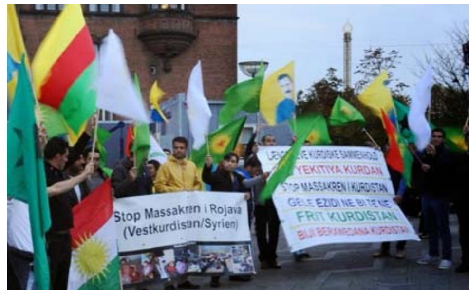
Fakkeltog for Kobane i København den 9. oktober