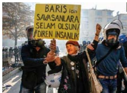
Tak til dem der kæmper for fred!

Det er et forbløffende sceneri, verden er vidne til under den islamistiske terrorgruppe IS' angreb på den kurdiske by Kobane.