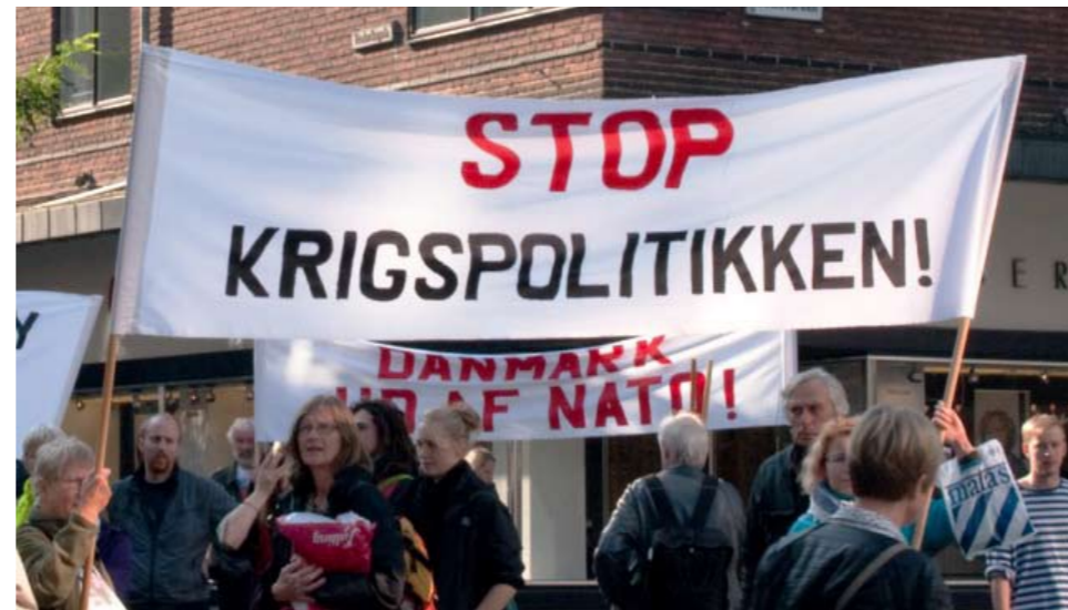
Demonstration i Århus mod Krigspolitikken, 4. oktober.