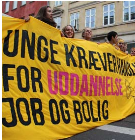
Unge kræver handling - for uddannelse, job og bolig! Demonstration 9. oktober.

Regeringens forslag favoriserer ubestrideligt også denne gang klasse-mæssigt unge fra velstillede og akademikerfamilier.