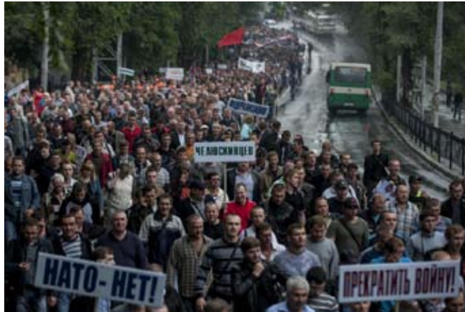
Minearbejdere i Donetsk i protestdemonstration 18. juni 2014

En række tyske fagforeningsfolk fra IG-Metall og ver.di har erklæret deres solidaritet med de strejkende minearbejdere.