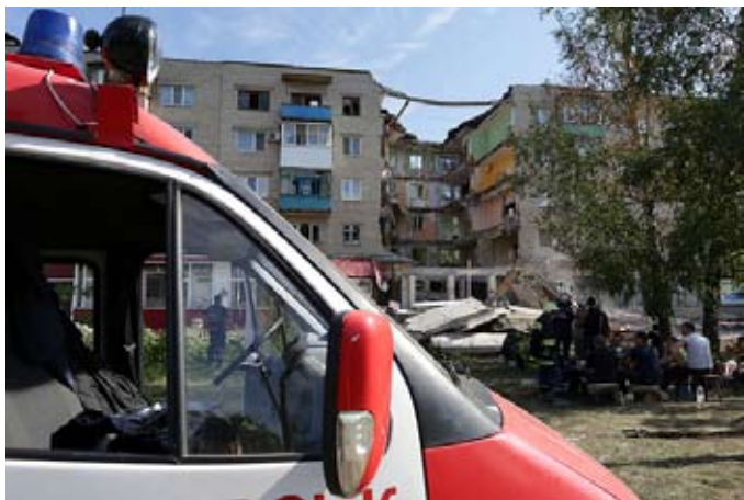
Adskillige blev dræbt da den ukrainske kupregerings styrker den 3. juli begyndte en offensiv mod separatister i Sloviansk. Billedet viser en ramt boligblok i Mykolayivka, en forstad til Sloviansk.

Den kapitalistiske stormagt Rusland er under stærkt pres fra EU, NATO og USA. Disse konfliktpartnere truer konstant Rusland med økonomiske sanktioner i tilfælde af, at de indre udviklinger i Ukraine ikke retter sig efter vestlige forestillinger. EU, NATO, USA og Berlin forholder sig aggressivt og krævende. Ikke et kritisk ord om og til den ukrainske regering.