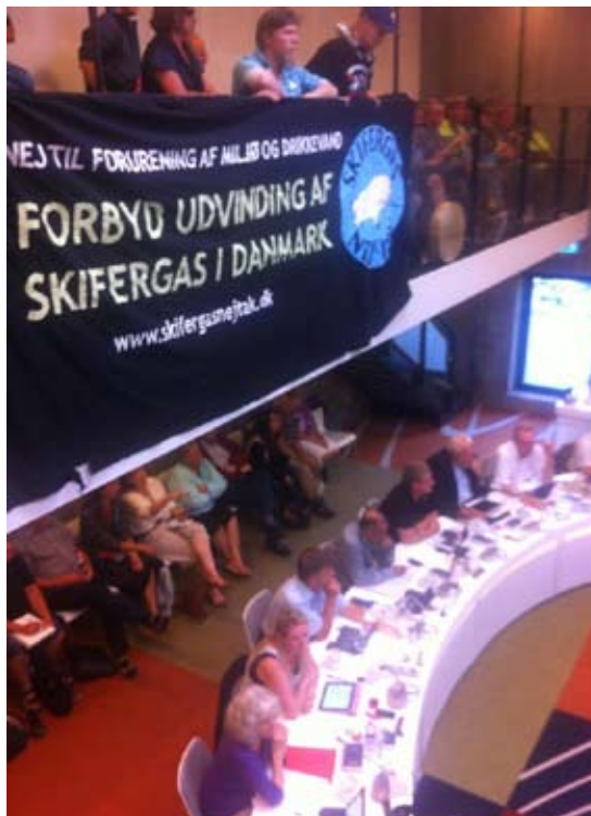
Billede: Aktion under byrådsdebatten d. 25. juni - Skifergas - Nej tak

Udvindingen af både skifergas og tjæresand spreder kemikalier som arsen og både hormonforstyrrende og radioaktive stoffer, der spredes gennem luft og vand. Grundvandet ødelægges, og de giftige følger ses i fuld flor i Canada og USA. Der meldes om cancer og en række andre sygdomme. Vandressour-