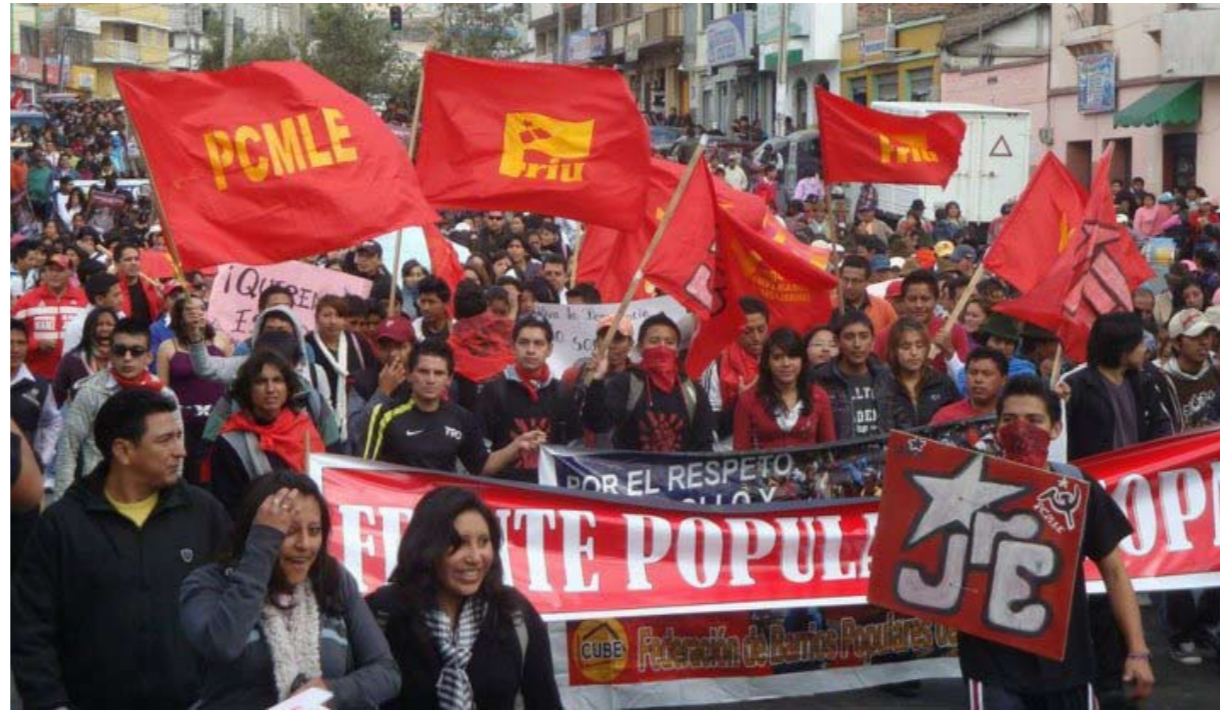
Den Internationale Konference af Marxistisk-Leninistiske Partier og Organisationer blev stiftet ved et møde i Quito i august 1994 med Ecuadors Marxistisk-Leninistiske Kommunistiske Parti som vært. PCMLE fylder lige som Spaniens Kommunistiske Parti (marxister-leninister) 50 år i 2014.

og deres lakajer, at "historien var slut", at "kapitalismen ville vare evigt" og "en ny verdensorden", de forkyndte et fredeligt, velstående samfund uden kriser, bygget på en "selvfornyende kapitalisme", baseret på en "kapitalistisk globalisering", som ville blive bygget "hinsides klasserne og klassekampen". Det er imidlertid ikke velstanden, der øges, men elendigheden. I stedet for fred er det krig og kup og tab af tiltro til diktaturerne, vi har set i de sidste årtier.