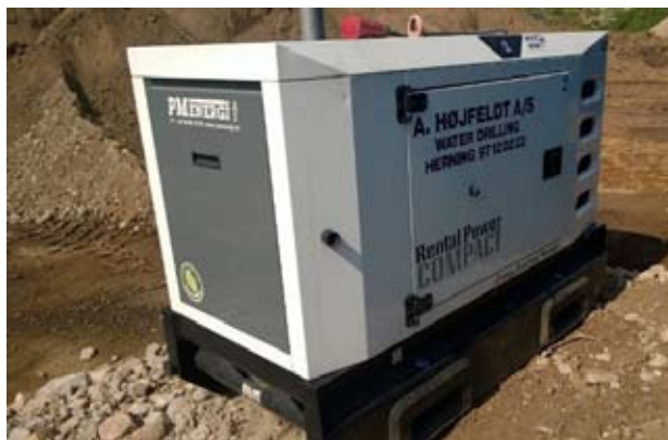
Udstyret er parat ved Dybvad i Nordjylland.

Prøveboringerne var planlagt til at gå i gang i 2013 i Frederikshavn Kommune, men byrådet sagde stop og kræ-