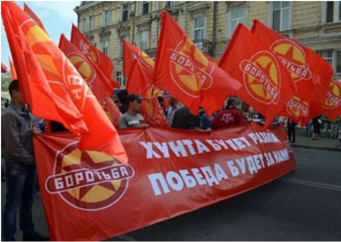
Det marxistiske Boroth ('Kamp') ved 1. maj 2014 i Odessa

en vigtig del af det tidligere Sovjetunionens økonomiske struktur, protesterede mod Kiev og de fascistiske bander, som begyndte at foranstalte terrordrab og massakrer i Østukraine. Udråbelser af folkerepublikker i Donetsk og Lugansk-regionen fulgte efter sammen med dannelsen af militser, som fordrev Kiev-regeringens repræsentationer.