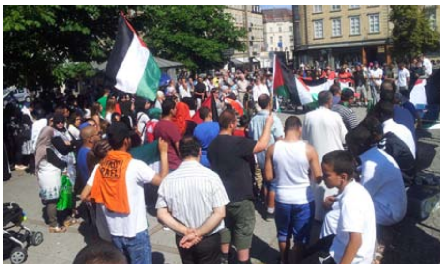
I Århus samledes omkring 300 til demonstrationen under parolen 'Stop krigen - Fred i Palæstina'