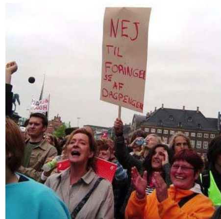
Danskerne har protesteret mod EU's nyliberale reformer: De videreføres af SRSF-regeringen med Enhedslistens stemmer

- Det er et signal om, at vi har brug for, som nation og som individer, at få sulten tilbage - at have et større eg et an-