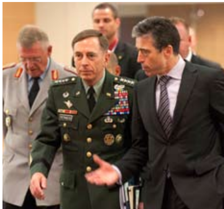
Tidligere statsminister Anders Fogh og tidligere CIA-chef David Petraeus

satte Morten Storm. Og sønnen ville føre en hånd over sin strube og sige: »Jeg vil skære hans hoved af med et sværd.«