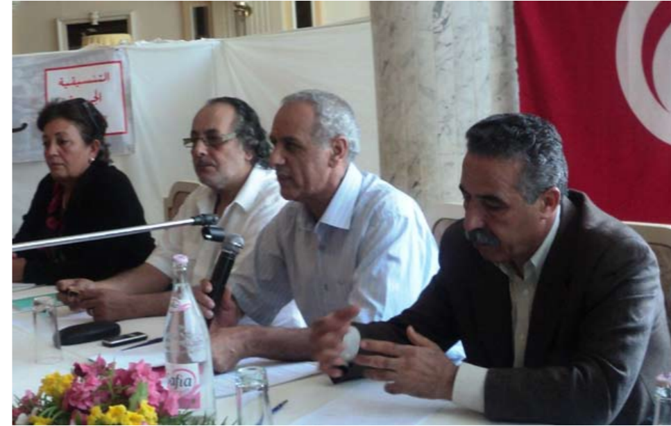
Den lokale afdeling af folkefronten i Sousse præsenteres på pressemøde den 6. november 2012

I oktober 2012 blev der afholdt valg til den grundlovgivende forsamling. Ennahdah-partiet, der kaldes 'moderat islamistisk', og hvis ledere var i eksil under Ben Ali, vandt og dannede regering. Partiet lovede i valgkampen at skabe jobs og at gennemføre mange andre af revolutionens krav. Men ingen af dem er holdt. De lovede også at undlade at indføre religiøse bestemmelser i den nye forfatning, som endnu ikke er fremlagt. Men da det meddelte, at den i et vist omfang skulle bygge på sharia, brød protesterne løs. Tu-