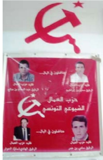
Fire martyrer fra opstanden mod Ben Ali i begyndelsen af 2011

Det var ikke mindst de unge, der var aktive under opstanden, der jog Ben Alis politi og sikkerhedsstyrker væk fra gaderne og drev diktatoren på flugt. Han søgte asyl i Saudiarabien. Først nu, mere end halvandet år senere, er politiet for al-