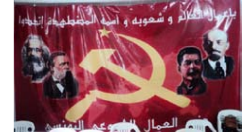
Vægtæppe i Tunesiens Arbejderpartis lokaler i Sousse

Vi var inviteret til Tunesien og Sousse for at deltage i et internationalt seminar under forsæde af POTs legendariske leder Hamma Hammami, som spillede en central rolle i modstanden mod Ben Ali under hele hans diktatur og var retningsvisende under revolutionen. Seminaret havde titlen 'Den kapitalistiske krise og de sociale bevægelser' og havde repræsentanter fra en snes lande fra Europa, Mellemøsten, Asien, Afrika og Latinamerika – og tilhørere og deltagere fra alle de 12 partier, der indgår i den tunesiske folkefront, der blev dannet den 26. september med en landsledelse bestående