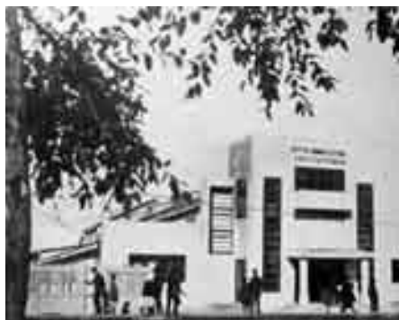
Teatret i det autonome jødiske område i Sovjetunionen

Zionister beskylder Karl Marx og marxismen for at være antisemitisk. Det samme beskyldes det socialistiske Sovjetunionen under Lenin og Stalin for at være. Men det er løgn og propaganda.