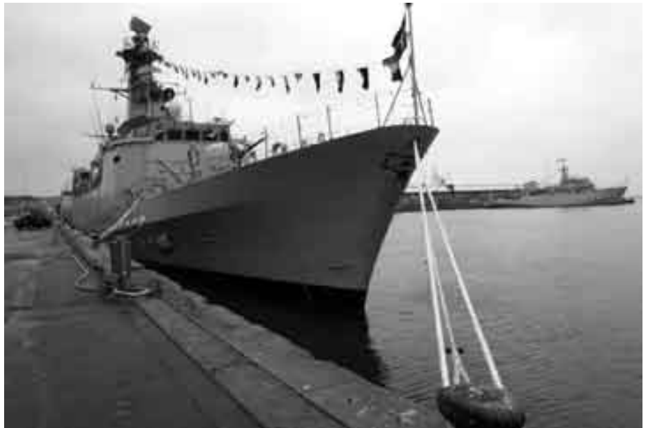
På rekrutteringsdagen for den danske flåde blev små børn i Århus inviteret om bord på korvetten Olfert Fischer, et af de danske bidrag til krigen mod Irak i 1990 og i 2003.

Samtidig med at der blev indkøbt helikoptere i dyre domme, omstrukturerede forsvaret en del af Flyvestation Karup til en samlet enhed med ansvar for at forberede udstyr og folk til krigsdeltagelse, samt den mere civile ende med