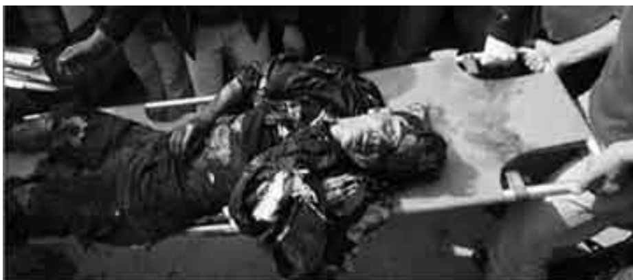
Dræbt palæstinensisk barn i Gaza