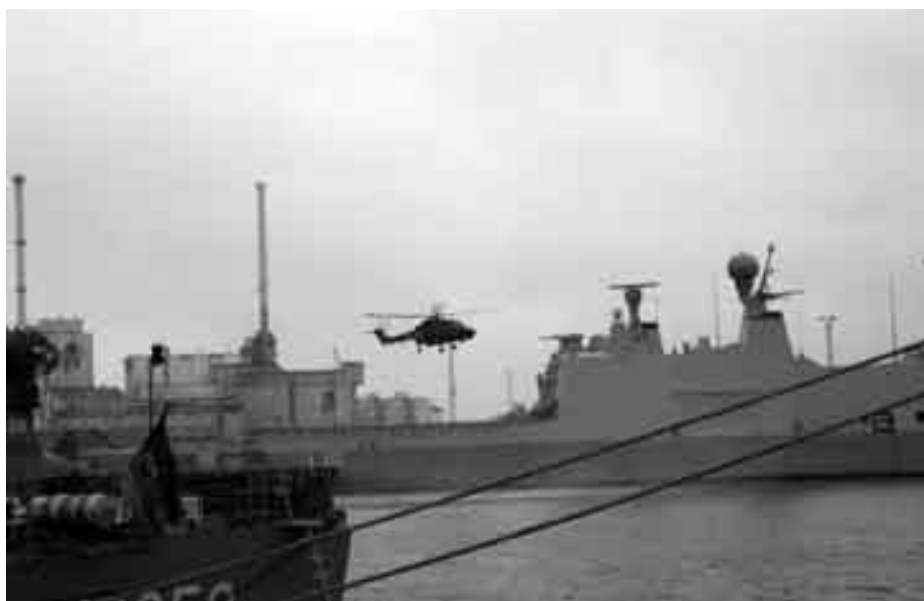
I baggrunden det danske støtteskib Absalon, der med et nyt radarsystem er særligt velegnet til kystnær krigsførelse.

I sommeren 2007 fik de potentielle leverandører besked på, at den formelle udbudsrunde ikke ville blive fulgt på grund af tidspres. Det er en afvigelse fra den anbefalede praksis efter Tårnfalk-skandalen, hvor netop en grundig beskrivelse af, hvilke krav det forventedes, at et firma kunne leve op til, skulle udarbejdes, førend der kunne indhentes tilbud.