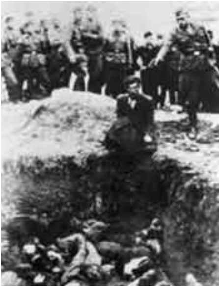
Nazistisk massehenrettelse af jøder i det besatte Ukraine

side et led i den progressive nationalitetspolitik, her i forhold til nationale mindretal, og dels et modtræk fra den ateistiske socialistiske stat mod judaismen , den jødiske religion, og zionismen , drømmen om et jødisk hjemland, som deltes af både sekulære jøder og religiøse. Som de øvrige religioner er judaismen stærkt antikommunistisk. Også zionismen var fra starten fjendtlig over for socialismen og Sovjetunionen.