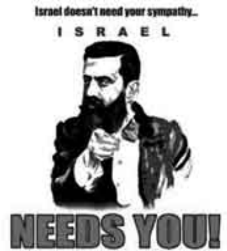
Den moderne zionismes grundlægger Herzl på israelsk hverveplakat

"Jeg anser ikke jødespørgsmålet for et socialt eller religiøst spørgsmål, selv om det har dele af begge. Det er et nationalt spørgsmål, og for at løse det må vi frem for alt gøre det til et politisk verdensspørgsmål, som skal reguleres i