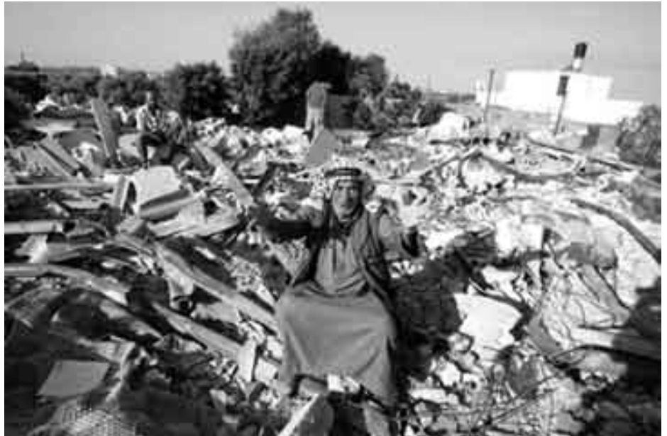
Hus i Gaza i ruiner efter israelsk bombardement

Når en israelsk leder, i særdeleshed en jødisk, truer andre med holocaust, er