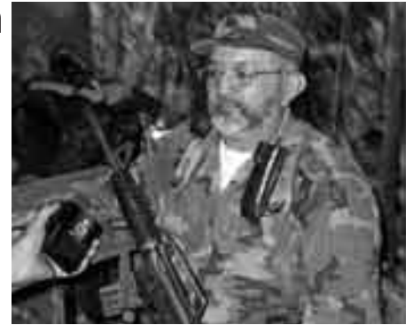
FARC-leder Raul Reyes blev dræbt ved fascistens Urbes angreb på ecuadoriansk territorium - efter USAs signal.

PCMLE opfordrer alle sociale, politiske og demokratiske organisationer, alle venstrefløjsorganisationer, patrioter og nationalister til at forstærke deres kamp og ære mindet om de faldne patrioter. Vi opfordrer til mobilisering og afstandtagen fra knægtelsen af vort