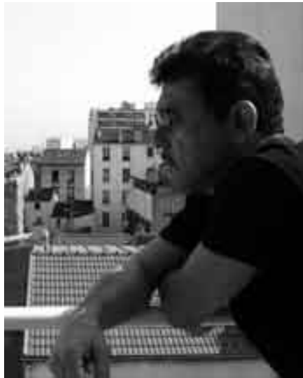
Den israelske historiker Shlomo Zand

En kontroversiel ny bog af den israelske historiker Shlomo Zand afviser at det 'jødiske folk' har eksisteret i landflygtighed i århundreder. Hans bog anmeldes af journalisten og historikeren Tom Segev