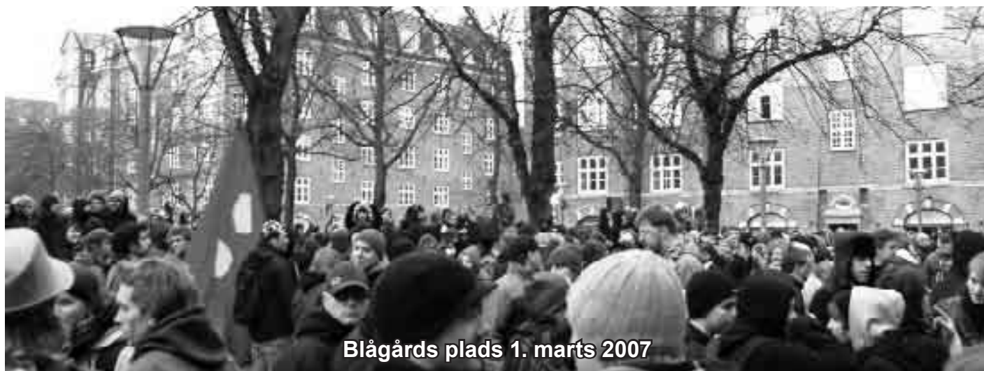
Blågård's plads 1. marts 2007

Jeg er i øvrigt af den opfattelse, at min høje alder gennem hele forløbet er en fordel, også i forhold til behandlingen. Da jeg har båret pakkenellikerne til stue 270 (personligt foretrak jeg 69), når jeg lige at besøge ”købmanden”, som har åben mellem 15 og 16 på hverdage. Jeg tænker på de tre, som skulle visiteres efter mig. De når næppe noget indkøb inden weekenden.