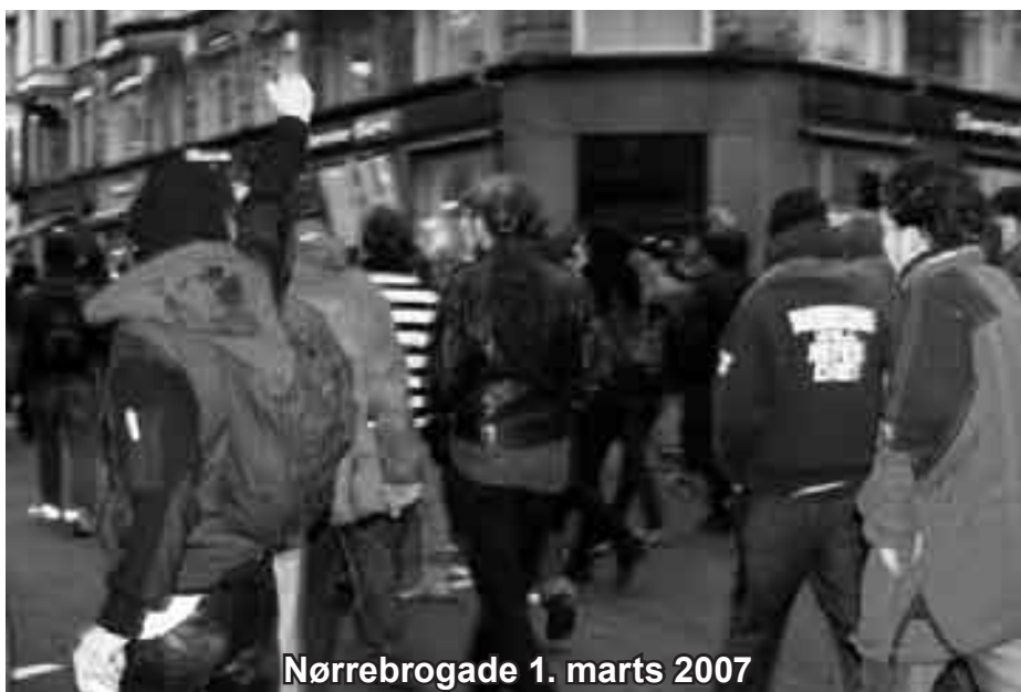
Nørrebrogade 1. marts 2007