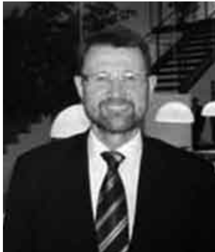
Videnskabsminister Helge Sander

Reformen har skabt et nyt administrationslag af mennesker, der tidligere arbejdede som forskere og undervisere, men nu beskæftiger sig med at kontrollere kollegerne og gå til møde. Omkostningen til det fremvoksende administrative lag har suget en betydelig del af de penge, som tidligere gik til universiteternes egentlige funktioner. Det er en af grundene til, at der selv fra det traditionelt set borgerlige universitetsmiljø er stadig flere forskere, som tager bladet fra munden.