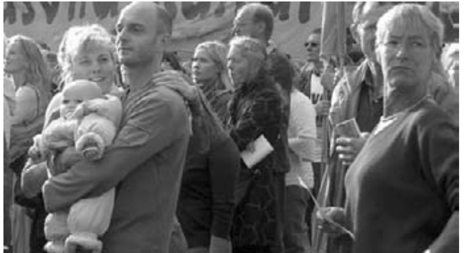
Fra budgetdemonstrationerne i Århus i efteråret 2006

telser er ikke blevet modtaget med lyster begejstring.