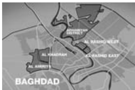
De amerikanske ghettomure i Bagdad

Den skal spærre den irakiske modstand inde - men er allerede nu en fiasko