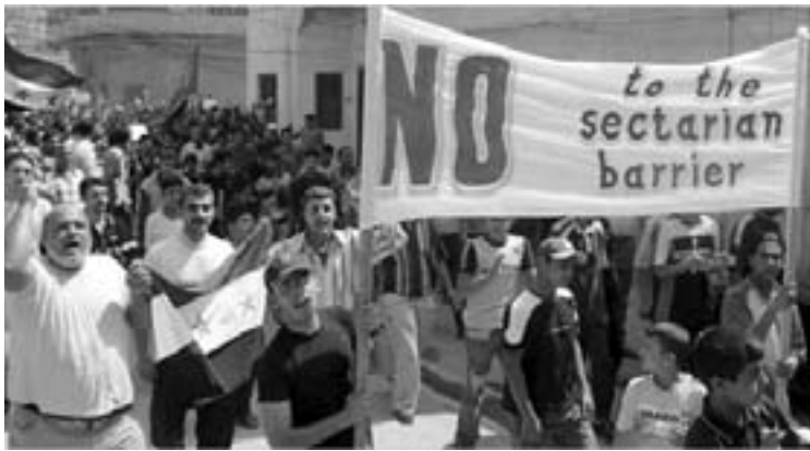
Baghdads indbyggere protesterer mod de sekteriske ghetto-mure

telse er bankerot – moralsk, politisk, økonomisk og militært. Malakis marionetregering er afsløret som den desperate, kræmmeragtige, sekteriske, inkompetente, korrupte og bagstræberiske klike, den er.