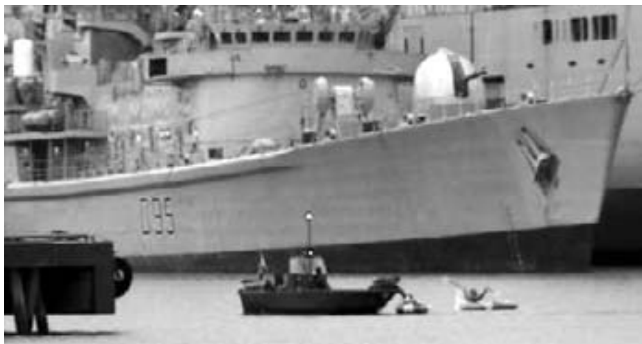
Aktivister i gummibåde mod NATOs krigsflåde. Protesterne i Göteborgs havn havde bred støtte i den svenske befolkning, som hæger om landets neutralitet

NATO-flåden var forsamlet i Gøteborg for at deltage i øvelsen, der er blevet kaldt Noble Mariner , Noble Award og Kindred Sword .