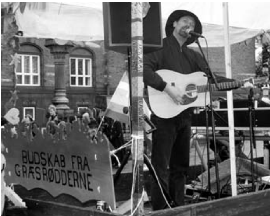
Rådhuspladsen 17. maj 2007:

Måske har vi helt mistet evnen til at række hånden ud og hjælpe vores medmennesker? Jeg kender da til et par børn ude i Sandholmlejr samt 600 irakiske asylansøgere, som godt kunne tænke sig