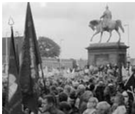
Christiansborg - masseprotesternes hovedscene

Når jeg i det følgende omtaler revisionisterne, mener jeg hermed tre erklærede kommunistiske partier, nemlig 1)