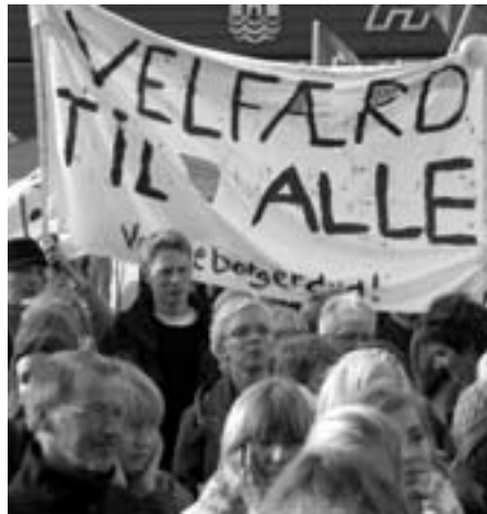
Fagtoppen har kaldt massemobilisering og stordemonstrationer for forældede - men folk går på gaden for at sikre velfærd til alle

Det bliver først og fremmest en imødekommelse af arbejdsgivernes krav om yderligere fleksibilitet i arbejdstiden og dens tilrettelæggelse.