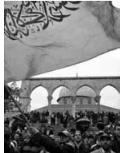
Hamas fejrer valgsejren ved Al Aqsa moskeen

Valget på Vestbredden og Gaza var, som ethvert valg under besættelse, langt hen ad vejen en farce og delvis en legitimering af okkupationen. Dusingvis af kandidater vansmægter i israelske fængsler. Halvdelen af det palæstinensiske folk er i landflygtighed og havde ikke adgang til at stemme. En hovedhensigt var at give folkelig støtte til de regerende palæstinensiske myndigheder.