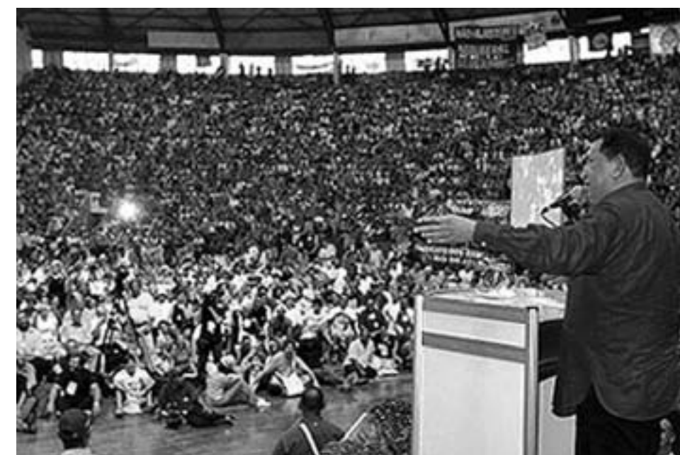
Chavez taler ved WSFs afslutning "I 2004 anvendte vi 4 mia. $ fra olieindustrien til investeringer i velfærd, uddannelse, sundhed, billige lån, legater og boligomsorg tog sigte på de allerfattigste - det som de neoliberale kalder spild af penge"