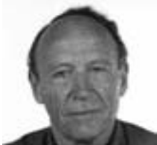
Ole Krarup - tilbage igen

Statsminister Anders Fogh Rasmussen udtaler i dagbladet Politiken, at han gerne vil have gennemført dele af EU-grundloven som f.eks. en fast formand – også kaldet præsident, et styrket EU-udenrigsministerium og ændringer i forhold til beslutninger med ”dobbelt flertal”. ”Det skal være målrettede ting, som bare får det daglige samarbejde til at fungere. Det tvivler jeg på ville kræve folkeafstemninger”.