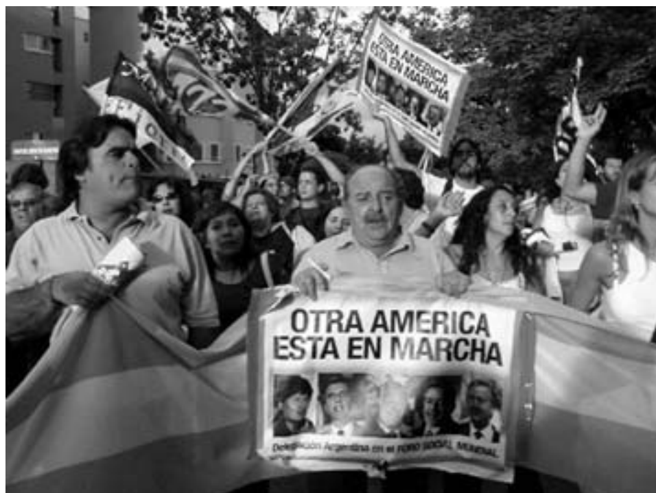
Det andet Amerika er i bevægelse Fra marchen ved WSFs start