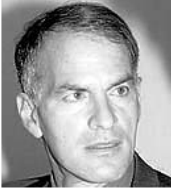
Norman G. Finkelstein

I begyndelsen af januar udtrykte Kristin Halvorsen, norsk finansminister og leder af Socialistisk Venstreparti (der indgår i den siddende treparti-regeringskoalition) sin personlige og partiets støtte til en norsk boykot af israelske varer og tjenesteydelser.