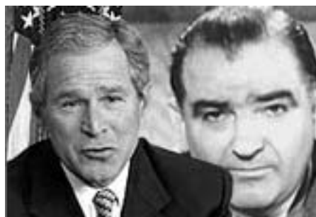
McCarthyismen vender tilbage