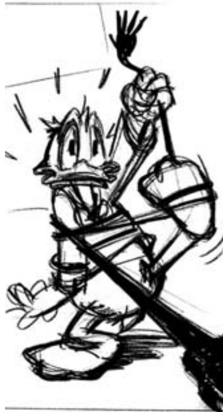
Anders And er dansk Kulturkanonen afslørede en verdenssensation

Det nyliberale nationalkonservative projekt er i sig selv både en anakronisme, en provokation og en absurditet.