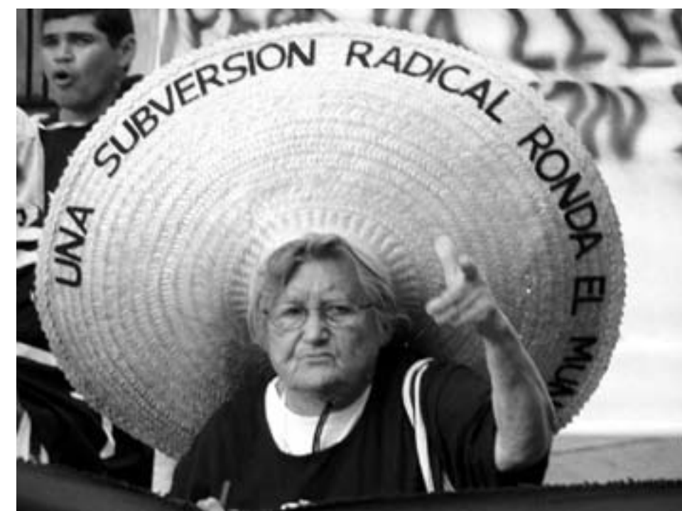
WSFs ansigt: Vilje til forandring

"En ny verden er nødvendig, men først mulig, hvis vi amerikanerne overvinder den arrogante forestilling om, at vi kan løse Iraks problemer og sikre menneskerettighederne. Vi må række hånden frem mod vores menneskelige artsfæller verden over for at smede de bånd, som er afgørende for at beskytte uskyldige medlemmer af menneskeslægten, som forarmes eller dræbes af vores regering og monopoler, som er gået amok og er uden for kontrol".