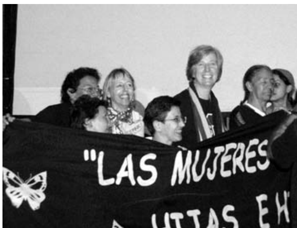
"Kvinderne siger nej til krig" - Cindy Sheehan sammen med latinamerikanske fredsaktivister

Omkring 100.000 aktivister fra hele verden deltog i det 6. World Social Forum i Caracas, Venezuela. Den indledtes med en gigantisk march mod krig og imperialismen – og afsluttedes med præsident Hugo Chavez' opfordring til at overvinde kapitalismen.