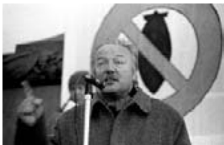
George Galloway. Britisk Labour-parlamentsmedlem

området - den israelske stat. Og en del af dette er faktisk korrektion af grænser.