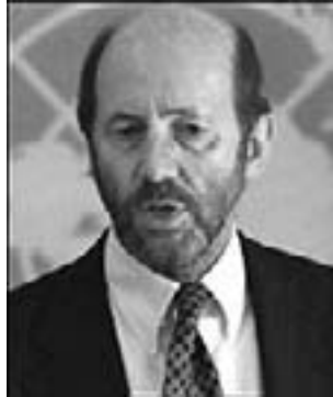
Dennis Halliday. Tidligere vicegeneralsekretær for FN og chef for FN's mad for olie-program i Irak.

- Vi går i krig, og der er ikke en skid, inspektørerne kan gøre for at stoppe det, og det er en skam. Inspektionerne har fungeret engang, og de kunne