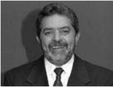
Brasiliens præsident Luiz Inácio Lula da Silva