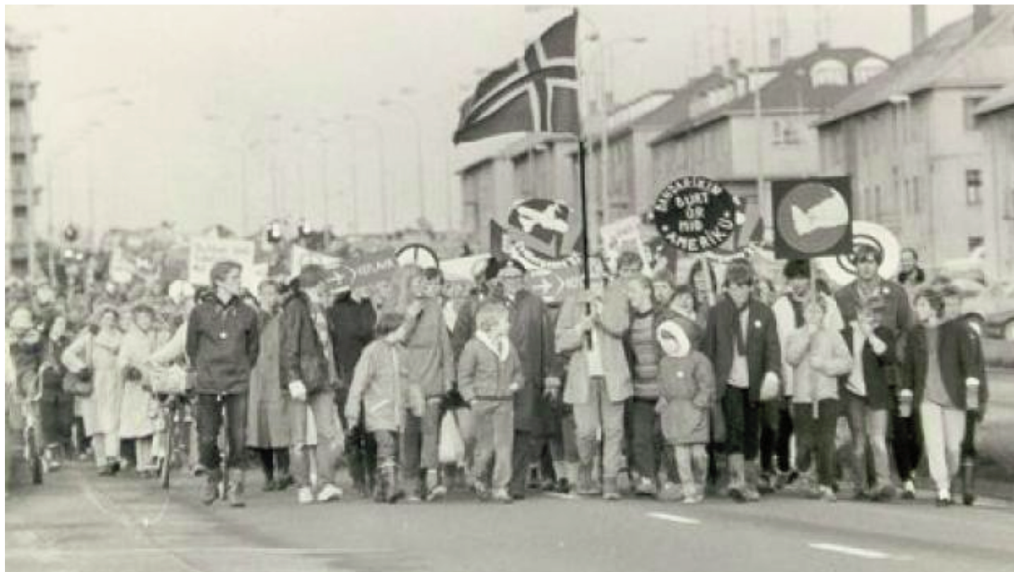
Fredsbevægelsen (SHA) arrangerede fredsmarcher der gik fra den amerikanske base ved Keflavik til Reykjavik. Mere end 50 km. Billedet er fra fredsmarchen i 1983.

rocker, komiker, skuespiller, er-klæret anarko-surrealist - og pacifist. Da han var borgmester lod han det stå klart at NATOs krigsskibe ikke var velkomne i Reykjaviks havn — han var faktisk ikke bemyndiget til at forbyde dem, men han kunne godt sige at de ikke blev anset som gode gæster hos os. Det var måske bare symbolsk — men han var populær, og meningsmålinger viser at han ville have en god chance for at blive præsident hvis han stillede op i 2016.