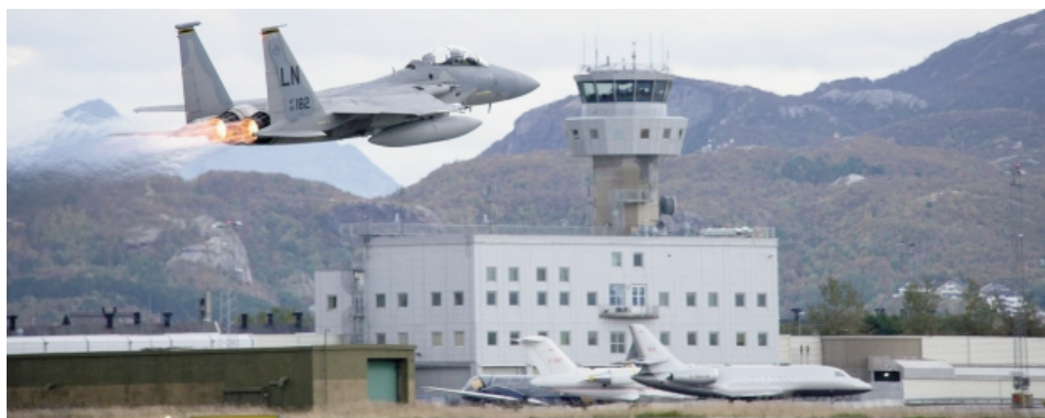
Fra en af største militære øvelser i Europa - Arctic Challenge Exercise 2015 - med deltagelse af mere end 100 fly og 4000 personel

I november vil det Norsk-ukrainske Handelskammer afholde et møde i Oslo for at agitere for øget norsk indblanding i Ukraine. Blandt andet den norske udenrigsminister Børge Brende vil deltage. Vi vil stå der med parolen "NATO ud af Ukraine!".