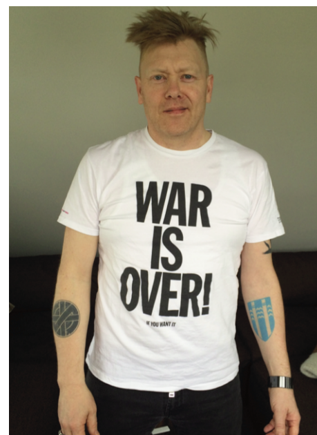
Jón Gnarr, Reykjaviks borgmester 2010-14. Han er forhenværende punk-rocker, komiker, skuespiller, erklæret anarko-surrealist og pacifist.

Heldigvis findes der også andre slags politikere. Jón Gnarr stillede op og blev valgt som Reykjaviks borgmester i 2010. Han er forhenværende punk-