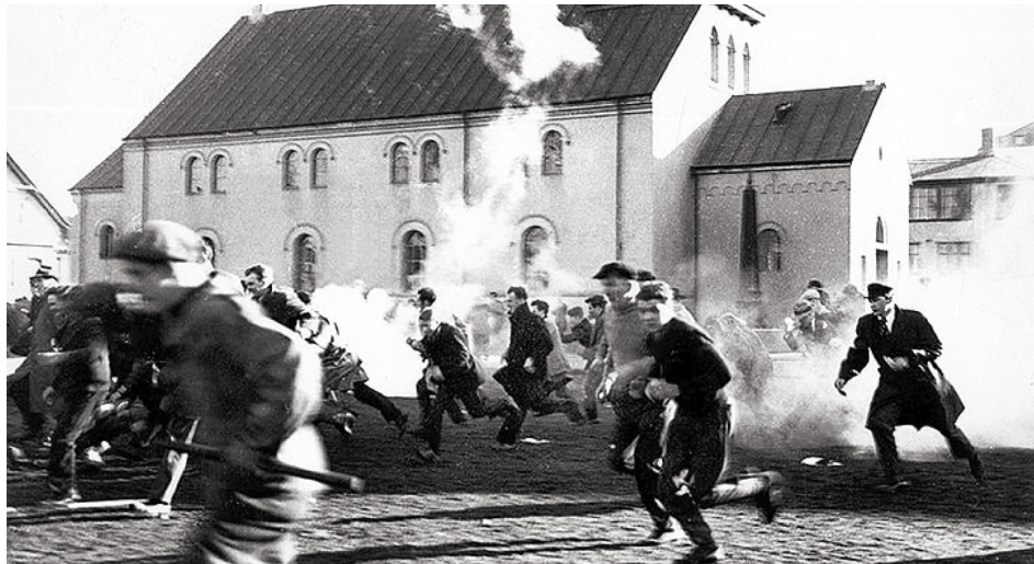
Protestdemonstration mod Islands medlemskab af NATO mødes med tåregas og politiknipleri

● Efter at være blevet besat af briterne og amerikanerne under d. 2. verdenskrig, blev Island stiftende medlem af NATO i 1949 og to år efter underskrev den islandske regering en „beskyttelsesaftale“ med USA. Denne aftale er grundlaget for den amerikanske militære tilstedeværelse, som den islandske fredsbevægelses kamp havde som sit omdrejningspunkt de næste 55 år — til år 2006.