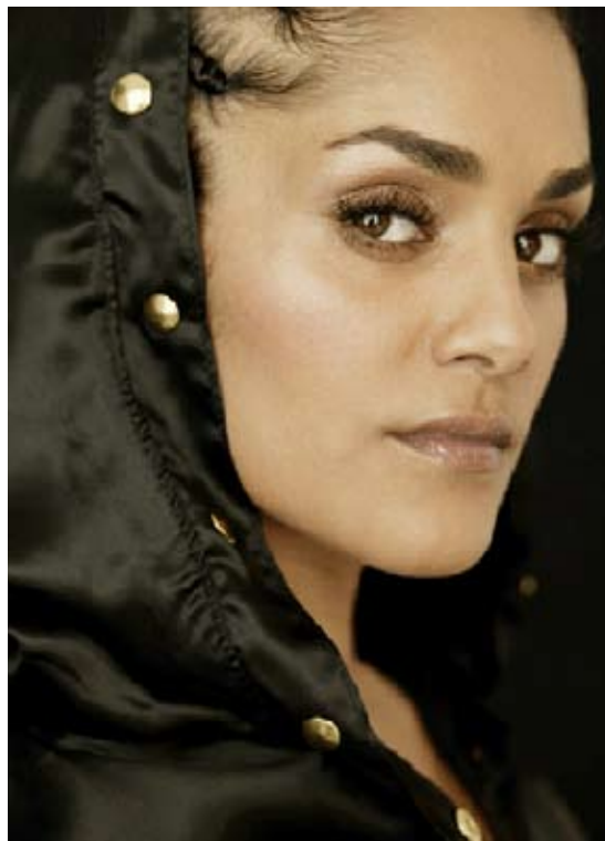
Natasja Saad. 1974 – 2007

Desværre blev de første års muligheder korrumperet af en dårlig pladekontrakt, som det skandinaviske selskab Mega Records skrev med de forudsætningsløse teenagere i No Name Requested. Efter to singler i begyndelsen af 90'erne fik Mega Records pludselig travlt med et andet af deres bands (svenske Ace Of Base), og syltede raggamuffin pigerne, der var juridisk bundet til Mega og derfor ikke kunne komme videre, før Mega omsider gik konkurs.