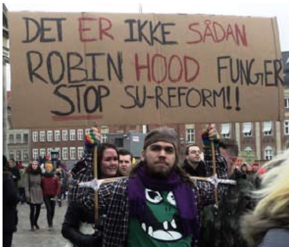
Vil Enhedslisten reelt sige fra overfor SRSFs reaktionære reformer? Foto fra den store protest mod SU-reformen den 28. februar.

Liste Ø's folketingsgruppe fortsætter i et spor, der fra starten endte blindt: som støtteparti for en reaktionær nylibe-