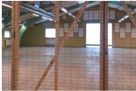
Lukket og slukket

Boston Consulting Group (BCG) mener, at der er to væsentlige grunde til, at Danmark får svært ved at stoppe outsourcingen af industrijob til lavtlønslande: