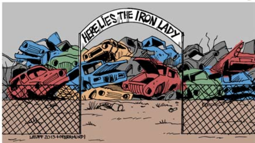
Her hviler Jernladyen