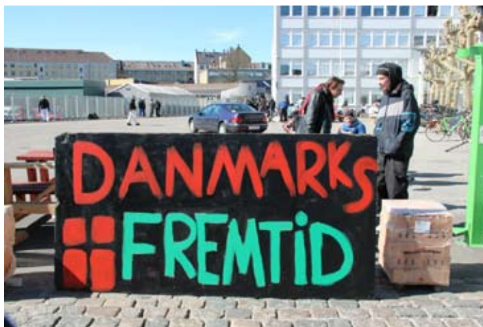
Eleverne blokerer ved Københavns Tekniske Skole Refshalevej.

kontor og servicefag – ikke mindst de offentlige – kan de unge ikke blive uddannet, fordi der ikke oprettes praktikpladser.