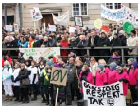
Christiansborg Slotsplads 11. april 2013.

Og så venter stordemonstrationen på torsdag. Der bliver næppe tid til at fort-