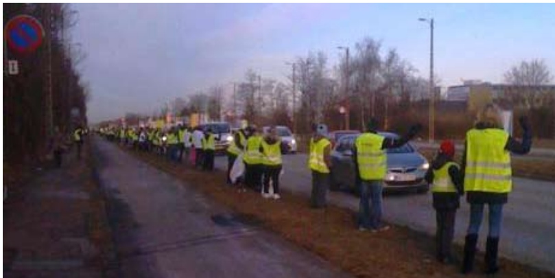
11. april: Lærere danner en 31 km lang menneskekæde fra Roskilde til København

Flere af tjenestemandskollegerne deltog. En af dem havde taget en stor bønne chokolade med til os.