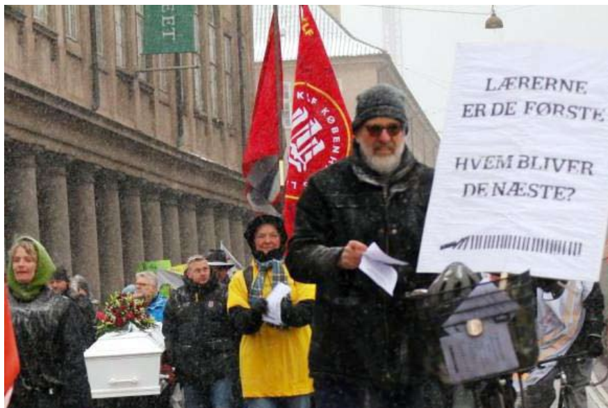
Sig Nej ved urafstemningerne! OK-aftalerne for godt en halv million offentligt ansatte er nu til urafstemning. De sikrer ikke reallønnen! Stem Nej! Fotoet er fra lærerprotest i København den 20. marts 2013

Lærerfagforeningerne har været tvunget ud i kamp. Og hvilken kamp er det ikke blevet! Medlemmerne er blevet mobiliseret under lockouten i en grad,