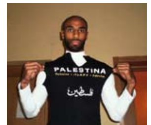
Frédéric Oumar Kanouté er en af underskriverne. Han var Årets afrikanske spiller i 2007. Se alle underskriverne på boykotisrael.dk

Trods den seneste våbenhvile er palæstinenserne stadig tvunget til at udholde en desperat eksistens under besættelse og burde være beskyttet af det internationale samfund. Alle mennesker har ret til et liv i værdighed, frihed og sikkerhed. Vi håber, en retfærdig løsning vil blive det endelige resultat.”