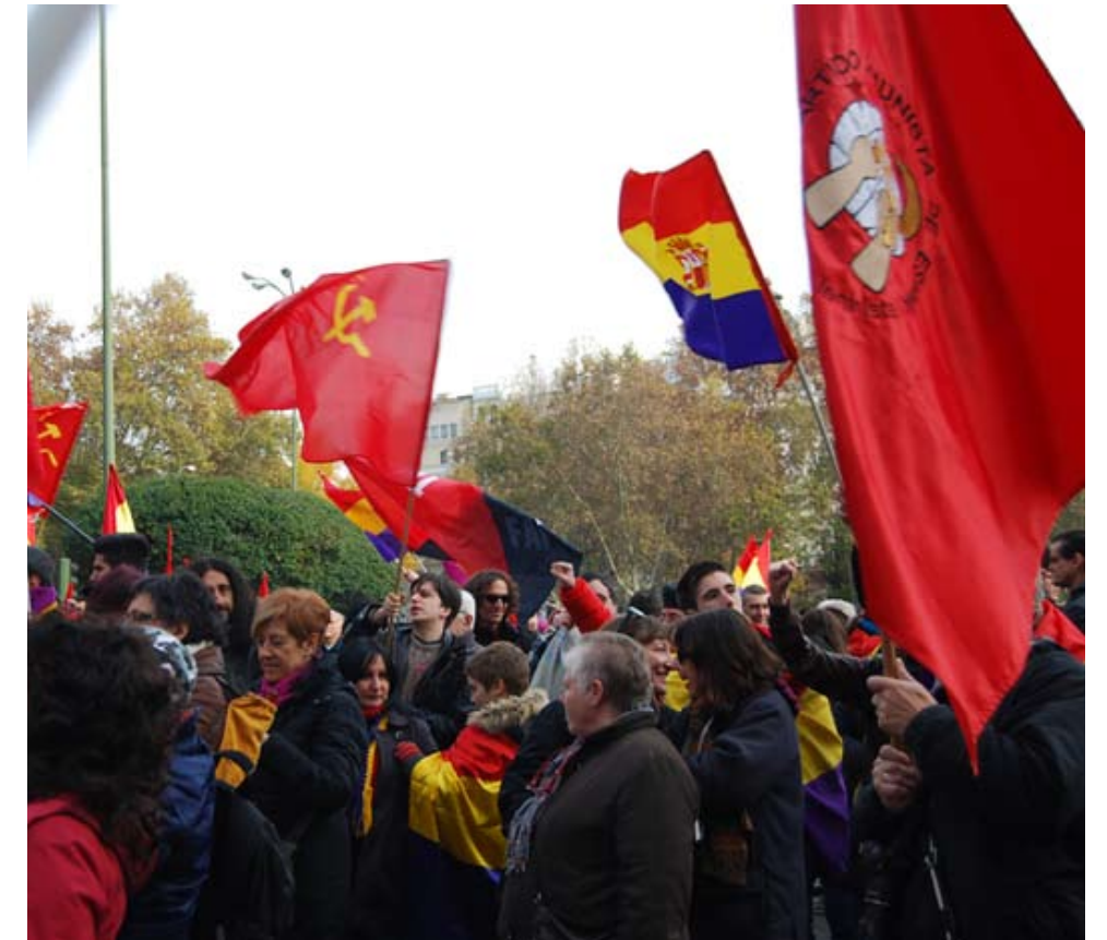
De spanske marxist-leninister i PCE(m-l) er og har gennem historien været helt fremme i kampen mod fascismen og for republikken.