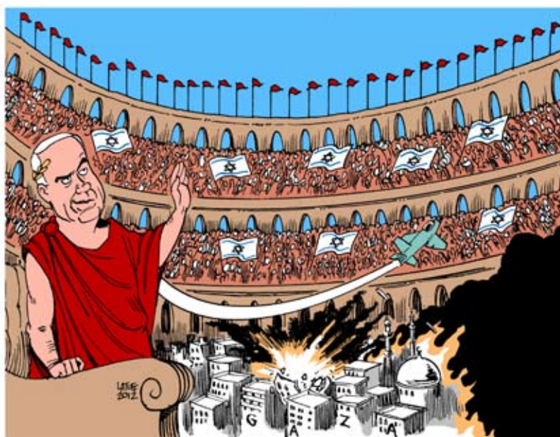
Israels kejser Netanyahu og det blodige colosseum i Gaza