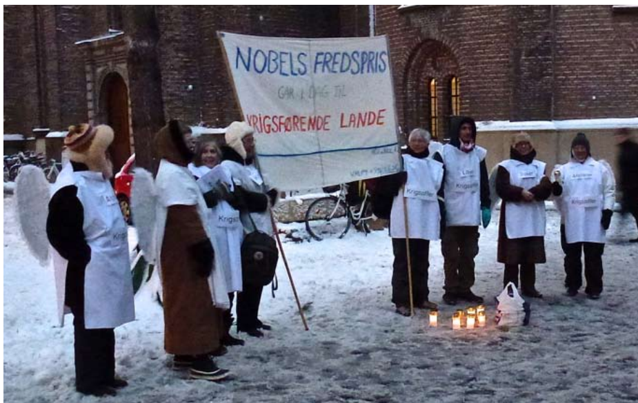
EU er ikke et fredens projekt Protest på Købmagergade i København mod Nobels fredspris til EU

At Nobels fredspris for 2012 blev tildelt det imperialistiske EU, vakte harme og vrede overalt i EU. Fra vantrøst og forundring – det er en joke! – til synlige protester på gaderne.