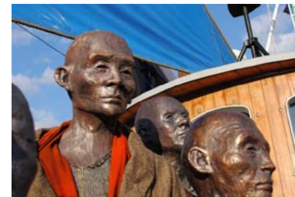
Kunstner: Jens Galschiøtt