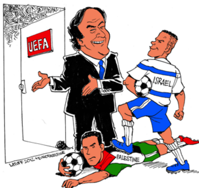
Michel Platini hilser Israel velkommen til UEFA