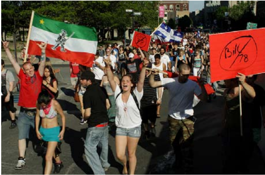
Montreal 21. maj 2012: 'Ulovlig' demonstration mod Bill 78

skabt en 'mindste fællesnævner' på tværs af ellers vidt forskellige krav. Den har medvirket til at skabe et praktisk, militant interessefællesskab over for det systematiske nyliberale angreb.