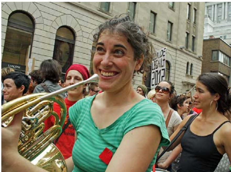
Studenterprotesterne gearer nu om for at fortsætte sommeren igennem til starten på nyt semester

I et desperat forsøg på at genvinde initiativet ved at fremstille konflikten som kriminel snarere end som en politisk sag hastede den panikslagne provinsregering sin drakoniske Bill 78