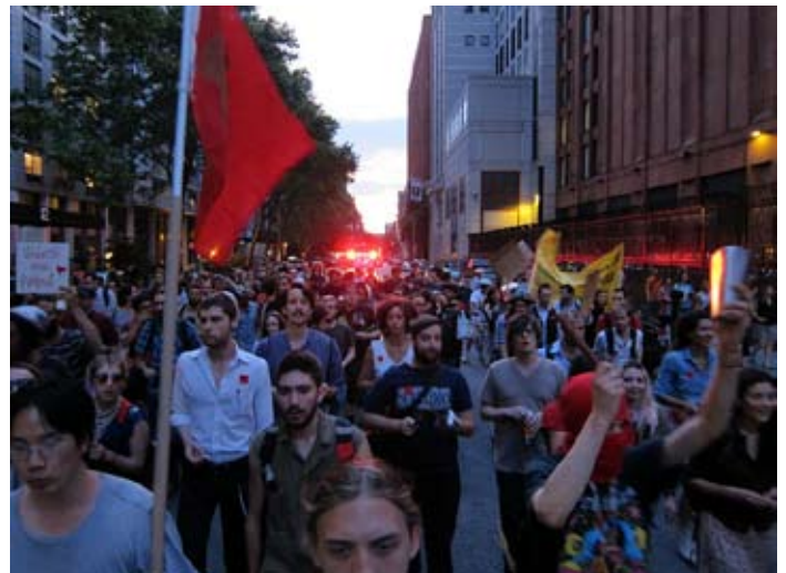
Occupy Wall Street 30. maj 2012: Kasserolleaften i solidaritet med de studerende i Quebec

I Quebec har de studerendes modstand mod disse indgreb ikke bare