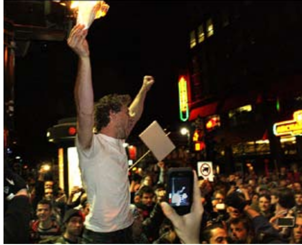
Natteprotest: Studenterprotesterne har udviklet sig til en folkelig bevægelse Her afbrændes anti-demonstrationsloven Bill 78

Den første grund til de studerendes succes ligger i både i det klare umiddelbare mål og dets forbindelse til en bred vifte af tæt forbundne mål. Studerende af alle politiske afskygninger støtter det nuværende 'minimumsprogram' for at bremse den liberale regerings planer om at forøge studieafgifterne med 82 % over en årrække. De fleste studerende og deres familier er