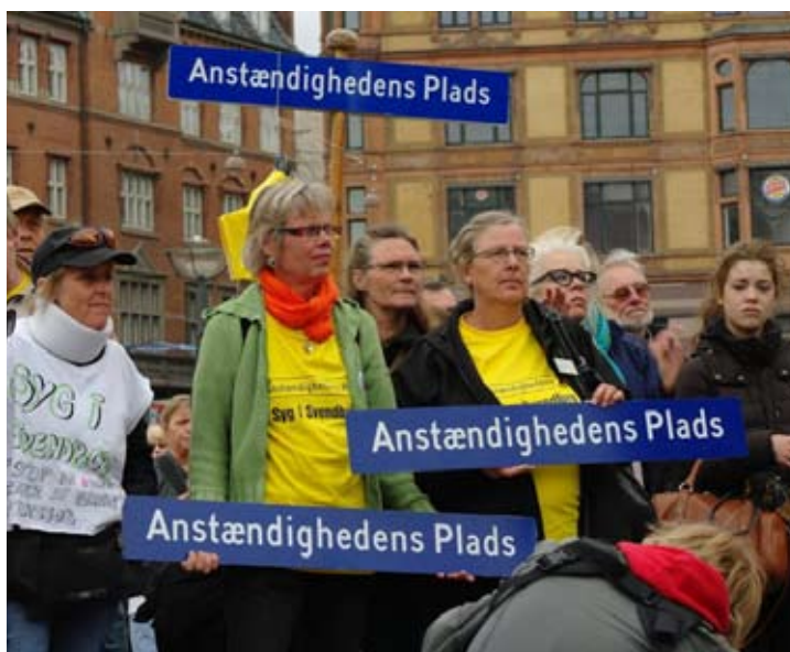
Folkeforsamling Rådhuspladsen København 4. juni 2012

Ikke uventet holdt retorikken sig indenfor regeringens gode intentioner uden at berøre de mange forringelser. Hendes omsorg for den 'næste generation' og deres uddannelsesrettigheder havde i ordene en klang af Nyrups 'uld