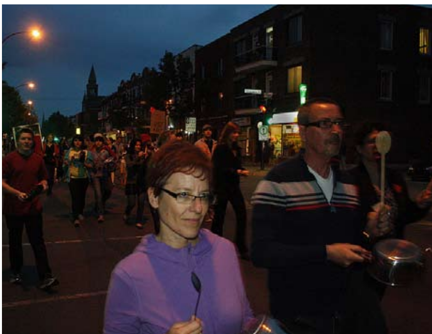
Kasseroller i Villeray: Sådan ser demokrati ud

På alle relevante niveauer har de dannet fællesmøder, der har givet sig selv magt til at drøfte tingene igennem og derpå træffe vigtige beslutninger hurtigt og kollektivt. Aktioner besluttet ved offentlig håndsoprækning snarere end gennem en opsplittende udveksling af private synspunkter. Jo mere magtfulde og effektive disse fællesmøder er blevet, jo mere entusiastisk og aktiv er deltagelsen. Delegerede fra fællesmøderne deltager så i mere omfattende kongresser, og uden en formel ledelse eller bureaukrati er den 'almindelige vilje', der er vokset frem på disse kongresser, så klar, at CLASSE nu er den vigtigste organiserende kraft i kampag-