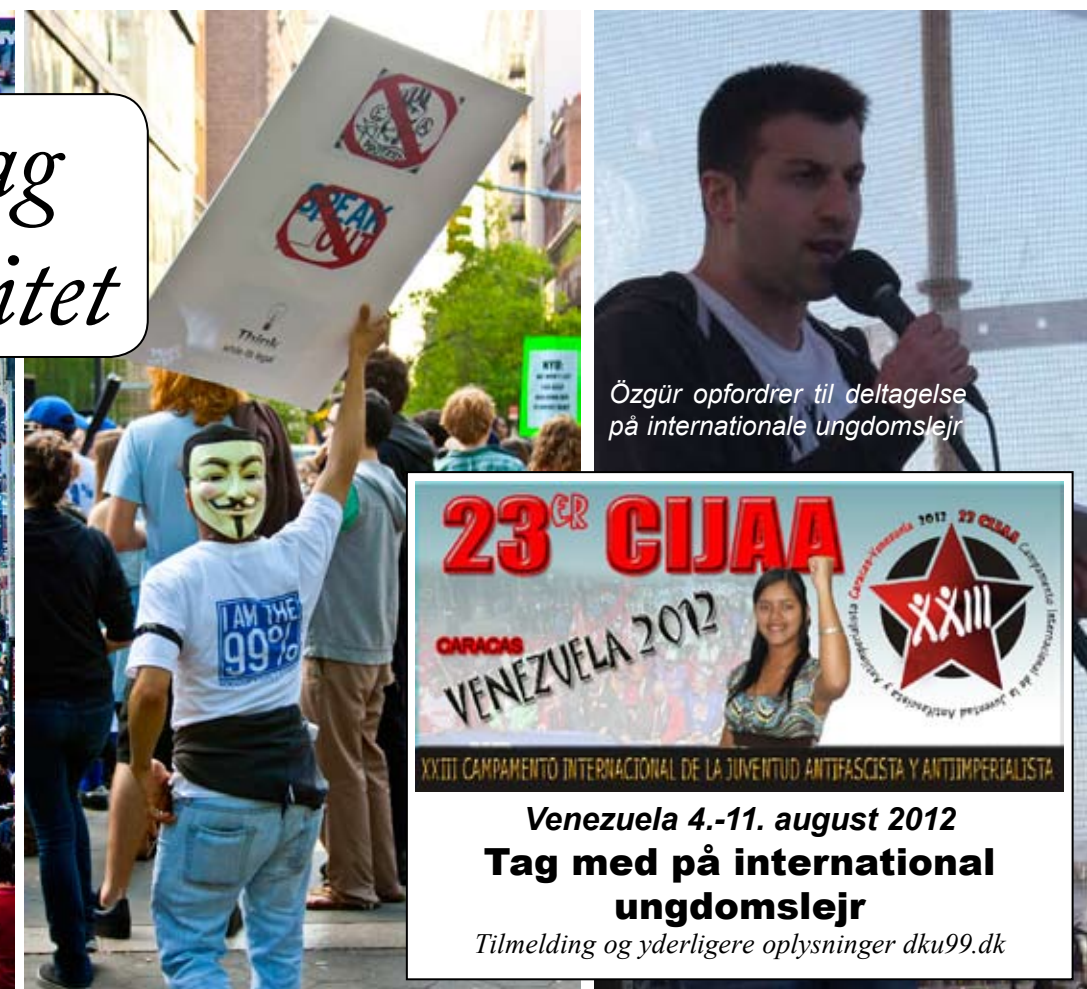
Özgür opfordrer til deltagelse på internationale ungdomslejre