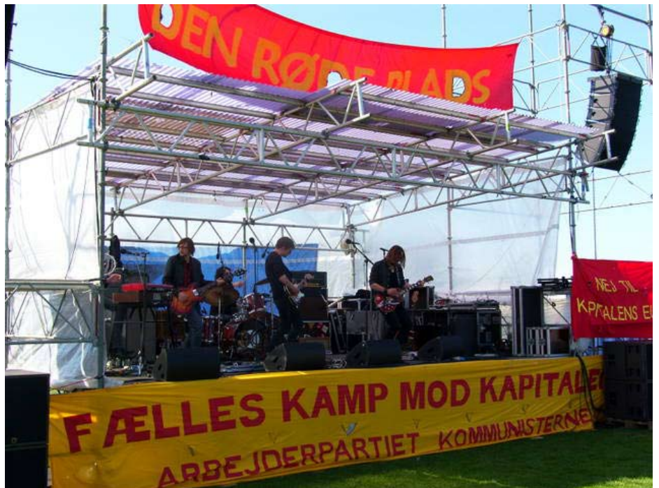
Dirty Old Town på Den røde Plads

På Den røde plads blev der fra starten fokuseret på kampen mod krig og imperialismen med den fremragende amerikanske protestsanger David Rovics som den første på hovedscenen, fulgt op af