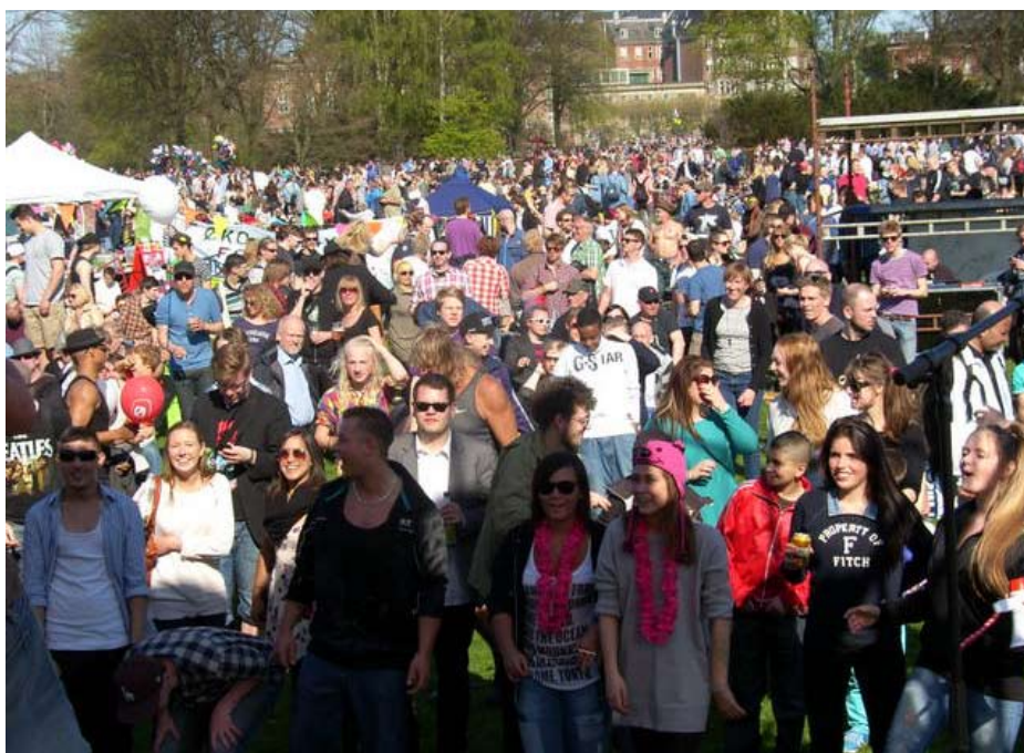
Den røde Plads (bag frimurerlogen)