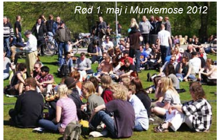
Rød 1. maj i Munkemose 2012

Gode lokale bands og solister sørgede for den musikalske underholdning, så "Mosen" gyngede af god stemning, og samtidig var der livlig trafik i Oktober Bogcafé's store telt, hvor man både kunne få en politisk snak og noget til ganen, samt selvfølge-