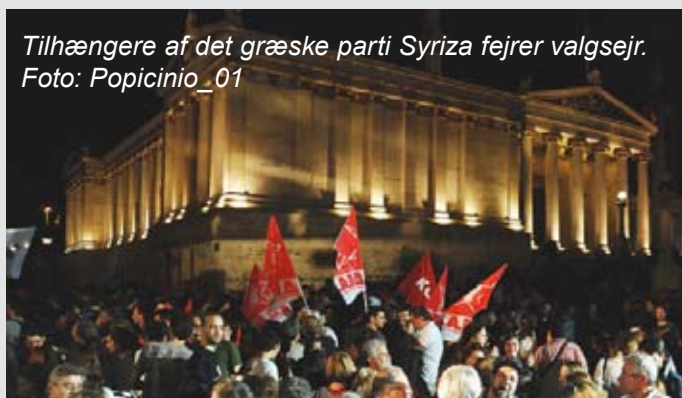
Tilhængere af det græske parti Syriza fejrer valgsejr.

- Hermed har vælgerne i Frankrig og Grækenland fået mulighed for at tage stilling. Den irske regering har også givet de irske vælgere den mulig-