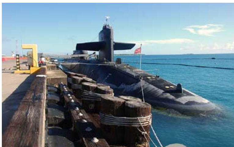
Den missilbærende ubåd USS Florida ved Diego Garcia 2010

Til bunker af skide støv går alle de liv, der blæses til det af Barack Obama, den vestlige volds glade håb om forandring. Når en af Obamas droner udrydder en hel familie i en fjern stammeregion i Pakistan, Somalia eller Yemen, taster de amerikanske kontrolanter foran deres computerspilsskærme ”Insektsplat”. Obama er glad for droner og spøger med det over for journalister. En af hans første handlinger som