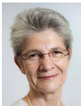
Bernadette Segol, fmd EFS (ETUC)

- Pagtens eneste formål er at reducere de offentlige underskud så meget som muligt, uanset de sociale konsekvenser. Europa kan ikke fortsætte med at vedtage indgreb, som ikke virker, men som kaster landene ud i dybere kriser og betyder fattigdom for flere og flere mennesker, siger Bernadette