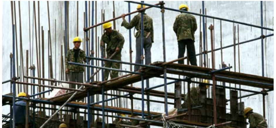
Fra næste år vil 2400 hver måned miste dagpengene og dagpengeretten

Ændringerne af dagpengereglerne betyder, at dagpengeperioden bliver halveret fra fire til to år, og at genoptjeningskravet bliver fordoblet fra et halvt