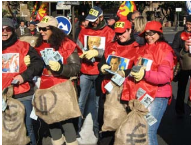
Stadig voksende protester overalt i EU: Her offentligt ansatte i storstrejke i Italien den 27. januar 2012

flere måder er Unionen svagere end nogensinde før, og det er en oplagt situation til at styrke modstanden mod EU.