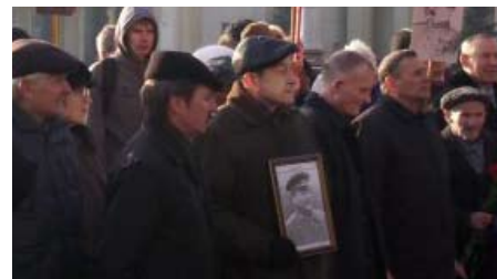
Markering af Oktober Revolutionen

sådanne overførsler som eksistensgrundlag, f.eks. afsidesliggende områder og landsbyer i Rusland, eller områder med konstant national spænding og uro som Tjetjenien eller Dagestan.