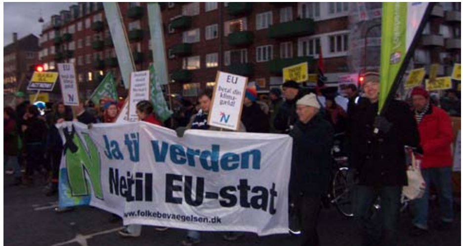
Folkebevægelsen mod EU på gaden under klima-topmødet

Det skal ske sammen med en række andre mekanismer for overnational kontrol, f.eks. med medlemslandenes