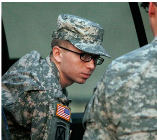
Bradley Manning føres til militær domstolen i Fort Meade, Maryland. December 2011

Nej, ridderen på den hvide hest, der skulle frelse Amerika, den smukke, sorte Obama, viser nu sit sorte indre. Onsdag den 14. december trak han sit veto mod The National Defense Authorization Act. Loven vil give ret til tilbageholdelse på ubestemt tid af terroristmistænkte amerikanere. Derfor kunne senatet skride til afstemning torsdag den 15. december – dagen, hvor Bill of Rights' 220 års-dag fejredes, en række grundlæggende borgerrettigheder tilfø-