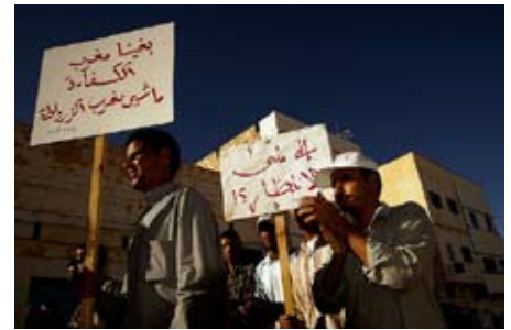
Arbejdsløshedsdemonstration Sidi Ifni, Marokko Ungdomsarbejdsløsheden er 31 pct

APKs søsterorganisation i Marokko, 'Demokratisk Vej', understreger i en udtalelse om valget, at de institutioner, der udspringer af dette valg, ikke har nogen legitimitet og ikke repræsenterer folkets vilje. Organisationen vil arbejde for at vælte denne regering og dette parlament, annullere den royale forfatning og få etableret en grundlovgivende forsamling og eliminere den royale overhøjhed. DV fordømmer imperialistmagternes, især USA og Frankrig,