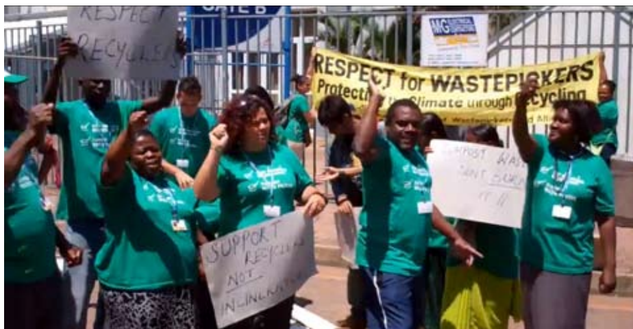
Affaldssamlere gør opmærksom på vigtigheden af genbrug

Bondeorganisationens budskab er, at kun ved at udvikle et bæredygtigt landbrug med udgangspunkt i de lokale omstændigheder kan det sikres, at klimaændringer ikke betyder sultkatastrofer. Til gengæld er et bæredygtigt landbrug også en af løsningerne til at forhindre den globale opvarmning, ved at udnytte ressourcerne meget bedre.