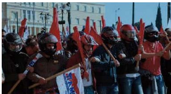
Medlemmer af PAME i rollen som uropoliti med køller og hjelme foran det græske parlament

Under de store demonstrationer op til Papandreous afgang – efter at Papan-dreou havde lovet en folkeafstemning –