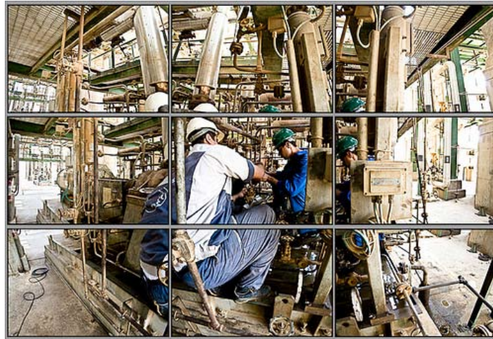
Oliearbejdere i Mashahr

Irans arbejdere – med permanente og formelle ansættelseskontrakter eller