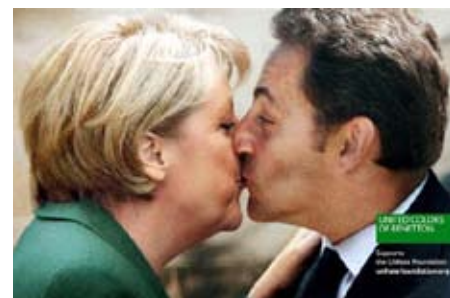
Merkel og Sarkocy viser hvordan man bør regere, ifølge Benetton

Det multinationale tøjfirma Benetton har lanceret en ny reklamekampagne: Kys hinanden!