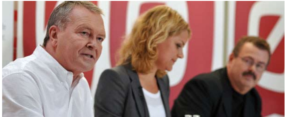
Liste Ø's forhandlere er stolte over resultatet - uden grund

Situationen mindede om de seneste 10, når VK forhandlede finanslov med O, selvom aktørerne var skiftet ud. Støttepartiet skulle have afsat nogle fingeraftryk på mærkesagerne, men alle vidste at der ville komme en finanslov ud af det. Med VKO var man sikker ting: Der ville være masser af