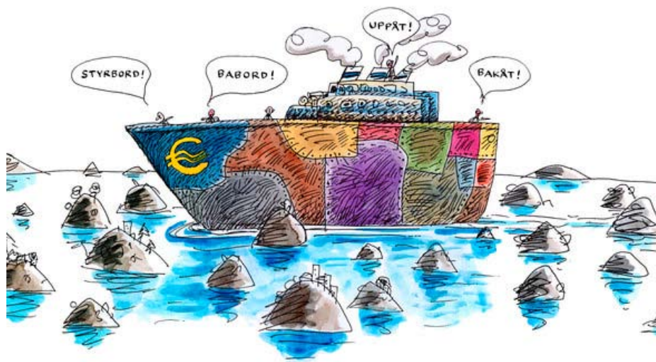
Euro på ret kurs, tegning af Robert Nyberg

Ideen om at samle så forskellige økonomier i en fælles valuta er fejlkonstruktion nr. to. Det skortede ikke på advarsler, både fra økonomer og fra almindelige folk. En række EU-lande har valgt at stå uden for euroen, netop for at bevare mulighederne for at føre en større grad af national og selvstændig politik. Kriserne i de sydeuropæiske lande illustrerer til fulde eurosamarbejdets svagheder og mangler. Island fremstår som et modstykke til det som sker i EU. Gennem en selvstændig national politik, hvor folkelig mobilisering og folkeafstemninger har stået centralt, har Island både de facto devalueret, fået et højere renteniveau, ladet banker gå konkurs og oprettet en ny statslig bank. De indførte valutarestriktioner og fik fart på eksporten. Landet er klart på bedringens vej, selv om man også der