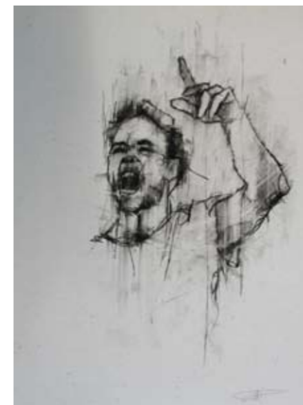
'Occupy Wall Street (new media method)' 4. Oktober 2011

Find tegningerne på www.facebook.com/guydenning