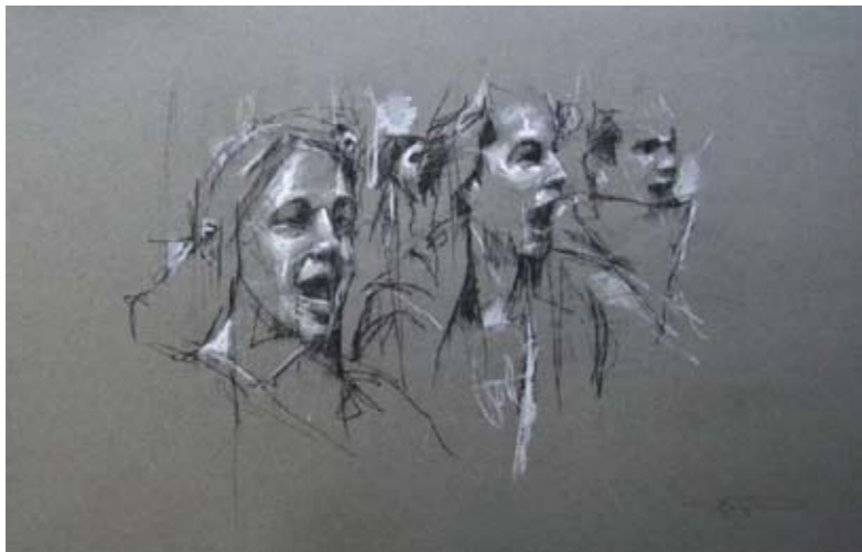
'occupy Milano (allievi che cantano)' 6. November 2011