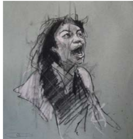
'Occupy Oakland (California dreaming)' 7. November 2011