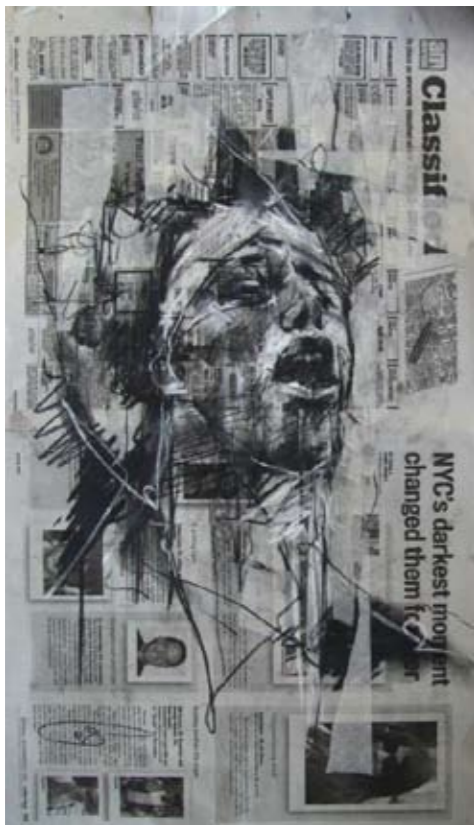
'Occupy Wall Street (the sound of free speech)' 13. Oktober 2011