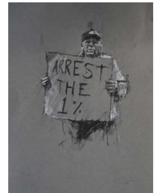
'occupy (the 99%)' 30. Oktober 2011