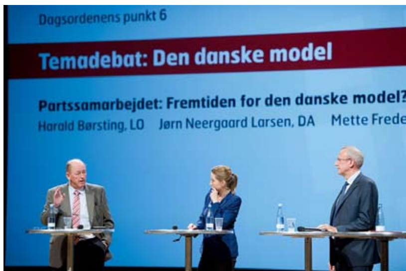
Fred på bagsmækken