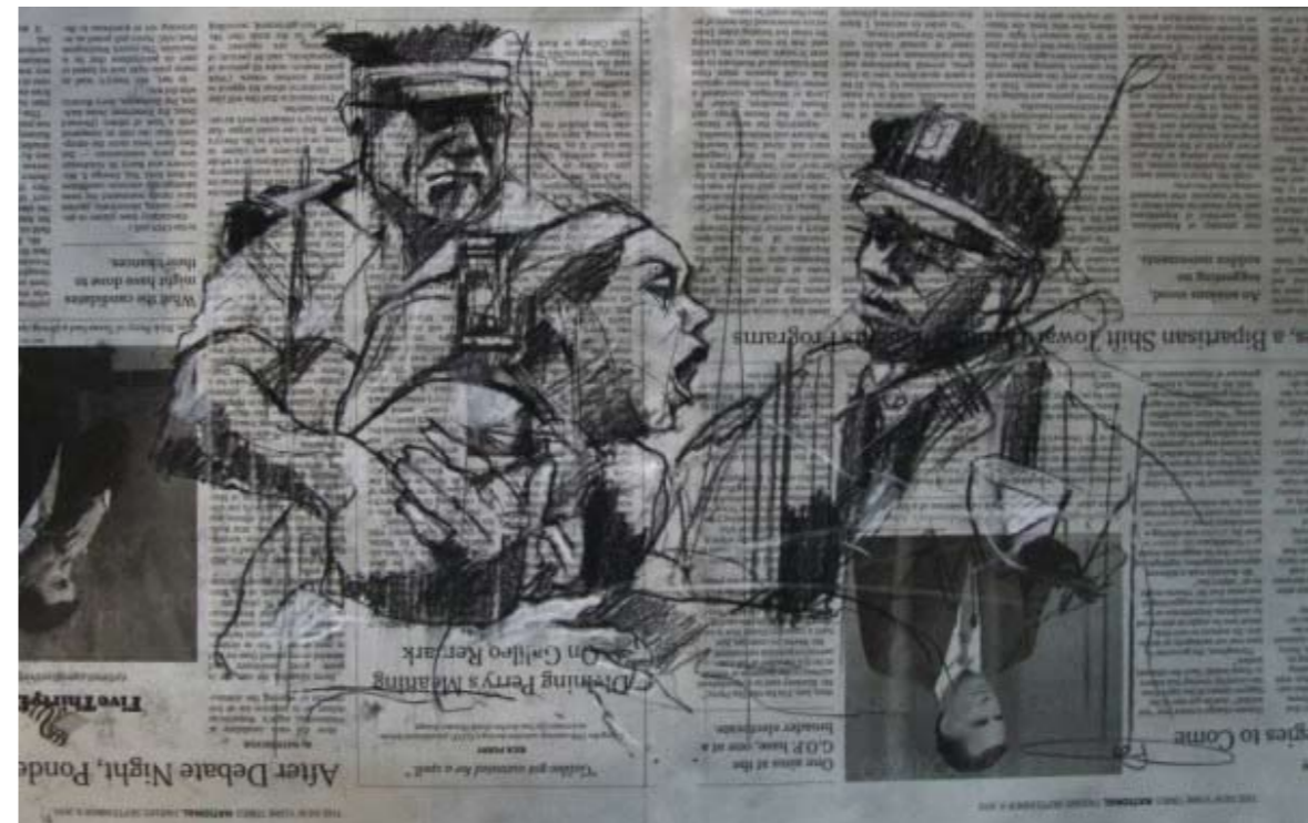
'Occupy Wall Street (Bologna's enthusiasm)' 12. Oktober 2011