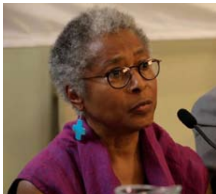
Forfatteren Alice Walker deltog som nævning

Ordene faldt ved afslutningen af tredje samling af Russell tribunalet om Palæstina, der foregik i Cape Town den 5.-7. november. Vavi sagde: "Jeg vil personligt tage dommen og denne sag op med den Sydafrikanske regering og præsidenten" "Vi må gøre som andre regeringer gjorde overfor Sydafrika under apartheidstyret. Regeringen må bryde sine forbindelser med Israel."