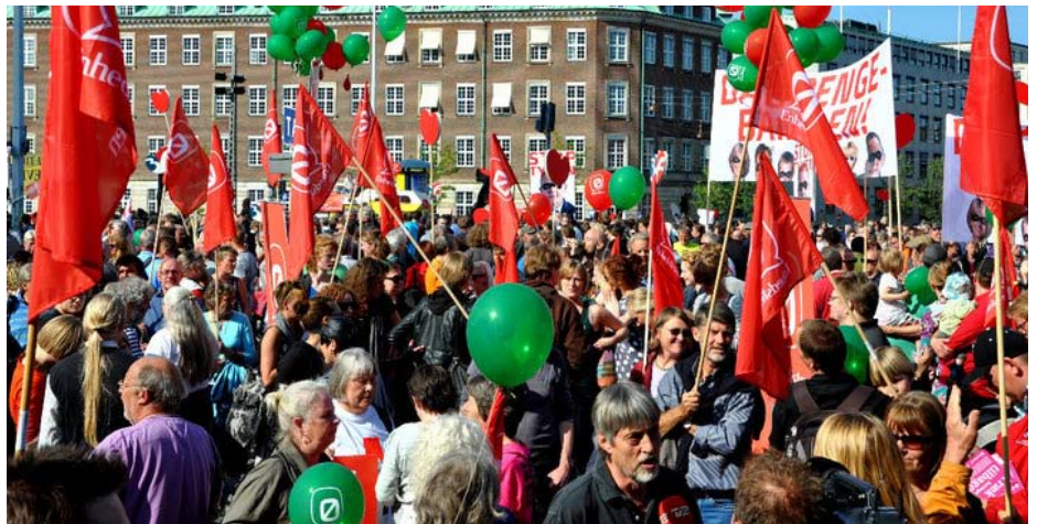
Dengang i 2010 da Enhedslisten stadig demonstrerede imod nedskæringer

Efter regeringsdannelsen er det gået samme vej i meningsmålingerne: Nedad. Utvivlsomt en reaktion på de talrige valgløftebrud, som viste sig med offentliggørelsen af regeringsgrundlaget. S/SF's fælles valggrundlag Fair