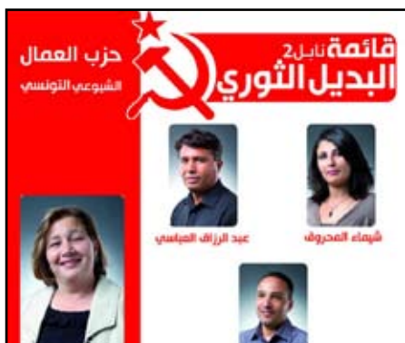
Det revolutionære alternative, Valgplakat fra Arbejdernes Kommunistiske Parti i Tunesien (PCOT)

ning. Partiet førte en ren kampagne, økonomisk, moralsk og politisk. Det fokuserede på programmer og forslag og støttede sig på dets medlemmers og aktivisters vilje. Det var konfronteret af en stor smædekampagne og var udsat for en påfaldende blokade i medierne.