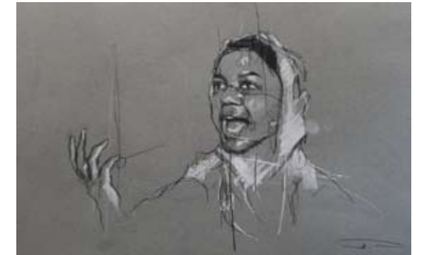
'occupy Oakland (they kept shooting)' 31. Oktober 2011