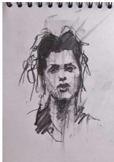
'occupy (Indignados Madrid 1)' 4. November 2011