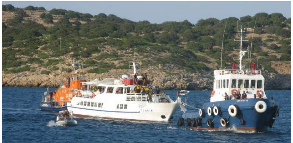
Tahir kapret af græske havnemyndigheder i juni 2011

Free Gaza Danmark fordømmer den folkeretsstridige israelske kaping af nødhjælpsskibe til Gaza og den ulovlige tilbageholdelse af deres besætninger og passagerer – og kræver dansk handling