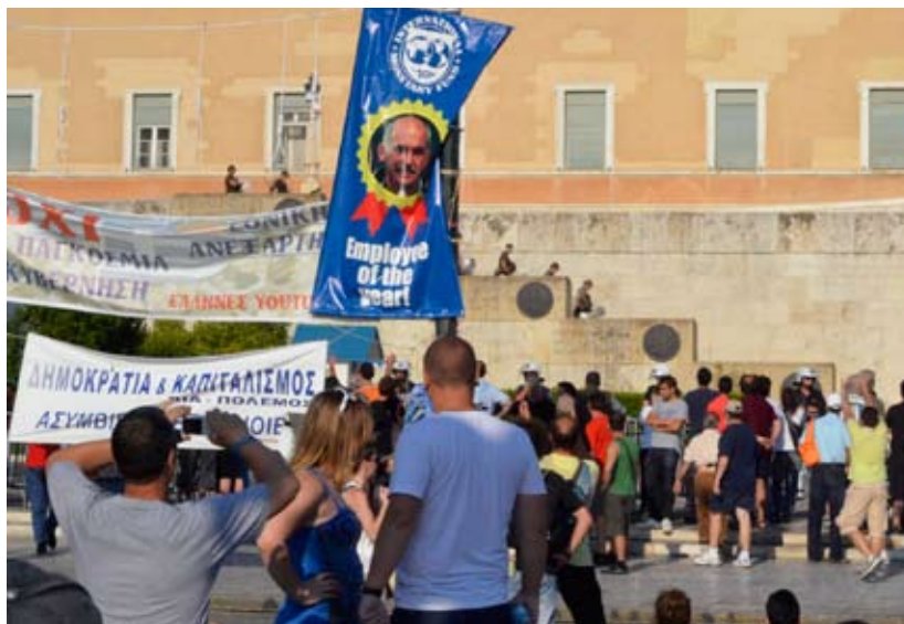
Demonstranter har kåret Papandreou til Årets IMF medarbejder. 30. juni Athen

Paul Craig Roberts er tidligere vicefinansminister i Reagan-administrationen og en skarp kritiker af amerikansk og vestlig imperialisme, senest i forbindelse med G20-topmødet i Cannes. 'Demokratiet' i EU går ikke ram forbi