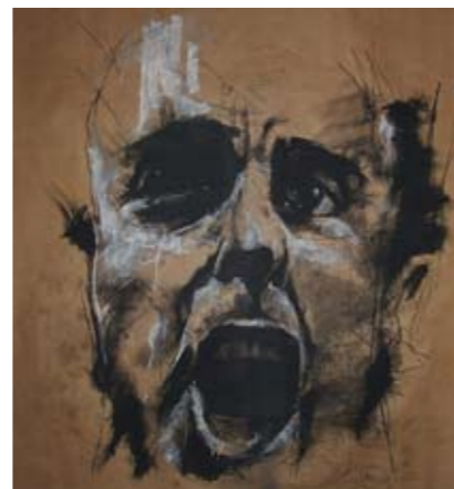
'our leaders lie' Tegning fra 2009

Find tegningerne på www.facebook.com/guydenning