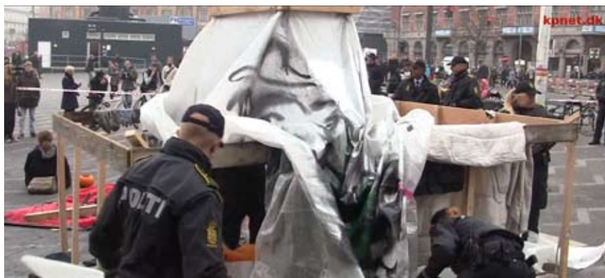
Politiet ryder Rådhuspladsen i København den 27. oktober for Occupy Copenhagen-campen.