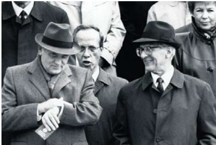
Gorbatsjov og Erich Honecker lukker og slukker

stater kommet i miskredit. Folk mangler slet og ret et troværdigt alternativ til kapitalismen. I 20'erne og 30'erne i det sidste århundrede var socialismen stadig det indlysende alternativ til kapitalismen i vores land. Efter befrielsen fra fascismen måtte alle partier helt hen til CD stadig hykle, at de ville socialisme. Det er vi i dag milevidt fra. Selv i de mest fremskredne dele af arbejderklassen hersker der stærk tvivl, uklarheder om og betænkeligheder ved socialisme. Revisionismen har på dette punkt gjort et grundigt stykke arbejde og gør det endnu den dag i dag, når forskellige organisationer til stadighed opdager ”nye” og angiveligt socialistiske lande, som f. eks. Gadaffis Libyen, Kina, Nordkorea og Cuba”.