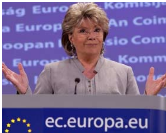
Viviane Reding, EU's retskommissær

Rammerne for, hvad der anses for at være en forbrydelse, ligger traditionelt