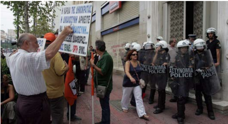
Nye strejker og massedemonstrationer imod EU og IMF diktat i Grækenland

Samtidig er det vigtigt at få flyttet fokus fra ens eget ansvar for krisen til ens indsats for at redde verden. Det er nok derfor Lagarde synes, at mødet var præget af anerkendelse og støtte, og at der ikke var nogen, der benægtede problemerne eller pegede fingre af andre.