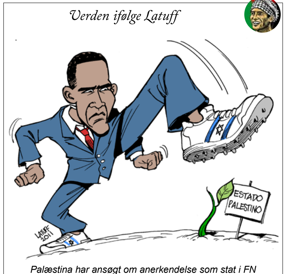
Palæstina har ansøgt om anerkendelse som stat i FN

Israel skal sikres endnu nogle år til at fortsætte stranguleringen af Palæstina. Men Israel, USA og deres lakajer har fået en ny stærk modspiller: Det arabiske forår.