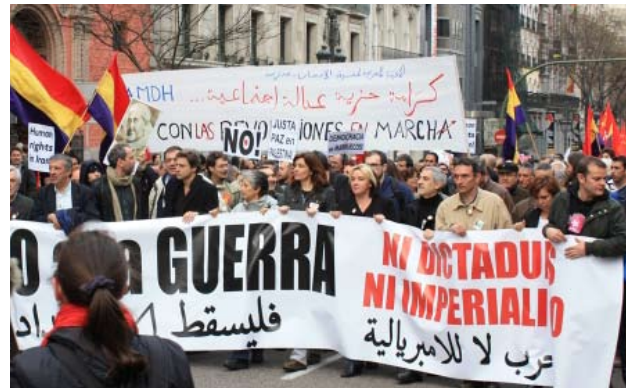
Hverken diktatur eller imperialism. Demo i Madrid den 26. marts 2011

Irak-krigen , som Obama ville afslutte i år, fortsætter og intensiveres. Marionetregimet forhandler om at forlænge de amerikanske besættelsesstyrkers ophold. De lovede tropetilbagetrækninger vil under alle omstændigheder være formelle. Specialstyrker klar til kamp skal placeres i