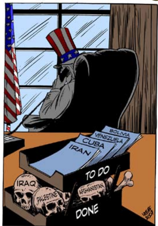
I krigsforbyrderens arbejdsværelse