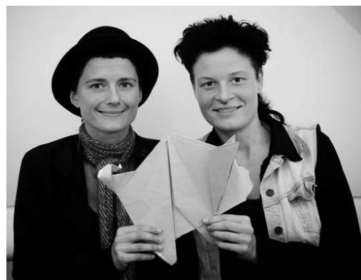
havn den 16. december 2009.

De er dømt for deres deltagelse i en fredelig civil ulydighedsaktion 'Reclaim Power - Pushing for Climate Justice' under klimatopmødet i Køben-