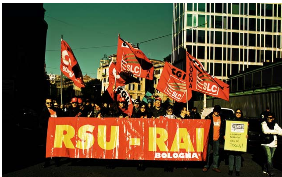
Generalstrejke Bologna, Italien december 2010

Te Selskabet tiltrækker modsat deres nordeuropæiske modparter ikke mange