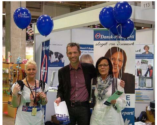
Dansk Folkeparti på Kæledyrsmesse i Fredericia.

K forsøger det sidste og bliver et 'midterparti', og har indgået en aftale med Margrethe Vestagers Radikale om at trække hver deres blok mod 'midten'. DF har sat fuld skrue på fremmedfjendtligheden og den uendelige reserverbeholder med chikanerier. Lars Løkke og V er ene på skansen om at fastholde de sidste 10-års venstreledte