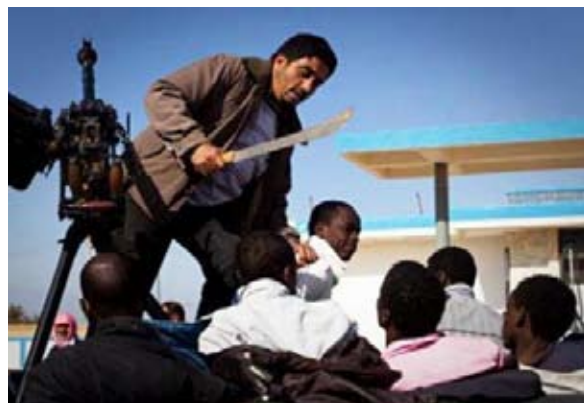
Libyens nye herskere dræber sorte, siger Den afrikanske Union

Alle forslag og forsøg på at fastlægge en fredelig proces for overgang til et demokratisk og suverænt Libyen er blevet afvist. På trods af det forsøger de borgerlige medier at fastholde et billede af et folkeligt oprør, som det var tilfæl-