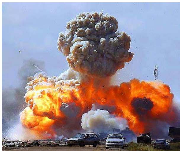
NATO-bomber over Tripoli

mand for Gaddafi-regimet på BBC, at det igen kontrollerede 75-80 pct. af hovedstaden. Men intense kampe, ledsaget af konstante NATO-luftangreb, fortsætter.