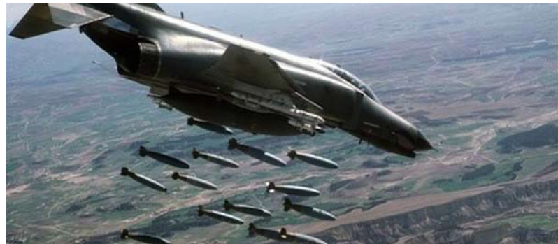
Tyrkiet fortsætter bombningerne i irakisk Kurdistan - ROJ TV skal forhindres i at rapportere