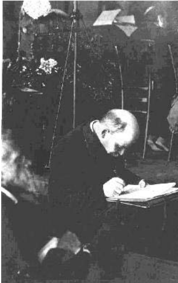
Lenin tager notater til sin tale på Kominterns 3. kongres 1. juli 1921

ville kunne vinde flertallet af bønderne over på jeres side i løbet af nogen uger! Måske Italien? ( Latter i salen. ) Hvis det påstås, at vi sejrede i Rusland, selvom vi kun havde et lille parti, viser dette kun, at det er folk, der ikke har forstået den russiske revolution og slet ikke forstår, hvordan man må forberede en revolution.