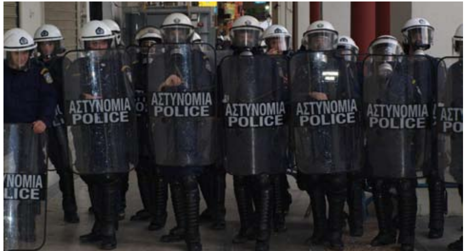
Græske demonstranter blev mødt med uhørt brutalitet under den 24 timers generalstrejke 11. maj 2011 imod nye nedskæringer.

De politiske krav er de samme, som høres over hele den kapitalistiske verden: Konkurrenceevnen skal forbedres,