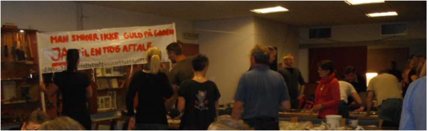
Ja til en tryk aftale! De konfliktende Prosamedlemmer mødes alle hverdage og forbereder aktiviteter

et valg kan risikere at kendes ugyldigt, og at også mange skatteindbetalinger kan forsinkes kraftigt. Også andre spørgsmål har skabt politisk røre i vandede, som sagen om at importere arbejdskraft for at udføre skruebrækkerarbejde.