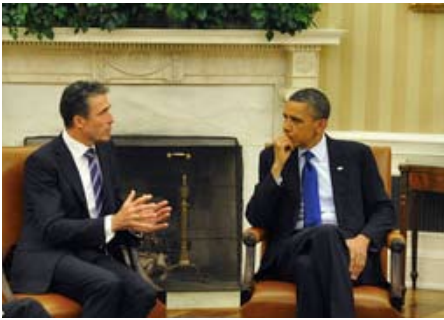
Anders Fogh hos Barack Obama 13. maj 2011

Den 13. maj mødtes præsident Barack Obama og NATO's generalsekretær Anders Fogh Rasmussen i Det Hvide Hus, og de gav hinanden tilsagn om at fortsætte de to store krige i verden, i Afghanistan og Libyen.