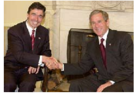
Fogh hos Bush i Det Hvide Hus 2002: "Irak har masseødelæggelsesvåben. Det er ikke noget, vi blot tror. Det er noget, vi ved."

Samme dag bombede krigsskibe fra alliancen – en del af den flåde på tyve skibe, som håndhæver blokaden af havet ved Libyen – en Røde Kors-bygning i den af oprørerne kontrollerede by Misrata, ligesom man bombede