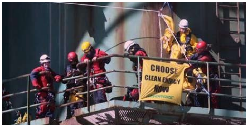
Greenpeaceaktion på boreplatformen Leiv Eiriksson da den var på vej til Grønland.

Fjernt beliggende borefelter og vanskelige vejrforhold kan betyde, at der kan komme til at gå dage, uger og endda måneder, før man kan reagere på