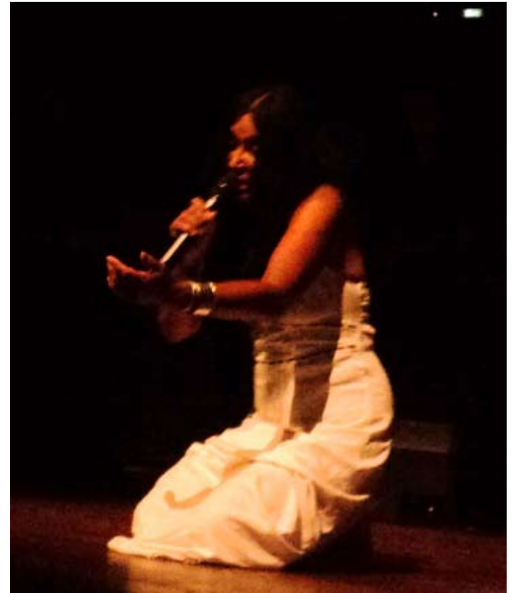
Annisette i Koncerthuset den 21. maj: Den magiske sang