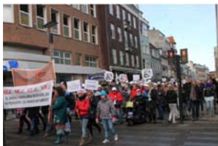
Demonstration 7. januar 2011 i Århus

Selvom det ikke lyder af meget, når regeringen lægger op til at beskære det offentlige forbrug fra 29 til 27 procent af BNP, så svarer det i praksis til, at op mod syv procent af de offentlige ansatte skal fyres. Det viser beregninger, som FOA Analyse har foretaget. Hvis forslaget blev gennemført i morgen, ville det betyde, at omkring 60.000 mennesker ikke længere skal passe børn, undervise, helbrede, vedligeholde veje og hjæl-