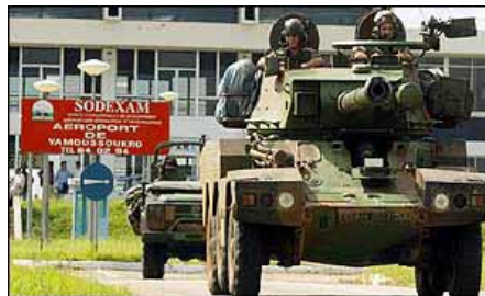
Franske tanks i Elfenbenskysten

NATO forbereder sig på en hel stribe afrikanske krige. To af dem – mod Libyen og i Elfenbenskysten – er udløst i de første måneder af 2011. Og i begge har Frankrig spillet en hovedrolle som krigsanstifter og som krigsmagt