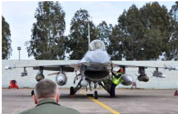
Dansk F16 fly klar til bombetogt over Libyen.

Det gælder tilbage til den første Golfkrig 1990-91, krigen mod Jugoslavien i 1999, Afghanistan fra 2001 og den anden Irakkrig fra 2003. Alle disse steder har virkningerne vist sig på sigt i form af misdannelser, aborter, voksende antal kræfttilfælde og mange andre skadevirkninger.