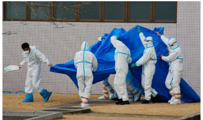
Arbejdere ved Fukushima atomkraftværket føres til hospital under pressning efter at være udsat for stråling

Der er et omfattende materiale om arbejdsforholdene i den japanske kerne-