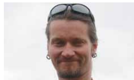
Den britiske politimand Mark Kennedy, der infiltrerede den europæiske klimabevægelse og Ungdomshuset i København og overalt havde sex med kvindelige aktivister

Denne tiltagende sammenblanding af politimæssig og hemmelig agentvirksomhed fører til en mere end betænkelig positionering af politiansatte som undercover politiske aktører. I Europa breder der sig åbenbart inden for politikorpsene en tiltagende forståelse af deres egen rolle derhen, at de er kaldet til og har ret til at udforske, intimidere, skabe usikkerhed og præventivt kriminalisere den radikale politiske opposition – og de bevæger sig dermed ind i retlige gråzoner. Denne rolle