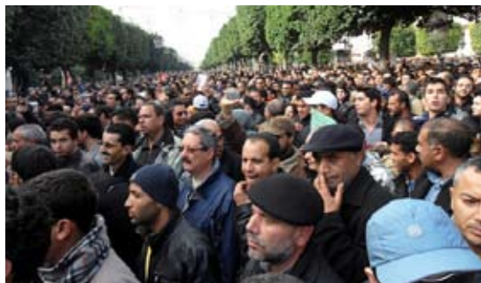
Protest i hovedstaden Tunis 14. januar

I den sidste tid har protesterne rettet sig mere og mere ind mod at angribe den forhadte præsident Ben Alis magtsymboler og tilholdssteder, herunder ødelæggelse og afbrænding af politistationer, borgmesterkontorer, præfekturer osv. Natlige udgangsforbud og politian-