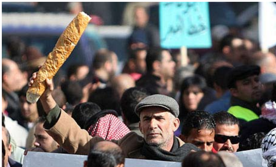
Demonstration i Jordan mod fødevareprisstigninger

Den almindelige krise betyder, at spekulanter i nogen grad har søgt mod