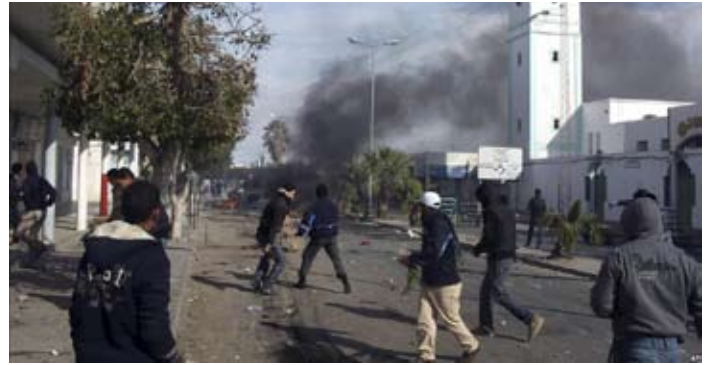
Over hele Tunesien kæmpede unge med politiet og gik til angreb på Ben Ali-regimets magtpositioner

Det repressive regime i Tunesien har stået på rigtig god fod med den amerikanske imperialisme og EU. Det har meget nære forbindelser med den gamle kolonimagt Frankrig og den forhadte franske præsident Sarkozy. Tunesien er tilmed fremhævet som en slags rolle-