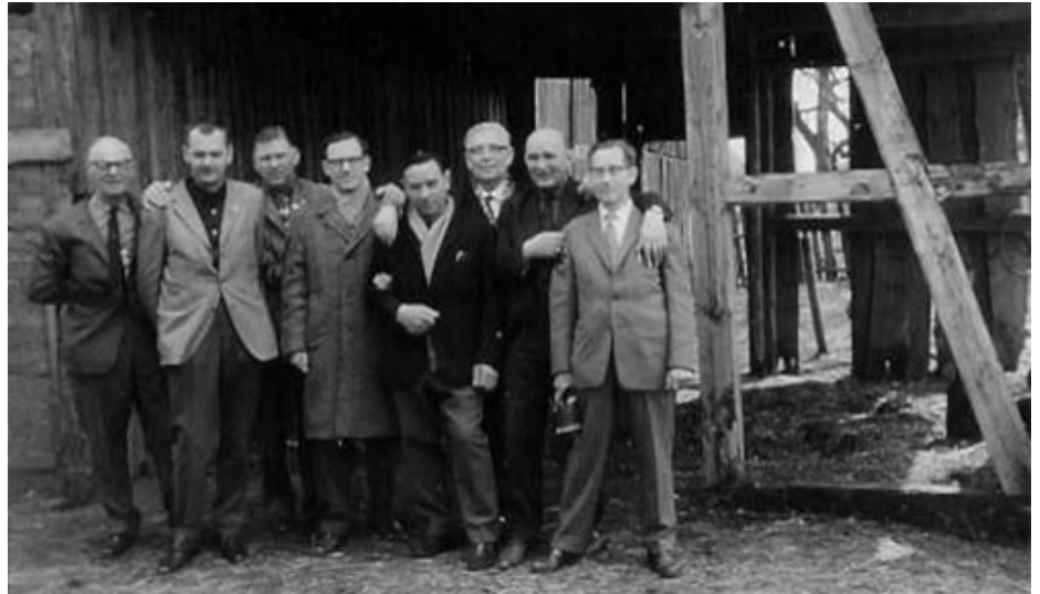
Horserød-Stutthof Foreningen, 1970. Rejse til koncentrationslejren Stutthof.

Vi ændrer ikke vore holdninger og meninger til de forrykte og diskriminerende terrorlove – en afskrift af tidligere præsident Bushs "Patriot Act" – som først og fremmest er beregnet til at så angst i befolkningen, så den holder