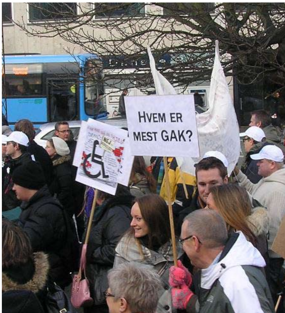
Se fotoreportage fra demonstrationen på kpnet.dk