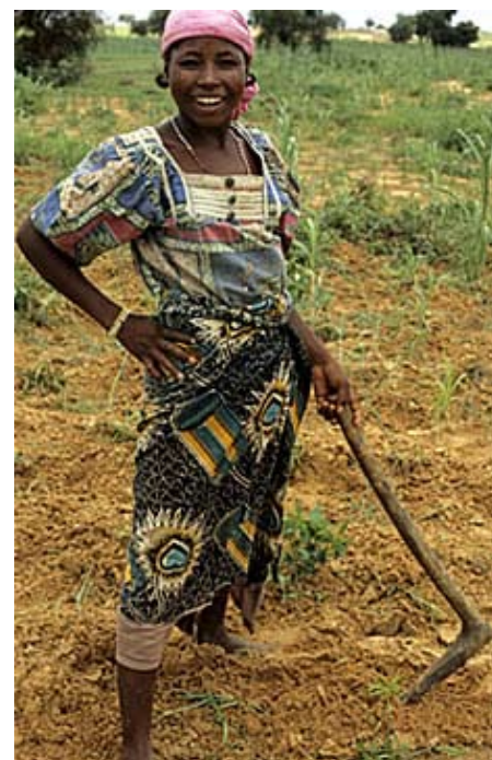
Landbruget i udviklingslande bliver holdt nede

Og borgerskabets regeringer tvinges på retræte, til at give indrømmelser