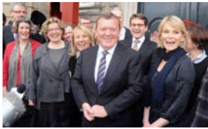
Løkke-regering i krise. Fra ministerrokaden 23. februar 2010

Så valget blev ikke udskrevet i den omgang. Men valgkampen kørte videre