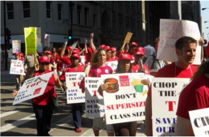
Lærere i Chicago protesterer i maj 2010 mod budgetnedsættelser og højere klassekvotienter

for hvert trin. Arbejdsfri indkomster – som dividender og kapitalindkomster – skal beskattes mindst lige så højt som optjent indkomst (penge, som folk faktisk arbejder for). Skattelettelser til de rige betyder med præcis nøjagtighed nedgang i almindelige amerikaneres formue. Skattelettelser til de rige betyder med tilsvarende nøjagtighed en vækst i ulighed. Vi havde en mulighed for at sinke denne proces ved at lade den sidste runde, Bush-skattelettelserne, blive ophævet. Vi har tabt den runde.