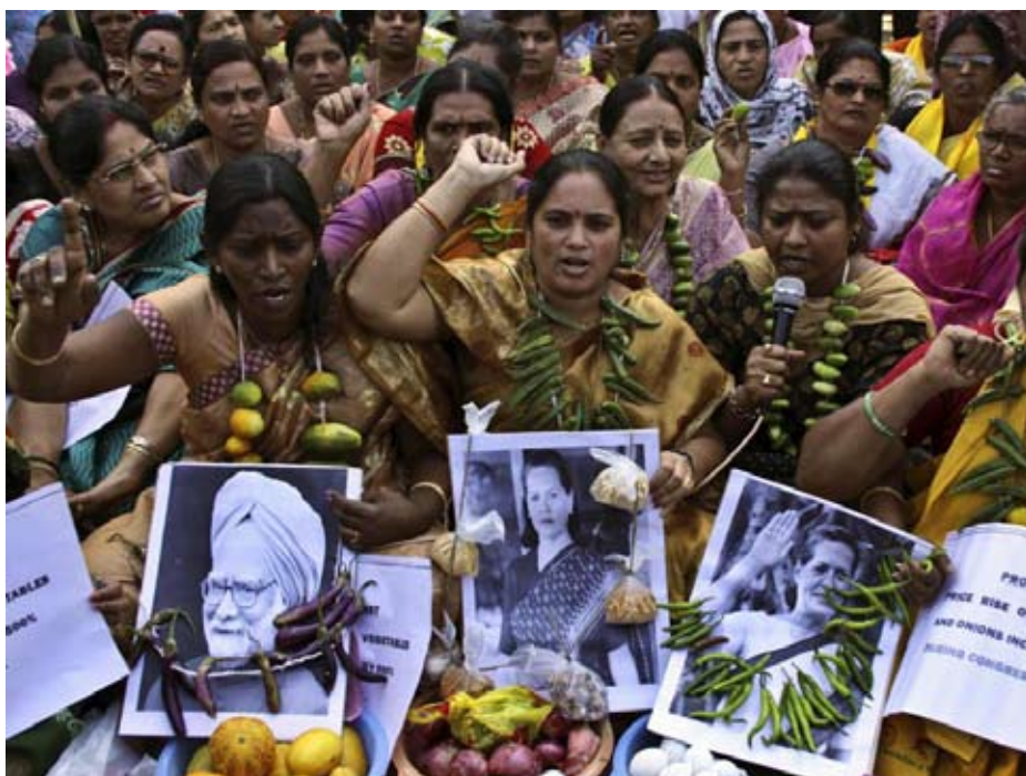
Protest i Indien mod fødevarerprisstigninger

tredjestørste globale leverandør af sojabønner. Argentina er også en stor hvedeleverandør og næststørste majsudbyder. Som følge af udsigten til prisstigninger har den argentinske regering forsøgt at regulere eksporten med toldsatser, hvilket både i 2008 og i januar 2011 har udløst en kamp om, hvilke dele af fødevarerindustrien der skal vinde mest på prisstigningerne. Sikre tabere er den fattigste del af befolkningen og de små landbrug.