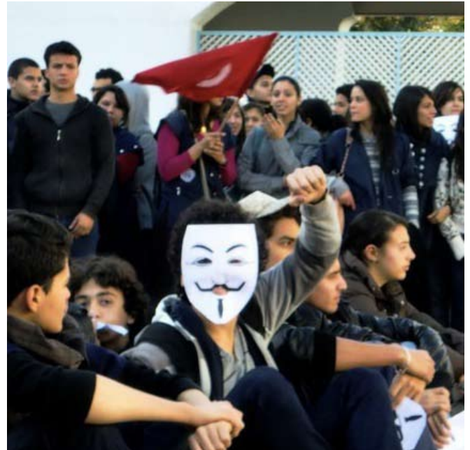
Tunesisk gymnasieungdom støtter Jasmin-revolutionen.

Vi lever ikke, men tror, at vi gør. Vi ønsker at tro, at alt er i den skønneste