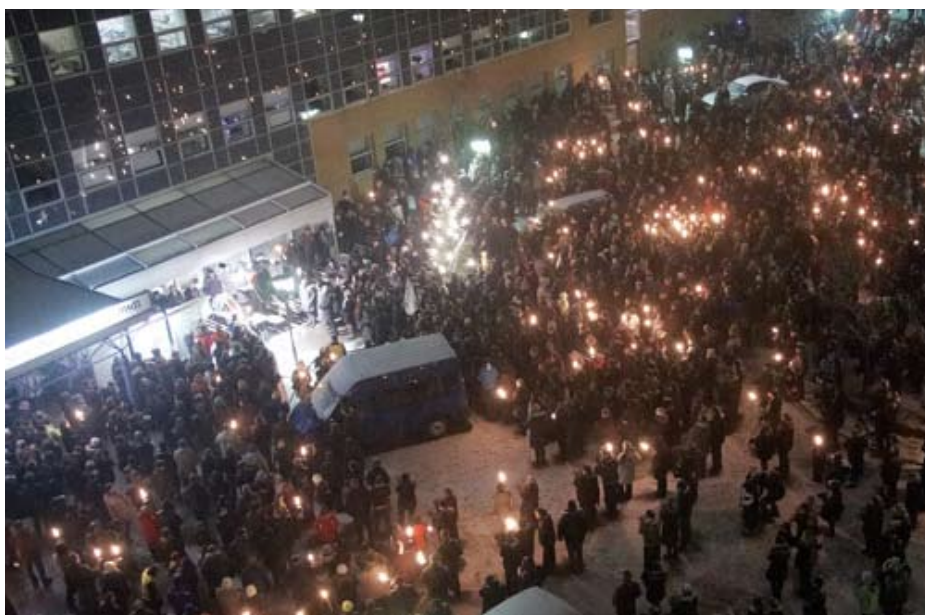
Fakkel demonstration for bevarelse af Holstebro Sygehus og akutberedskabet samlede 5000 mennesker i januar 2011