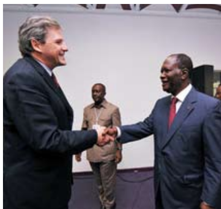
Alain Le Roy tv. Fra FNs fredbevarende styrker, hilser på Elfenbenskystens nye præsident Alassane Ouattara

Han har foreslået, at Elfenbenskysten fremover ledes af en samlingsregering, men Ouattara og hans støtter insisterer på, at denne skal have magten, evt. støttet af en militær intervention fra en række nabolande, som tre præsidenter truer med.