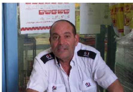
G4S vagt i supermarked i bosættelsen Modi'in Illit, august 2010.