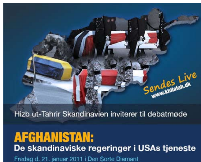
Billedet af nordiske soldater der vender hjem i kister fra Afghanistan har skabt stor forargelse blandt krigspartierne

Men er det kriminelt at tale om de besattes ret til at forsvare sig? Hvordan kan man i Danmark hylde modstandsbevægelsen, som gjorde væbnet modstand mod tyskernes besættelse under 2. verdenskrig, og samtidig kriminalisere andres modstandskamp?! Når politikere, der legitimerer deltagelsen i