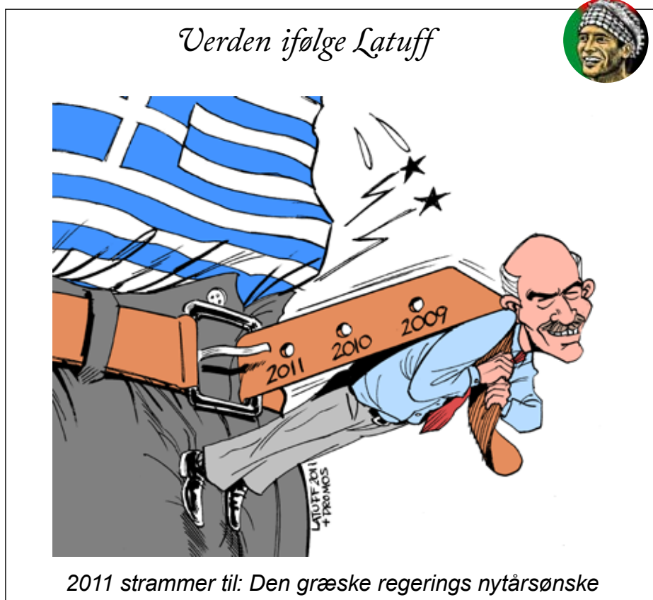
2011 strammer til: Den græske regerings nytårsønske

Det er det første sociale oprør i et arabisk land i en lang årrække. Men det finder de vestlige medier ikke er værd at berette om.