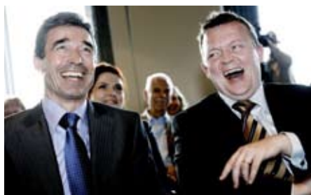
To af det nyliberale systemskiftes hovedarkitekter

VK-regeringen har hele tiden været i trekant med det populistiske, racistiske og krigsgale Dansk Folkeparti, der som stueren regeringsstøtte i dag er blevet en fremtrædende del af et hurtigt voksende, p.t. parlamentarisk europæisk ultrahøjre.