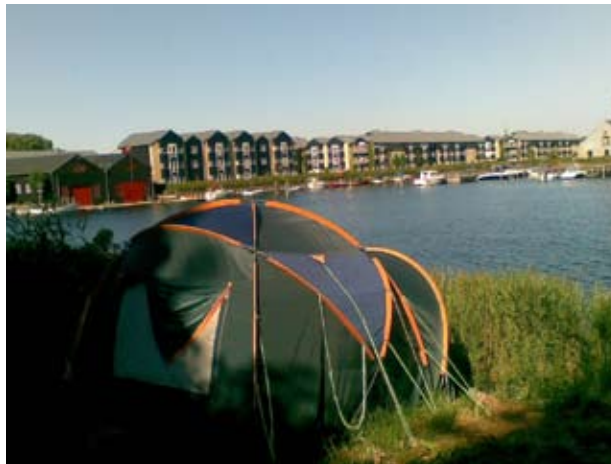
Teltby ved Christiania.

Overskrifterne kommer ikke ud af den blå luft. Tæt på årsskiftet kan det konstateres, at antallet af tvangsauktioner for 2010 runder de 5.000. Man skal tilbage til 1995 for at finde en tilsvarende situation. Starten af 90'erne var dønninger oven på Schlüters såkaldte ”kartoffelkur”, som udtrykte den tidli-