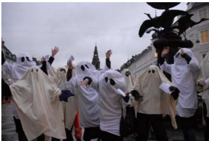
SU-spøgelset går igen

Vil det lykkes statsministeren at give andre folkevalgte brug af privathospitaler skylden for overbetalingen af privathospitalerne?