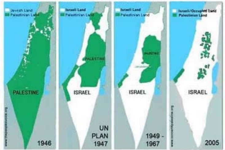
Palæstinensisk tab af land fra 1946-2005

EU – Danmark medregnet – svigter endnu engang palæstinenserne og dække over Israels forbrydelser.