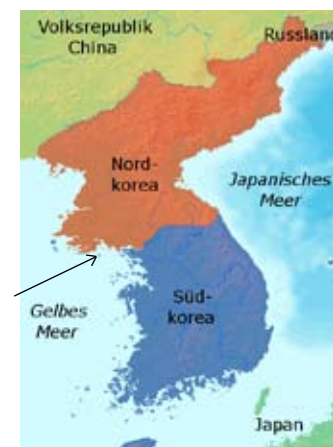
Krigsøvelse få km fra kysten

Vi finder, at Sydkoreas myndigheder og USA må bære det fulde ansvar for den meget alvorlige udvikling i Korea, samt ansvaret for ofrene for angrebet på militærbasen på Yonpyong. Ved afholdelse af aggressive flådeøvelser og afskydning af granater helt op til og ind over DDF Koreas farvande har Sydkorea og USA ensidigt eskaleret situationen til det ekstreme. Dertil kommer, at Sydkorea og USA leger ekstra uansvarligt med ilden ved at afholde flådeøvelse i et konfliktområde, hvor Nord-Syd-demarkationslin-