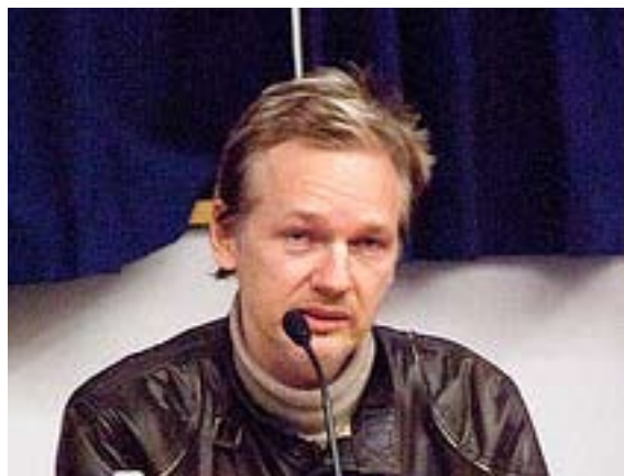
Wikileaks talsmand Julian Assange

Af sikkerhedsmæssige grunde befinder Autistici/Inventati servere sig ikke i Italien, men er spredt udover Europa, bl.a. i Holland og Norge. På grund af sagens alvor - modstand mod fascisme