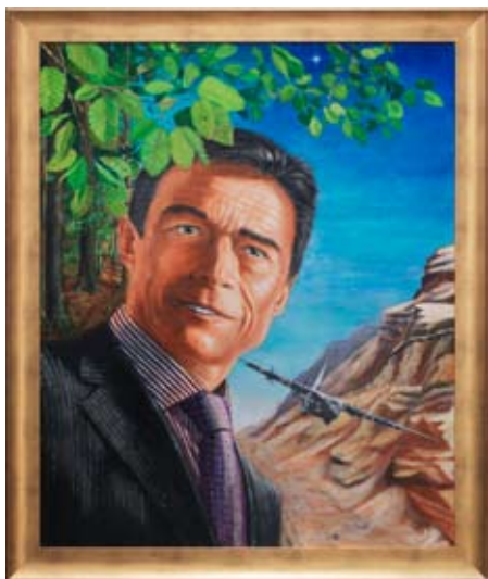
Anders Fogh Rasmussen i Folketingets portrætsamling

200.000 kr. er den officielt oplyste pris for det officielle portræt af fhv. statsminister Anders Fogh Rasmussen, som skal hænge på Christiansborg sammen med andre statsministerkontrafejer. Og det må i grunden siges at være billigt for et propagandamaleri, der er eksponeret vidt og bredt og via medierne er nået ud i den fjerneste afkrog sammen med historien om, at maleren er tidligere bz'er og ikke særlig vant med at beskæftige sig med maling.