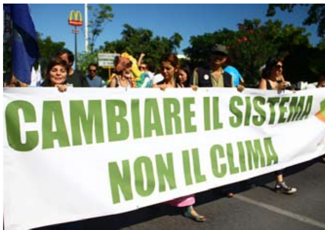
'System Change Not Climate Change' Demonstration ved FN's klimakonference COP 16 - Cancun, Mexico. Den 5. december 2010

tværs af disse medier lydt et skrig, fordi Japan netop har meddelt, at man ikke vil forlænge Kyoto-Protokollen, da det er dårligt for konkurrenceevnen ift. bl. a. Kina.