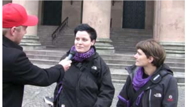
Stine og Tannie.

Heldigvis er pressen upartisk og ikke det mindste enøjet, så politiets anklager,