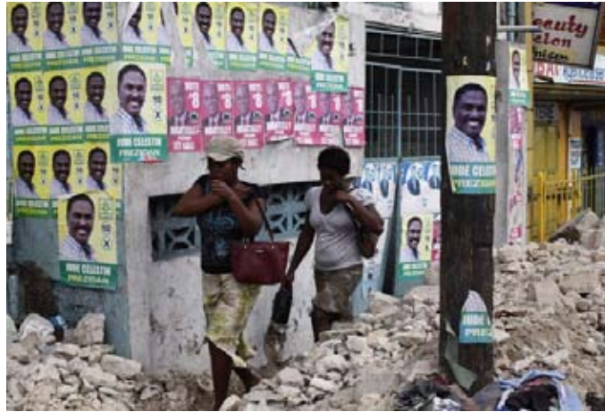
Besættelse, murbrokker og koleraepidemi er virkeligheden i Haiti, mens facaden dækkes af fupvalg

"På en nyhedskonference på valgefertmiddagen opfordrede 12 ud af 18 kandidater, der stadig var med i kapløbet, valgkommissionen til at aflyse valget på grund af "massiv svindel", som de beskrev som bestræbelser fra (Prevals) Unity Party på ... at fylde stemmebokse og afvise vælgere, der gik imod Prevals