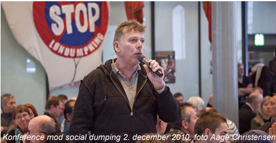
Konference mod social dumping 2. december 2010.

Men en sådan efterspørgselsstigning kan kun komme fra stigende eksport, stigende privat forbrug og investeringer og/eller stigende offentligt forbrug og investeringer. Men som tingene ligger i dag tegner udviklingen ikke lyst på nogen af områderne.