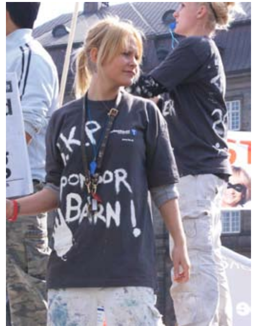
Unge billigt til salg

pligt for virksomhedsejere og virksomhedsledere at sende produktion ud til lande, hvor omkostningerne er lavere. (...) Det skal de gøre for at varetage aktionærernes tarv".