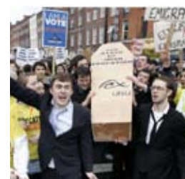
Studenterprotest i Irland, 3. november

Samtidig advarer de danske 'økonomiske vismænd' om, at Danmark styrer mod en afgrundsdyb gæld og går samme vej som Irland. Danmark låner simpelt hen ni millioner kr. i timen, hedder det. Og derfor skal danskerne nu tvinges til at acceptere massive nyliberale 'reformer' med Irland som skræmmebillede – nedskæringer af efterlønnen, ændring af boligbeskatningen og nye offentlige nedskæringer – ifølge 'vismændene'.