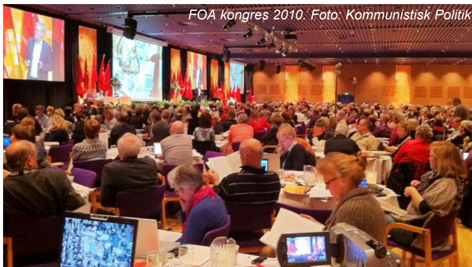
FOA kongres 2010.

Det har for FOA til næste års overenskomstfornyelse været vigtigt at få indbygget solidarisk lønudvikling som princip, hvilket konkret skulle udtrykkes ved, at lønstigningen for de flestes