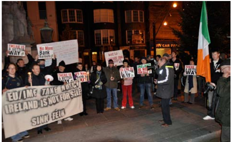
Sinn Féin protest i byen Cork mandag aften, imod regeringen og EU/IMF planerne for at sende regningen fra de fallerede spekulanter til befolkningen

Det faktum, at spekulationsboblen i huspriser sprang, var en af krisens udlø-