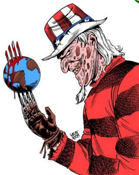
Verdens værste mareridt