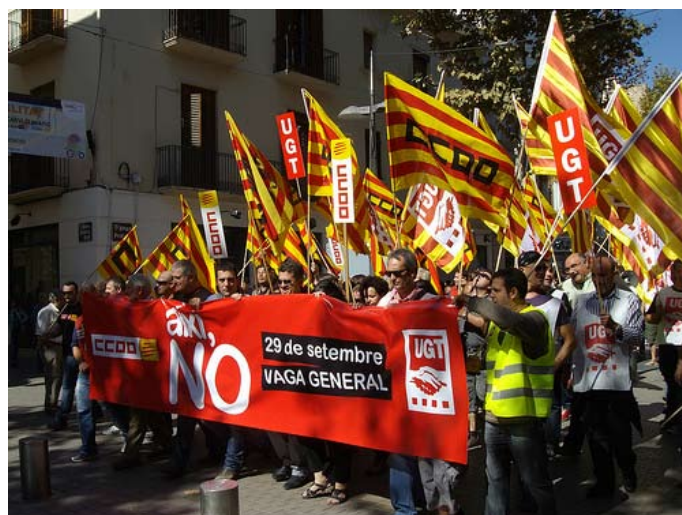
Fra generalstrejken i Spanien 29. september 2010

Så vi vil nu se begyndelsen til Den Store Globale Gældsdepression , hvorunder vestlige og globale stormagter barberer sociale udgifter væk og skaber massearbejdsløshed ved at afmontere sundhed, uddannelse og sociale ydelser. Desuden vil den statslige infrastruktur - som veje, broer, lufthavne, havne, jernbaner, fængsler, hospitaler, strømforsyning og vand - blive privatiseret, så de multinationale selskaber og banker vil eje samtlige nationale aktiver. Samtidig vil skatterne stige dramatisk til niveauer, der aldrig før er set. BIS siger, at renterne bør stige på samme tid. Det vil bevirke, at betalingen af renter på gæld dramatisk vil stige både på nationalt og individuelt plan, og tvinge regeringerne til at vende sig imod Den Internationale Valutafond for at få nye lån - sandsynligvis i form af den nye globale reservevaluta - blot for at betale renter og vil på denne måde