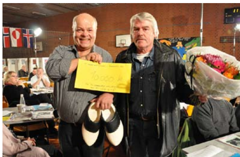
Repræsentanter fra TIB Nordjylland og 3F Midtvestsyssel modtog træskoprisen for indsatsen mod social dumping