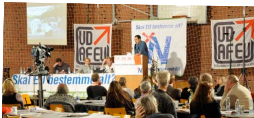
Folkebevægelsens landsmøde blev afholdt i Århus