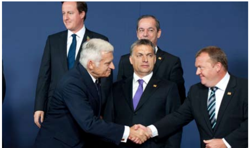
Formanden for parlamentet, Jerzy Buzek, hilser på den danske Statsminister, mens det sædvanlige opstyltede gruppebillede opstilles

EU er en stærk blok i de rige landes klub, G20, og topmødet vedtog på det kommende G20-topmøde i Sydkorea at slå til lyd for, at nedskæringer – som dem der gennemføres i EU-landene – er den rigtige krisemedicin.