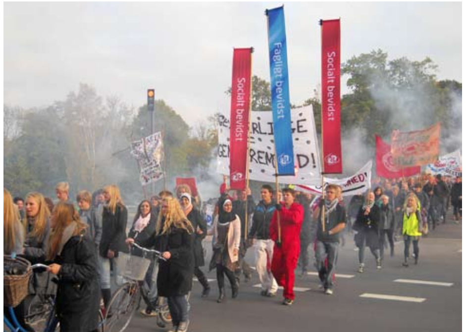
Unge tager ansvar demonstration i Odense ved Folketingets åbning den 5. oktober, startede fra munke mose i røg og damp

En af de 29 ghettoer ligger lige ved siden af, hvor vi bor. På grund af krisen har jeg skiftet byggepladsen ud med skolebøger, og vores husstandsindkomst er ca. en tredjedel af, hvad den var for ikke så længe siden. Samtidig er priserne på især fødevarer steget meget de seneste år. Det nærmeste supermarked er 15-25 % dyrere end discount-kæderne, og så vidt det er muligt, køber vi ind i discounten. Og her kommer pointen: Discount-supermarkedet ligger ved siden af ghettoen. På vores vej gennem ghettoen har vi opdaget en