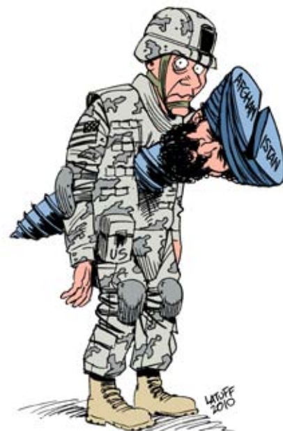
Besættelsesmagten 'Screwed' i Afghanistan