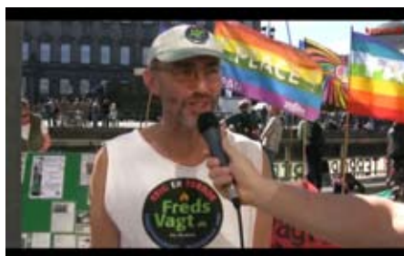
KPnetTV til alternativ flagdag

Det trykte 14-dages-blad Kommunistisk giver et uundværligt overblik i de flimrende begivenheder, analyserer og giver perspektiv. Og nu i farver i kraft af ny trykmaskine. Det fås også gratis som pdf på hjemmesiden.