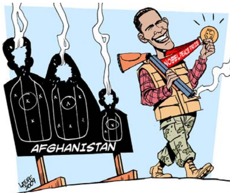
Sidste år var det krigspræsidenten Barack Obama, som modtog Nobels Fredspris. I år er det en af hans kinesiske venner

Kommunisters rolle i den vestlige verden må være at modarbejde både national og imperialistisk udbytning. Det kan vi ikke opnå gennem støtte til Liu Xiaobo.