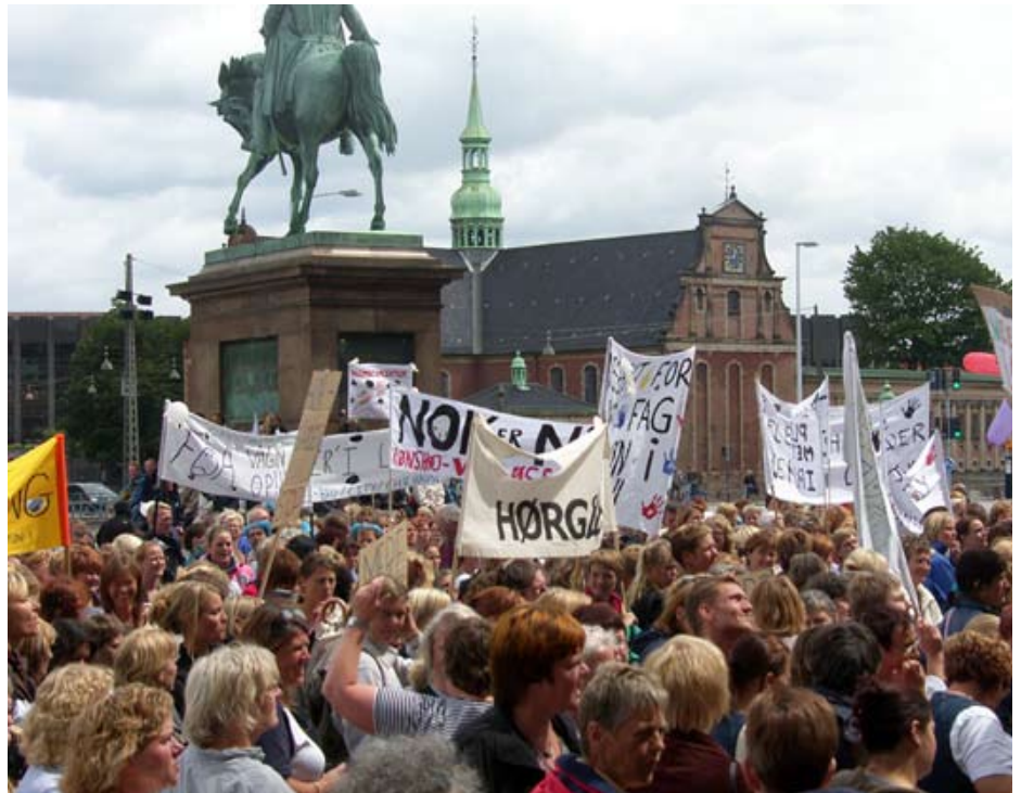
Sosu-demonstration ved Christiansborg 2007

- For det første er det plejen og omsorgen for patienterne, der rammes. Kvaliteten daler, når der er færre til at tage vare på patienterne. For det andet skabes der en voldsom gøgeunge-effekt. De stærkeste faggrupper presser simpelt hen de lidt svagere ud. Og på lang