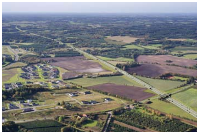
Motorvejen skærer sig gennem landskabet ved Silkeborg

Planen, der blev fremlagt for på et lokalt borgermøde i Struer i begyndelsen af september, blev ikke modtaget med begejstring. Den alvorlige problemstilling i de byer og landsbyer, der ikke særlig kønt omtales som Udkantsdanmark, er ikke mangel på veje eller butikker. Det er den kendsgerning, at borgerskabet, dets regering og politiske partier nedlægger de helt grundlæggende nødvendige samfundsstrukturer såsom folkeskoler og sygehuse. Og dermed reelt