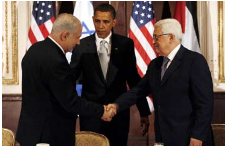
Natanyahu, Obama og Abbas i Det Hvide Hus til såkaldte fredsforhandlinger

I en erklæring udstedt af PFLP's politbureau hed det at "mødet i Det Hvide Hus og galamiddagen der fejrede begyndelsen på direkte bilaterale forhandlinger, minder om billedet af græsplænen foran Det Hvide Hus 13. september 1993, da Osloaftalen blev underskrevet, kun med ændring af aktørerne og de omgivende statister". Osloaftalen, sagde Fronten, har ført til katastrofe for det jævne palæstinensiske folk, og de nye forhandlinger fremsætter de samme trusler.