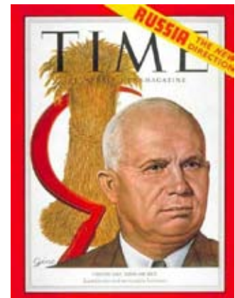
Nikita Hrusjov på forsiden af Time Magazine november 1953 under overskriften Rusland - Den ny kurs

Var der noget som helst i de fortidsbelastede revisionistpartiers 50 år forsinke-