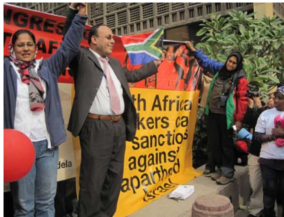
Sydafrikanske arbejdere kræver boykot af Apartheid-Israël

I en artikel i det israelske dagblad Ha’aretz skriver Nehemia Shtrasler