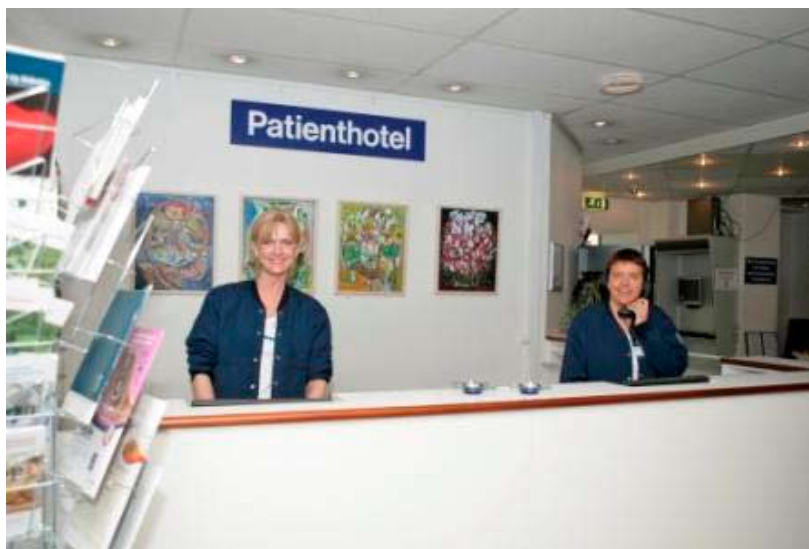
De små bliver budt velkommen til verden i Ålborg patienthotel og forældrene er velkomne mod betaling

Det er ikke en billig omgang at booke privat hjælp for de desperate nybagte forældre. Det koster 5.500 kroner for det første døgn og 4.500 kr. for næste døgn at bo på Barselshotellet i Gentofte. I gennemsnit tjekker en familie ind for tre døgn, og det koster i alt 13.500 kroner.