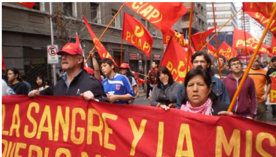
Fra Kommunistisk Parti (AP)'s sektion under marchen i Santiago på årsdagen for det fascistiske militærkup

Det chilenske militær med general Pinochet i spidsen tog magten ved et kup, som dræbte den socialistiske præsident Allende og likviderede hans venstrefløjskoalition, som bl.a. blev støttet af landets såkaldt kommunistiske parti. Dette revisionistiske parti udbredte sig både i Chile og internatio-