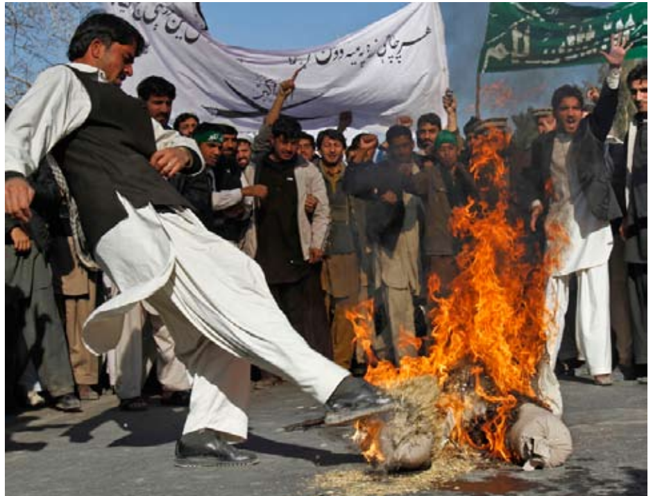
Afghanere protesterer mod NATO-drab på civile

Midt i august passerede dødstallet for amerikanske og NATO-soldater i Afghanistan tallet 2000 og vokser faktisk dag for dag - 2051 pr. 31. august - med amerikanske tab, der udgør godt 60 % af det totale antal. USA havde 19 døde i kamp på fire dage fra den 28. august.