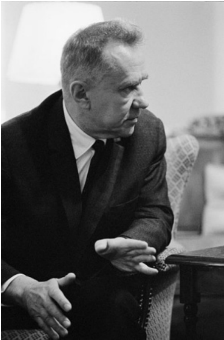
Aleksej Kosygin var arkitekten bag de kapitalistiske reformer i 1965.

magtede i tide at afsløre Gorbatsjov- og Sjevartnadse-klikens forræderi».