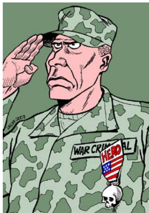
Flagdag for krigsforbrydelser