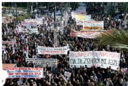
Arbejdere på gaden i Grækenland

Det krav modsatte arbejdsgiverne med Dansk Industri i spidsen sig som bekendt. Arbejdsgivernes modstand var ultimativ. Arbejdsgiverne nægtede på flere områder overhovedet at forhandle noget som helst, så længe kravet var på bordet!"