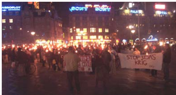
Stop USAs krig - København 7. oktober 2001

Jeg er overbevist om at det vigtigste skridt i den retning er at se krigen i sammenhæng med nedskæringer og repression. Den politik der dikterer nedskæringer og forringelser som løsning på den økonomiske krise, skærper samtidigt overvågning, kontrol og straf for at imødegå modstand. Og det er den samme politik der kigger på verden og ser et overdådigt ta-selv bord, og som et andet svin vælter alt i sin jagt på delikatesserne.