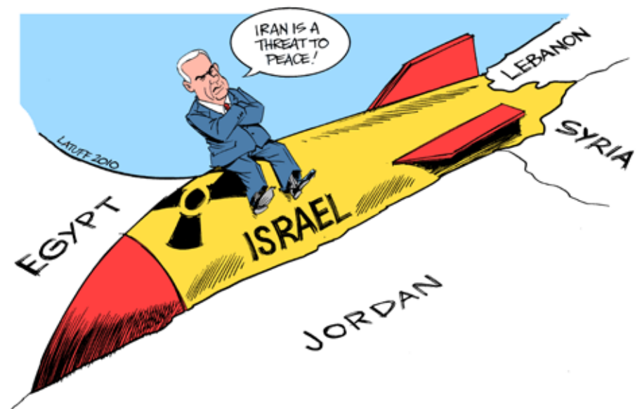
Atommagten Israel vil i krig