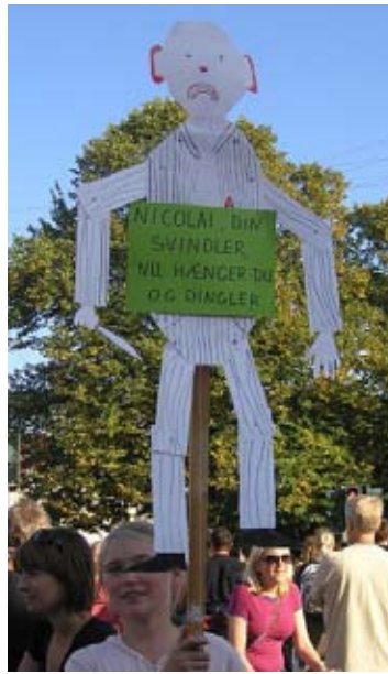
Århus 12. september 2006: Tusinder i protest mod nedskæringer

Kommunistisk Politik nr. 18, 2009 beskrev ved sidste års budgetforhandlinger i Århus, at det fremlagte budget skulle ses som del af valgkampen pga.