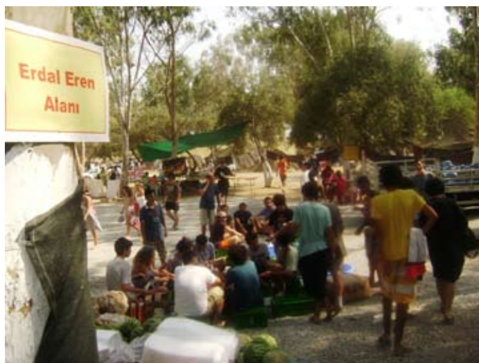
Erdal Eren alene på International Ungdomslejr 2010 i Selcuk. Erdal Eren var medlem af det illegale tyrkiske marxistisk-leninistiske parti og blev henrettet af militærjuntaen i 1979

folks kamp i Tyrkiet for national frihed; imod undertrykkelser af palæstinenserne og angrebene på Libanon fra den zionistiske israelske regering; og imod den imperialistiske blokade af det iranske folk. Vi drøftede de imperialistiske provokationer i Kaukasus, spændingen mellem Colombia og Venezuela, og krigsforberedelserne fra imperialistiske kræfter som USA og EU i andre dele af verden, med repræsentanter fra ungdommen i disse lande eller nabolande.