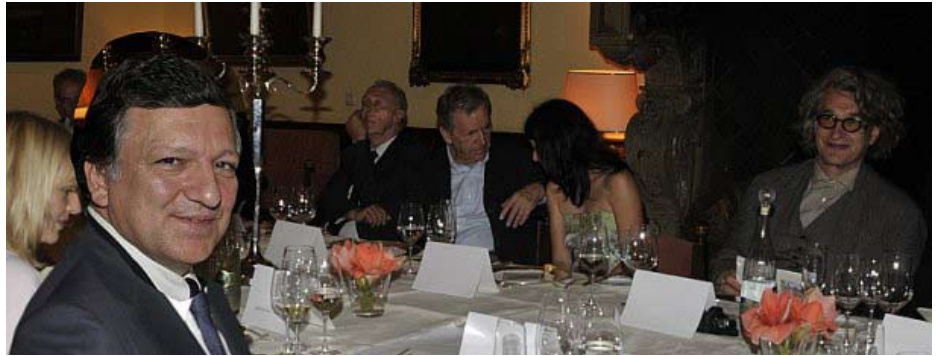
Barroso & Co. bliver et stadig dyrere bekendtskab for Danmark

Som alle ved har VK-regeringen været ufattelig dygtig til at kanalisere midlerne over til private aktører, konsulenter og bureaukrater, der suger næring fra det offentlige – og undgå at de offentlige midler kommer folk og børn på gulvet til gode. -lv