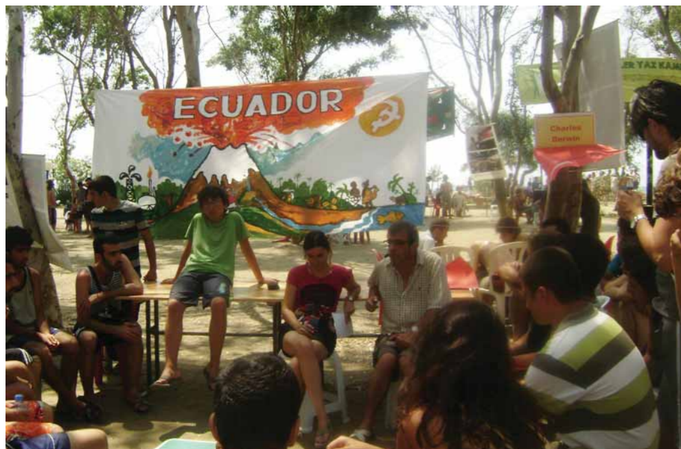
Workshop om situationen i Latinamerika