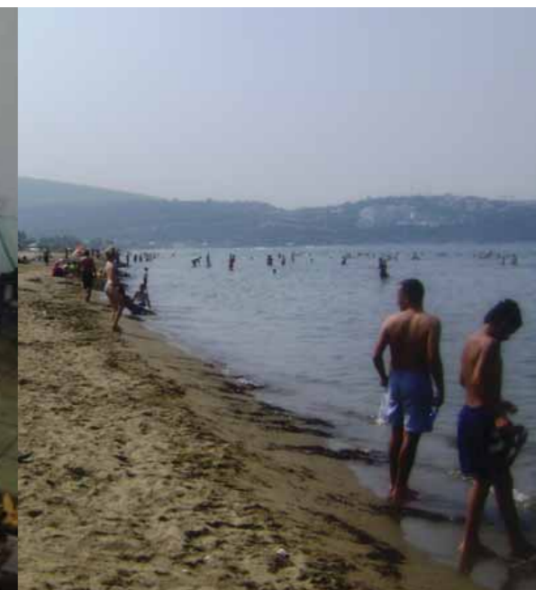
Hele lejren tog morgenbad i Ægæerhavet

Spørger man en deltager fra et af de tredive deltagende på den internationale antifascistiske og antiimperialistiske ungdomslejr i Tyrkiet om, hvad han/hun oplevede det, vil svaret være: 'Det var fantastisk' .