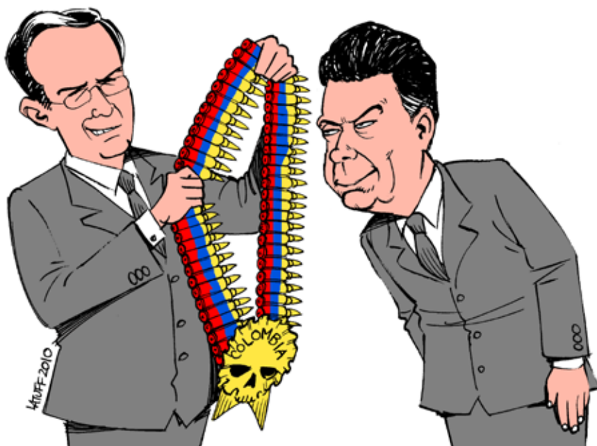
Den afgående Alvaro Uribe overdrager det symbolske colombianske præsidentskærf til Juan Manuel Santos