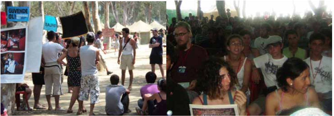
Revolutionær ungdom 2010