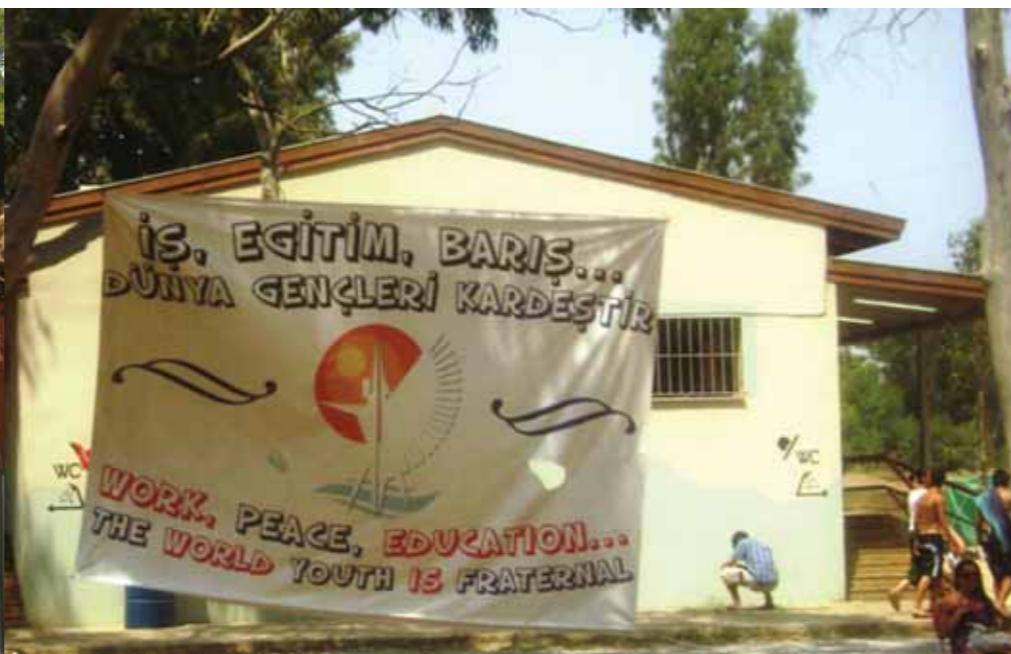
Den internationale Ungdomslejr's hovedparoler: Arbejde, Fred, Uddannelse