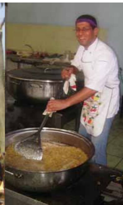
Fodring af 3000 mennesker 3 gange dagligt: et kæmpejob