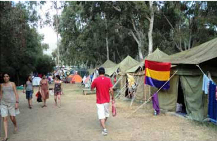
En af teltgaderne – denne opkaldt efter Clara Zetkin