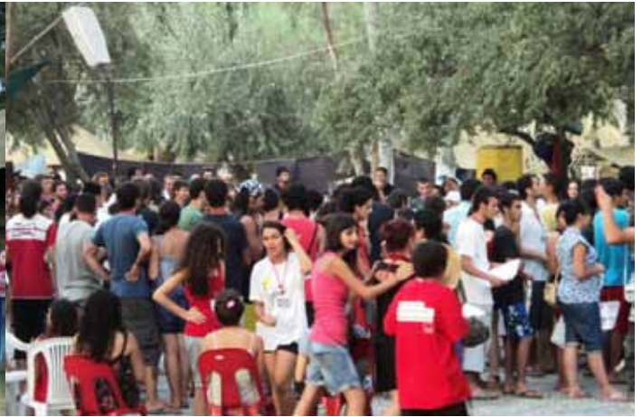
Ungdomslejren i madkø

barrikaderne for at kæmpe imod imperialismens stadig voldsommere nyliberale angreb og væbnede aggressioner. Denne generation udmærker sig allerede med ære i den revolutionære kamp og befrielseskampen. Det gælder i Palæstina, Afghanistan, Irak, det gælder i de latinamerikanske lande, som kæmper for at befri sig for den amerikanske imperialismes dominans og finde vejen til socialisme, det gælder i de kriseplagede EU-lande som Grækenland, Spanien, Frankrig eller i Danmark.