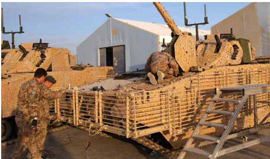
Alle køretøjer bliver udstyret med et RPG-gitter, beregnet på at stoppe panserbrydende granater. På billedet ses de 37,8 millioner kr., før de kørte på en vejsidebombe.

gelsen, så er det mere end bare et nyt tab og en mindre justering af krigsindsatsen, det er en pind i ligkisten for hele den nyere danske krigsbejstring.