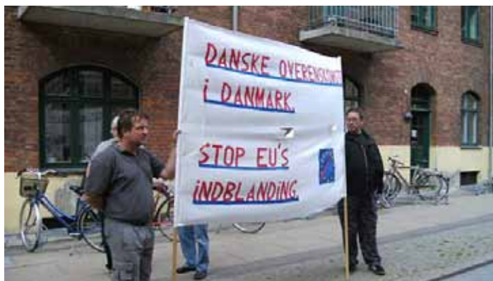
Faglig kamp mod løntrykker firma i Trekronergade