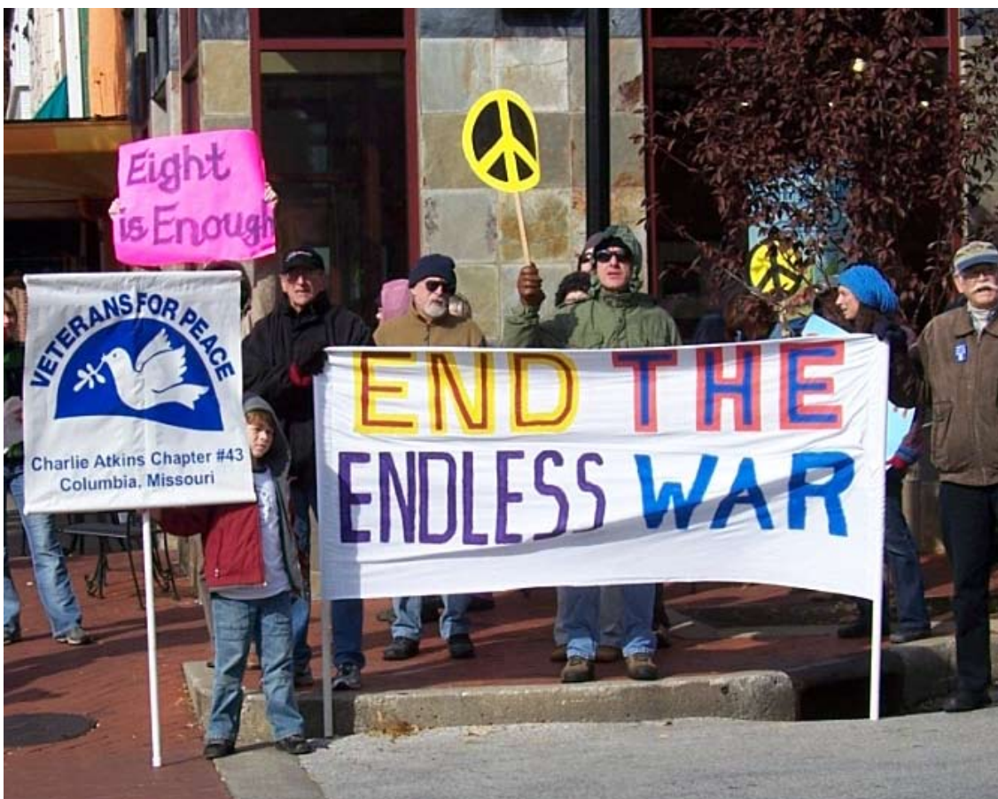
Amerikanske veteraner mod krig