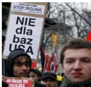
Protest i Polen mod Missilskjoldet.

I relation til, hvor den reelle 'første forsvarslinje' skal ligge, tilføjede Fogh med reference til sidste års hviderussiske og russiske militærøvelse nær Polens grænser: "Hvis vort militær er stationært, hvis vi ikke kan flytte vores væbnede styrker over ethvert medlemslands grænser, vil forsvaret af allieret territorium ikke være effektivt... Vi