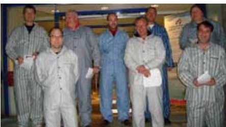
Pyjamasfolket i demonstration.

Af Aktionsgruppen Arbejdere – Akademikere