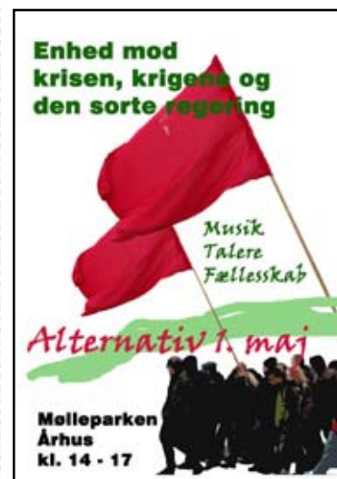
1. maj plakater fra København og Århus.

I Danmark bør der være social velfærd for flertallet, ikke kun for de rigeste.