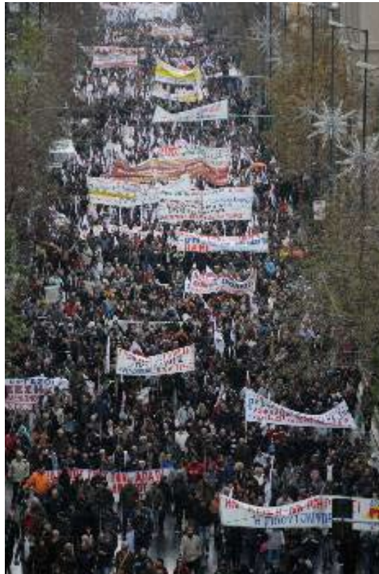
Strejke og demonstrationer i Grækenland den 10. februar.

Regeringens spareprogram skal nedbringe det græske underskud på statsbudgettet, som i dag er på 12,7 pct. af bruttonationalproduktet (BNP), hvilket