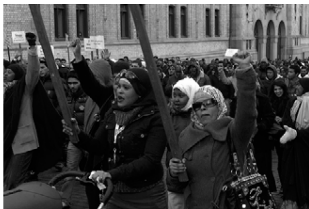
Den 12. februar gik omkring 3000 i demonstration i Oslo, Norge, i protest mod muslimhetzen.

dreere med overvejende muslimsk baggrund. Den underliggende hensigt er at bremse integration og udvikling af klassesolidaritet og kampfællesskab, ved at "kulturforskelle" og religion bliver blæst op til overordnede modsætninger i samfundet.