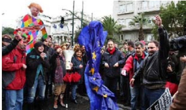
Græske demonstranter afbrænder EU flag.

Det er også med baggrund i 'konvergenskravene', at den danske regering vil gennemføre sin dramatiske 'hestekur', som skal nedskære de offentlige udgifter med 27 milliarder kroner i