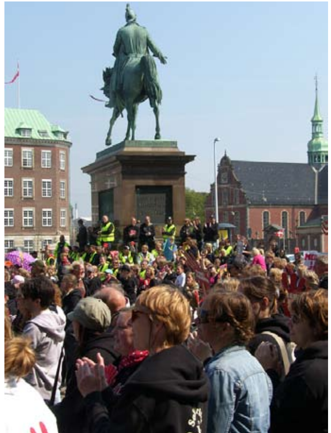
De fleste danskere vil have dagpengesatsen sat op, men det overvældende flertal på Christiansborg ignorerer det

Når der kræves højere dagpengesatser, er det en god idé i samme åndedrag at