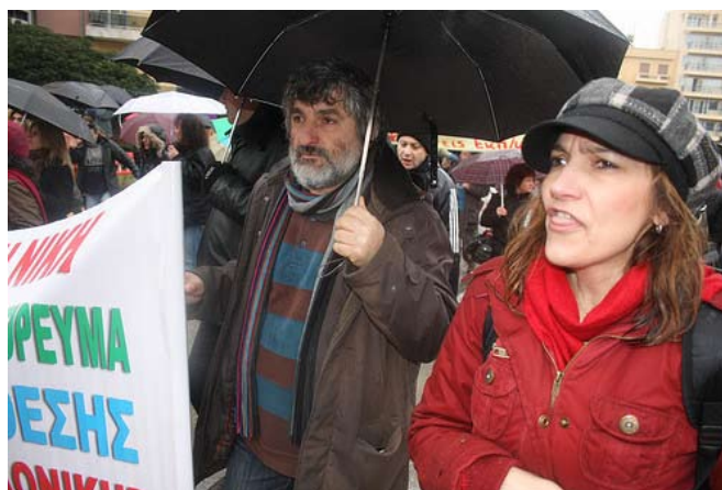
Offentligt ansatte i demonstration ni Thessaloniki

"Offentlig ansatte er tvunget til at betale for en økonomisk og finansiel krise, som blev skabt af et afsporet