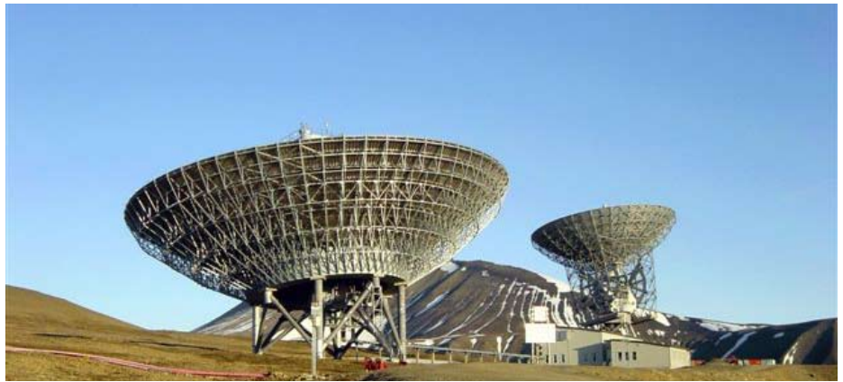
Kan de kraftige militære radar forsøgsstationer i Skandinavien også være udgangspunkt for mystiske eksperimenter med vejret?

Baggrunden var både russisk nervøsitet over det som snart skulle blive til amerikanernes rumkrigsprogram og Vietnamkrigen, hvor USA sprayede giftstoffet Agent Orange over junglen for at afløve vegetationen og lettere få has på FNL-guerillaen. I 1966 startede USAF et gigantisk regnmager-projekt i Vietnam. Med partikler ’sæede’ de sky-