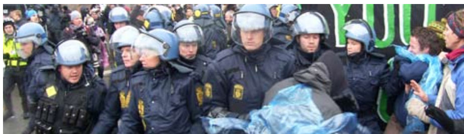
Politiet var massivt til stede ved Reclaim Power aktionen

Fra Reclaim Power-aktionen til Bella Centret den 16. december beretter en DKU'er om sine oplevelser og sit møde med 'klimafængslet' i Valby – af nogle kaldet 'Minkfarmen', af andre 'Guantanamo Jr.' Demonstrationen var organiseret i farvebetegnede sektioner med forskellig udgangspunkt