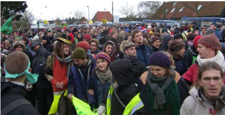
Reclaim Power aktionen den 16. december, på vej til Bellacentrum

Kunne løgne veksles til penge, ville Danmark ganske givet være en af de mere velhavende nationer. Men sådan er det ikke, og heller ikke såkaldt ”viden” er i sig selv meget bevendt mod kapitalismens kriser. De seneste år har alle, der har åbnet øjnene, været vidne