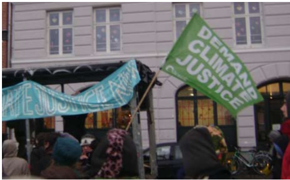
Solidaritets demonstration den 18. december, med de fængslede talspersoner for Climate Justice Action.

Der kom ingen klimaaftale ud af COP15 – ikke juridisk, ikke politisk. Der var et Copenhagen Outcome . Resultatet viser med al tydelighed, at verdens ledere ikke har den politiske vilje til at løse problemet. Der var masser af flotte ord