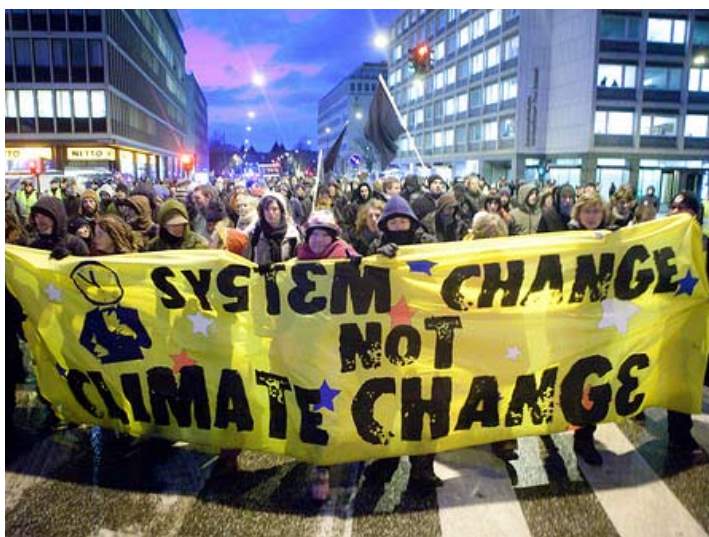
System forandring ikke klima forandring.

Der er meget få amerikanske præsidenter, som har spildt så mange chancer, der kun kommer én gang i en generation, som Barack Obama. Mere end nogen andens er fiaskoen i København hans.