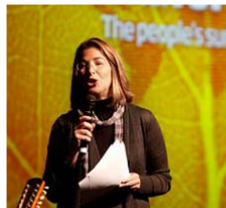
Naomi Klein, i København i forbindelse med COP15.

Anden missede chance: Hjælpepakkerne til automobilindustrien. Mens vi taler om bilkultur blev Obama, da han tiltrådte, også chef for to af de tre store automobilfabrikker og alle de udslip, de er ansvarlige for. En leder med visioner, som havde viet sig til kampen mod klimakaos ville selvfølgelig have brugt den magt til en dramatisk omdannelse af den hensygnende industri, så dens fabrikker kunne bygge infrastrukturen i den grønne økonomi, som verden desperat har brug for. I stedet så Obama sin rolle som øverste i ndskrumper, uden at røre ved industriens grundlæggende opbygning.