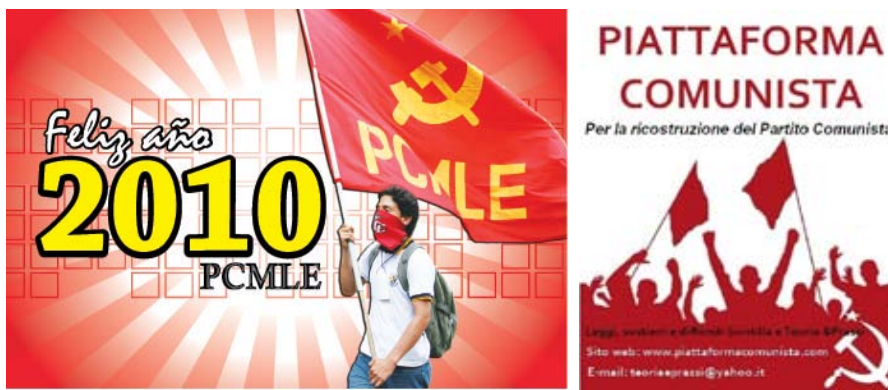
Nytårs hilsen fra PCMLE, Ecuador og Piattaforma Comunista, Italien

Vi kæmper sammen med dem for at sætte en stopper for massefyringer og fleksibilisering af arbejdsmarkedet, der betyder stadig mere deltidsarbejde. Og for forkortelse af arbejdsdagen og sikring af to hviledage om ugen, uden løn nedgang. For at sikre en anstændig mindsteløn for alle sektorer eller en