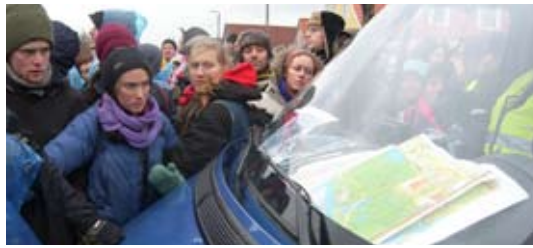
Politiet kørte meget tæt på klima aktivisterne.

Retsmøderne, som førte til vare-tægtsfængsling af disse og nogle andre i politiets søgelys efter ledere, afslørede, at politiovervågningen, udspioneringen og aflytningen af klimaaktivisterne var nærmest altomfattende. Det samme viste retsmødet for Greenpeace-aktivisterne, der gjorde den samlede sikkerhed til grin ved at byde sig selv