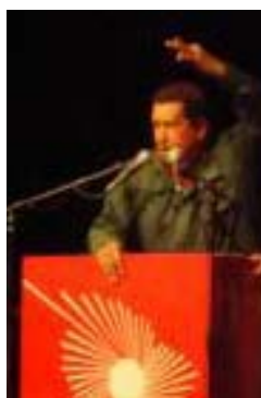
Hugo Chavez taler i Valbyhallen

- Og så må vi ikke glemme, hvad der skete i går (16. december) på topmødet – der hvor folkene ikke må komme ind! Det lykkedes for to unge mænd at komme ind, men politiet tog dem ud igen. Jeg håber de ikke har slået dem. Jeg har set en meget hård repression i Københavns gader. Det ser man ikke i Venezuela.