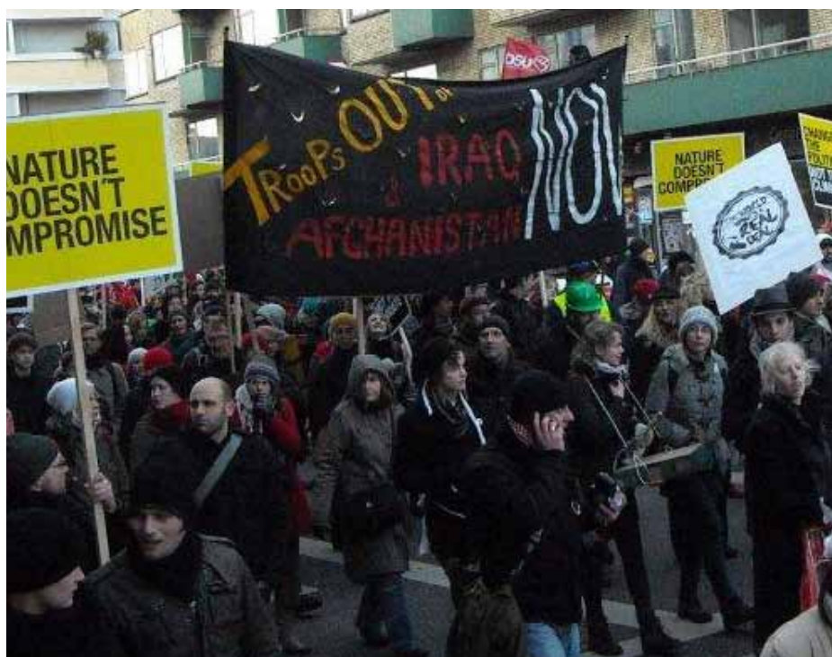
Krigenes ødelæggelser og forurening står ikke på COP15's dagsorden. Men demonstranter var med til at vise at tingene hænger sammen. Troops OUT of Iraq and Afghanistan NOW, banner i klimademonstrationen den 12. dec.

Det foregår i stor hemmelighed – men i årtier, og i det mindste siden