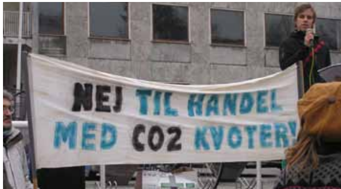
Klimanetværk Østjylland i demonstration mod CO 2 forurening den 5. december.

Men man må sige, at der er kommet andre boller på suppen fra monopolerne, regeringernes og deres mediers