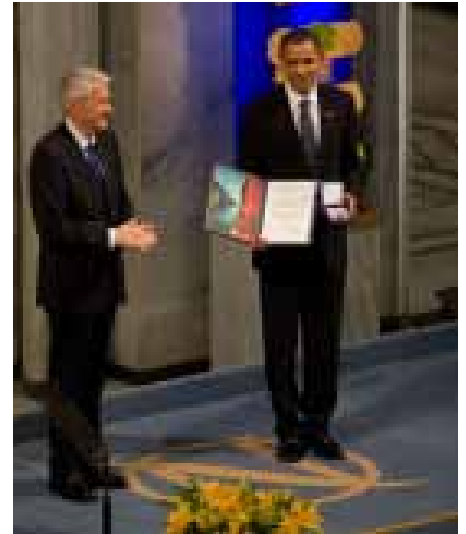
Tidligere statsminister og nuværende chef for den norske Nobelpris komite, Thorbjørn Jagland og Barack Obama ved overrækkelsesceremonien i Oslo den 10. dec.

Den amerikanske fredaktivist Cindy Sheehan, som har mistet sin søn i Irak, kommenterede Nobeltalen således: