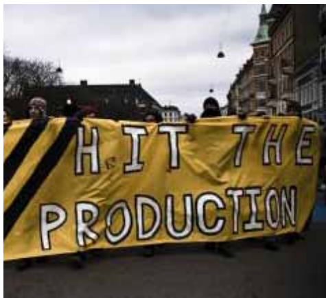
Søndagens demonstration mod klimakaos: Hit the produktion. Ruter starter på Østerbro med retning mod Nordhavnen.

Politiet omringede simpelthen demonstrationen i nærheden af Østerport Station, knuste en rude i højttalervognen, hvorpå de kidnappede den og derefter systematisk gik i gang med at visitere og anholde deltagerne.