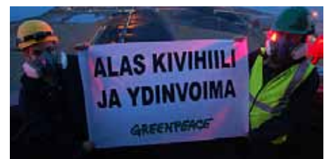
Finske Greenpeace aktivister kræver stop for CO2 udledning og atomkraft ved en aktion på kulkraftværket Meri-Pori

Det danske Mærsk - rederi og oliefirma - er eksperter på begge områder og skal både transportere CO2-gassen væk og pumpe det ned i undergrunden i de halvtomme olie-felter og samtidig pine de sidste rester i disse ud. Det er at slå