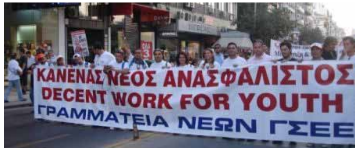
Ungdomsarbejdsløsheden er historisk høj i hele EU. På billedet demonstrerer unge i Grækenland med et krav om jobs i forbindelse med en 24 timers generalstrejke i 2008.

Herhjemme lægger regeringen op til, at "de offentlige finanser skal konsolideres" igennem "budgetstramninger". Det vil sige gennem offentlige besparelser, herunder den offentlige service i kommunerne. Og regeringen henviser igen til EU med dets krav om at statsun-