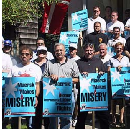
Protest i 2004 ved Langelinje mod Mærsk. Den konkrete anledning var at vise solidaritet med amerikanske arbejdere.

Mere end et par tusind ansatte på Lindøværftet havde kort forinden fået meddelelse om den kommende lukning, hvor al skibsbygning stopper senest i 2012. Omkring tusind af dem havde også fået at vide, at de fra februar kunne se i vejviseren efter job på Lindø. Nu så de, hvordan danske skatteydere under VKO-regeringen belønner den globale koncern Mærsk, verdens største