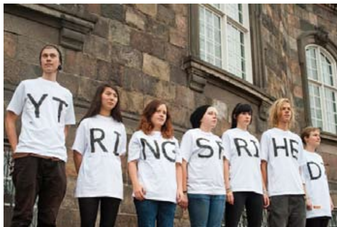
Aktivister lavede en aktion på tilhørerpladserne i Folketingssalen under andenbehandlingen.