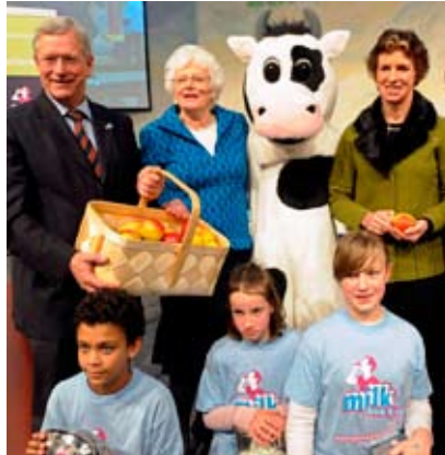
Fischer Boel i EU-æble reklame

Den netop afgåede landsbrugskommissær Mariann Fischer Boel har skrevet en 20 sider lang pjese om hendes mange fortjenester gennem fem år i kommissionen. Hun kunne have nøjes med at skrive "Markedet bestemmer alt". For hvad er det egentlig, en dansk kommissær bedriver?