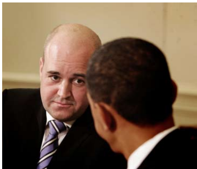
Det svenske EU formandsskab ved statsminister Fredrik Reinfeldt, rejste den 3. november til USA, for at tale om det fælles mål om at forhindre at FN's klimatomøde ender i krav til de rige lande.

Det vil sige en plan for reduktion af CO 2 , der består i noget, der bedst kan sammenlignes med en hvidvaskningskarrusel, der indgår i et sindrigt samspil mellem udviklingslandenes krav