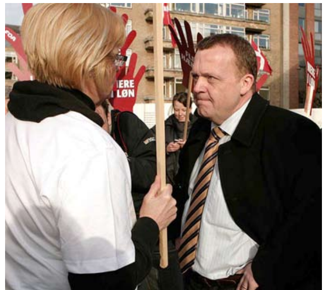
Billede fra konflikten i 2008, FOA møder ingen forståelse for kravet om mandeløn til kvindefag ved den kommende statsminister

For at forstå tingene, som de er, må adskillige myter aflives. F.eks. den at omfattende uddannelse nærmest automatisk sikrer bedre løn – og sikrer kvinderne ligeløn. Det gør det ikke. De danske kvinder er generelt bedre uddannede end mændene, og tjener altså væsentligt mindre. Skævheden forstørres også i et helt livsforløb, hvor kvinderne pga. fødsler og barsel ikke optjener så meget i pension som mændene.