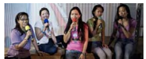
Piger fra Filippinerne udgør godt 70 procent af au pair i Danmark. Billede fra teaterstykket Hush little baby

Han nævner også, at sagen om den 21-årige filippiner igen viser den totale mangel på retssikkerhed, som især filip-