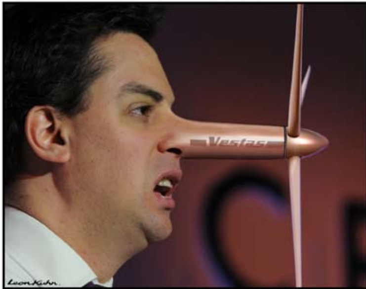
I kampen for at bevare grønne arbejdspladser er Ed Miliband, billedet, afsløret som løgner. Støttepostkort for Vestasarbejdere.

tioner – som f.eks. Miljøforsvarsfonden og Rådet til Forsvar af Naturens Resourcer – med at arbejde på strategier for kvotesalg i det håb at redde lidt legitimitet til Obama, fordi disse lovforslag udgør et ”første trin” i retning af mere seriøse reduktioner af udledningen, efter hvad de påstår.