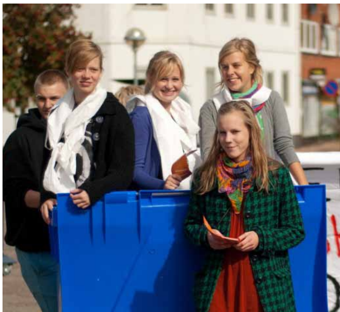
Studerende demonstrerer i affaldscontainer

Et af de problemer "ud af krisen" fokuserer på er at der i 2009 er startet 638 1.g-klasser med over 28 elever – et tal, der er højere end nogensinde før, og som skader både undervisningsmiljøet, indlæringen og trivslen. Det får konsekvenser for både frafald og faglighed.