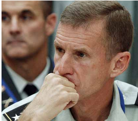
Den amerikanske general Stanley McChrystal forlanger flere tropper til Afghanistan med det samme

Som konsekvens vil Canada, der fastholder at trække sine soldater ud af Afghanistan i 2011 på trods af stort pres for at blive, nu tilbyde hundreder af