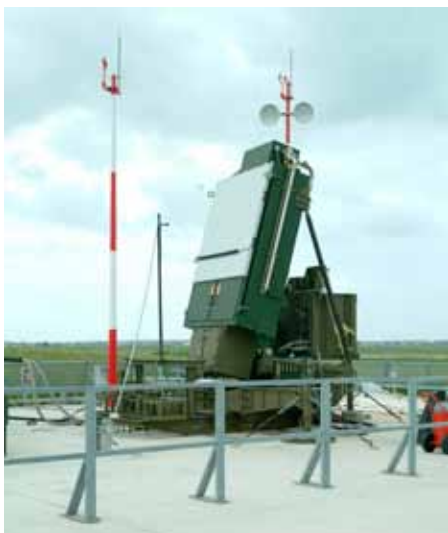
Luftforsvars system fra våben-giganten Lockheed Martin

skjoldstruktur. USS Lake Erie, en led-sager-missilkrydser af Aegis typen, nedskød en amerikansk satellit i rummet i februar 2008 med et SM-3 missil, hvad nogle i Rusland betragter som den indledende salve for de amerikanske rumkrigsplaner.