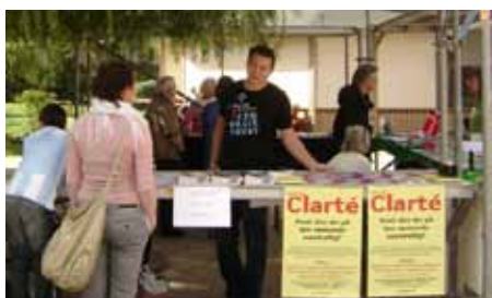
Det danske Clarté

Festivalledelsen takker alle, der deltog og bidrog til at gøre denne festival til en uforglemmelig begivenhed.