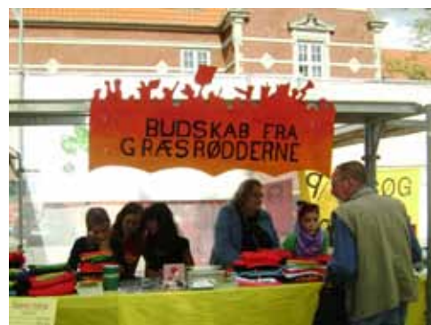
Budskab fra Græsrodderne