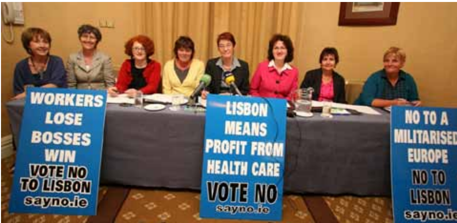
Stem nej igen kampagnen Sayno.ie

vej til at synke i Atlanten – hvis irerne ikke siger ja denne gang.