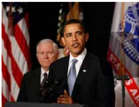
Robert Gates og Barack Obama

De seneste to år har ledende valgte amerikanske embedsmænd skreget op om anvendelse af Artikel V i forsvaret af Estland imod påståede cyberangreb