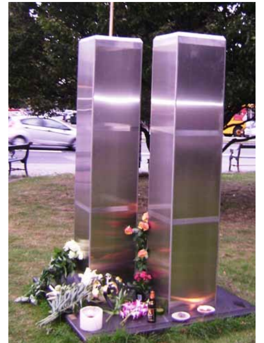
9/11 skulptur opstillet ved Sølvtorvet, København, 11. september 2009

Hvis I vil have et øjeblik stilhed så stands oliepuimperne afbrud motorerne og fjernsynene sænk krydstogtskibene lad aktiebørserne krakke sluk de kulørte lamper slet sms-beskederne afspor togene, stop metroen.