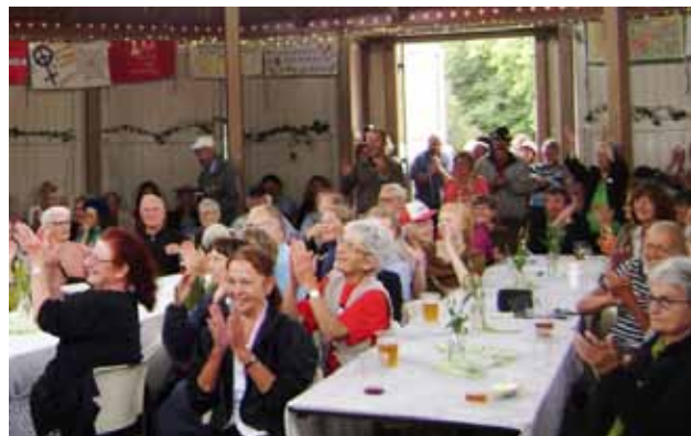
Begejstring i pavillonen