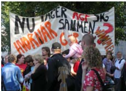
Demonstration i Århus mod nedskæringer i 2006