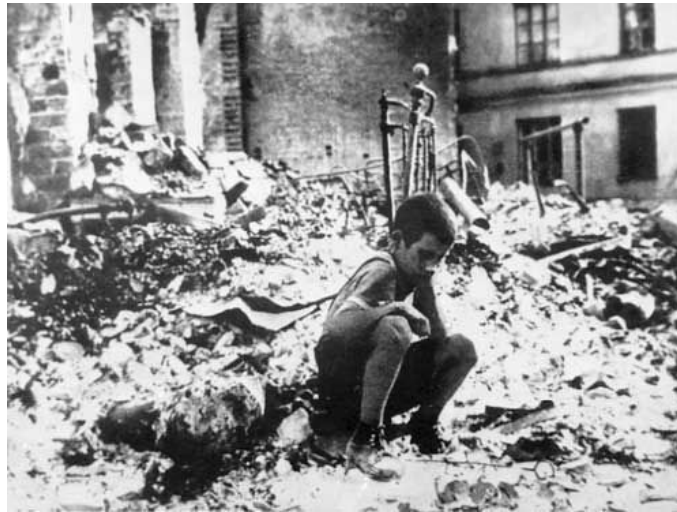
1939 Tyskland angriber Polen. Billede af overlevende i ruinerne i Warsava.

Selv i august 1939 var det stadig muligt at forhindre 2. verdenskrigs udbrud.. Alt, hvad der behøvedes, var samtykke fra Storbritannien og Frank-