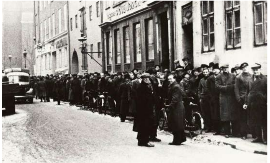
Arbejdsløse venter på snekort i februar 1941

Mange arbejdsløse tvinges over på kontanthjælp efter længere tids arbejdsløshed, hvilket betyder, at der overhovedet ikke er nogen hjælp at hente, såfremt den anden part i en husstand har en normal arbejdsindtægt. Helt galt går det, hvis begge er på kontanthjælp og rammes af den 300 timers regel,