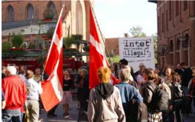
Støttedemo for irakerne, Flakhaven Odense

Situationerne er sammenlignelige på en del punkter, selvom der også er forskelle. En af dem er, at Danmark i dette