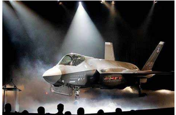
F-35 Joint Strike Fighter, præsenteres i 2006

Både AP Møllers og Termas inddragelse i projektet er uden tvivl en påskønnelse af Danmarks rolle som tæt allieret