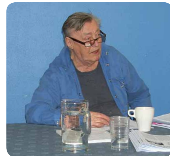
Der var over 80 års aldersforskel på lejrens yngste og ældste deltagere