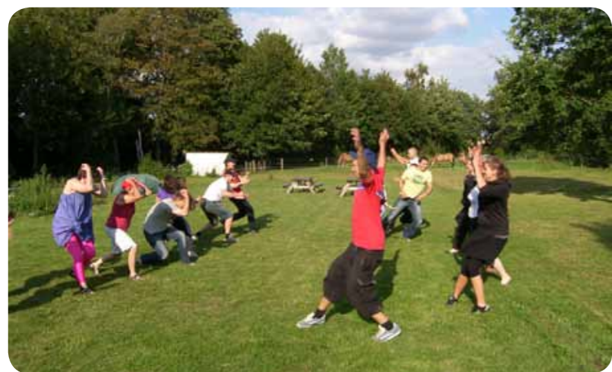
Årets lejr blev afholdt i strålende solskin på Sjælland

"Skal man forstå hvad sådan en lejr virkelig drejer sig om bliver man nok nødt til selv at deltage" siger en arrangørerne med en slet skjult henvisning til at næste års lejr allerede er på tegnebrættet.