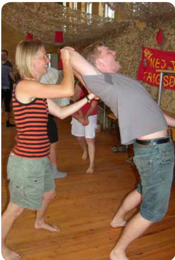
De revolutionære til selvforsvarsworkshop

De revolutionære har været gennem både diskussioner og praktiske workshops, og er på den måde blevet styrket både i politisk teori og i praksis. Eller som det blev talt om i kultur-workshoppen